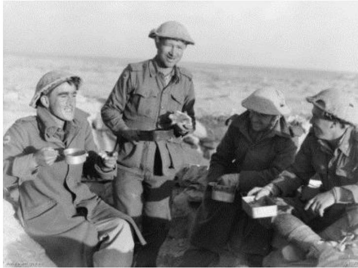
Люди из последнего австралийского батальона, остававшегося в Тобруке в декабре 1941 года