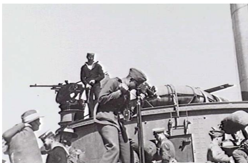
Пэрер на борту австралийского крейсера Perth в порту Пирея. 03.08.1941