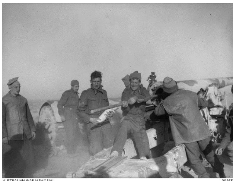
Британские артиллеристы в бою под Дерной

что Пэрер с того момента был обречен. Вопрос был не в том, будет он убит или нет, а в том, когда он будет убит.