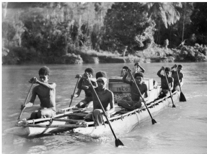
Папуасы поднимаются вверх по реке Лакекаму с грузами для защитников Вау

весом 50 фунтов (23 кг) для сражающихся на направлении Вау-Саламау австралийцев. На пути этой группы был перевал высотой около 9 000 футов (2 743 м). Люди обливались потом днем и тряслись от холода ночью, дожди шли непрерывно. Даже носильщики страдали от всевозможных болезней – нескольких пришлось отправить обратно, один папуас умер от пневмонии. Их ношу пришлось нести остальным. Тяжелее всего были подъемы по крутым горным склонам. Наступил момент, когда, по воспоминаниям Уайта, даже Пэрер стал выглядеть мрачновато. Еще один папуас умер от разрыва селезенки, но, в итоге, грузы были доставлены в Вау.