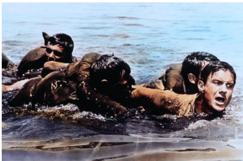
Кадр из фильма PT-109. Моряки буксируют раненого товарища к берегу. Справа – актер Клиффорд Робертсон III (Clifford Robertson III, 1923-2011, в годы ВМВ служил на транспортных судах) в роли Джона Кеннеди.