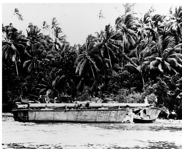
Слева - торпедные катера в сухих плавучих доках военно-морской базы на острове Рендова; справа - катер PT-117 после налета японской авиации 1 августа 1943 года