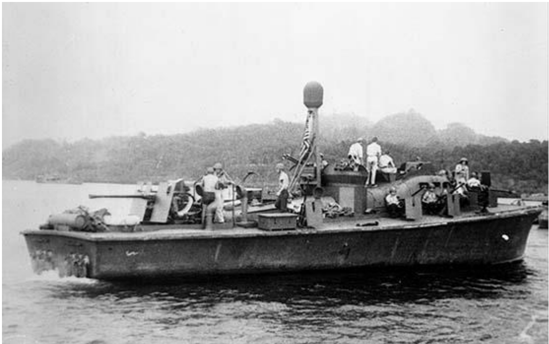
Торпедный катер PT-59