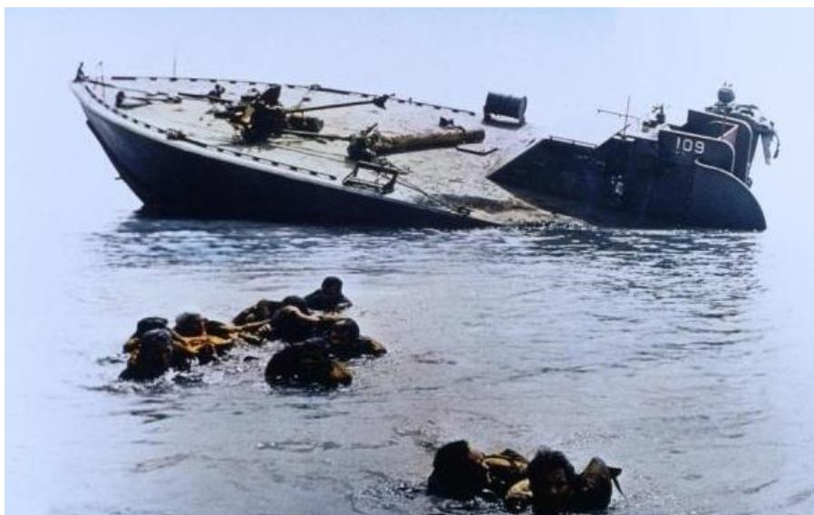
Кадр из фильма PT-109 (1963). Моряки покидают обломок своего катера.

знали, был расположен неподалеку,» - позднее вспоминал Кеннеди. Моряки отправились в путь в направлении небольшого островка, находившегося в 3 ½ милях от них.