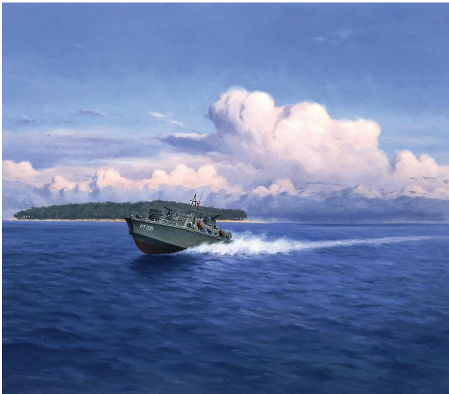
Катер PT-109 в походе

Джон Кеннеди , президент США в 1961-1963 годах, незаурядный политик, трагически погибший в результате покушения на его жизнь, стал одной из самых знаменитых личностей в истории 20-го столетия. О его службе в ВМФ США известно меньше, чем о карьере политика, хотя в годы ВМВ на Тихом океане он проявил себя как храбрый и умелый командир.