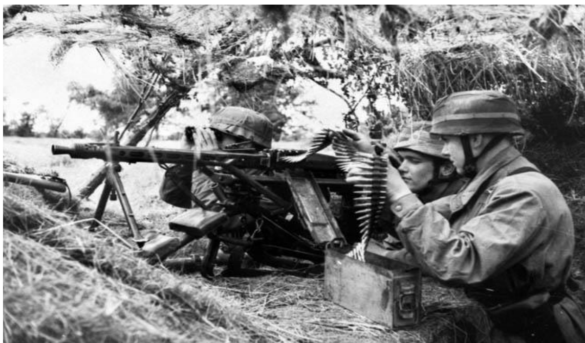
Немецкие парашютисты на оборонительной позиции