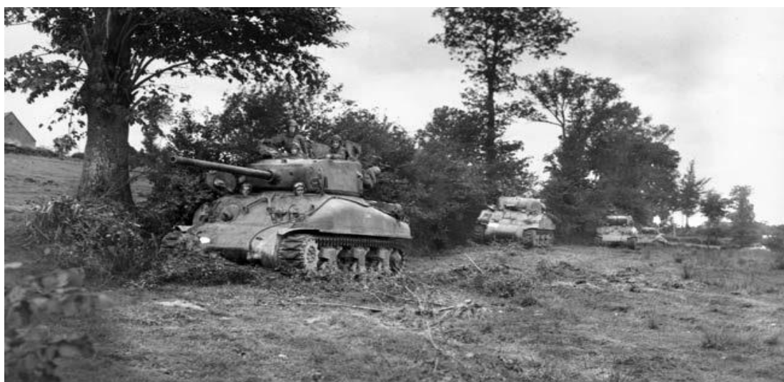
Танки Шерман продвигаются вдоль живой изгороди. Нормандия, 1944