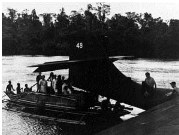
Женщины и дети пересаживаются с лодки островитян в прибывшую для их эвакуации Каталину. Северо-запад Новой Гвинеи, вероятно, первая половина 1942 года

Возможности союзников по прогнозу времени прохождения японских конвоев через определенные участки ТВД значительно увеличились, когда к работе приступили Хенри Джосселин и Джон Кинэн на острове Велла Лавелла и Ник Уодделл и Карден Ситон на острове Шуазель. Проводка конвоев Токийского Экспресса , оказавшихся под систематическими атаками Каталин , торпедных катеров и иногда более крупных кораблей, стала рискованным занятием. В среднем быстроходные японские эсминцы, выделенные для операций по доставке грузов гарнизонам, размещенным на Соломоновых островах, имели срок выживания не более двух месяцев.