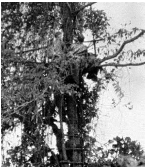
Редкая фотография береговых наблюдателей, использующих для своей работы дерево. Новая Гвинея