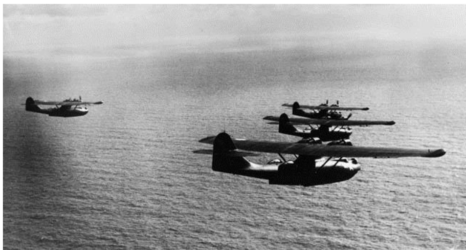
Группа Каталин патрулирует воздушное пространство над юго-западом Тихого океана. Май 1944 года

Приступив к воздушным операциям над Соломоновыми островами, Каталины стали выполнять различные задачи, в том числе, выявление вражеских артиллерийских позиций в ситуациях, когда корабли союзников обстреливали японские базы. По мере роста воздушной мощи союзников на этом ТВД, эти самолеты сконцентрировались на бомбардировках, поисково-спасательных операциях и поддержке усилий береговых наблюдателей.