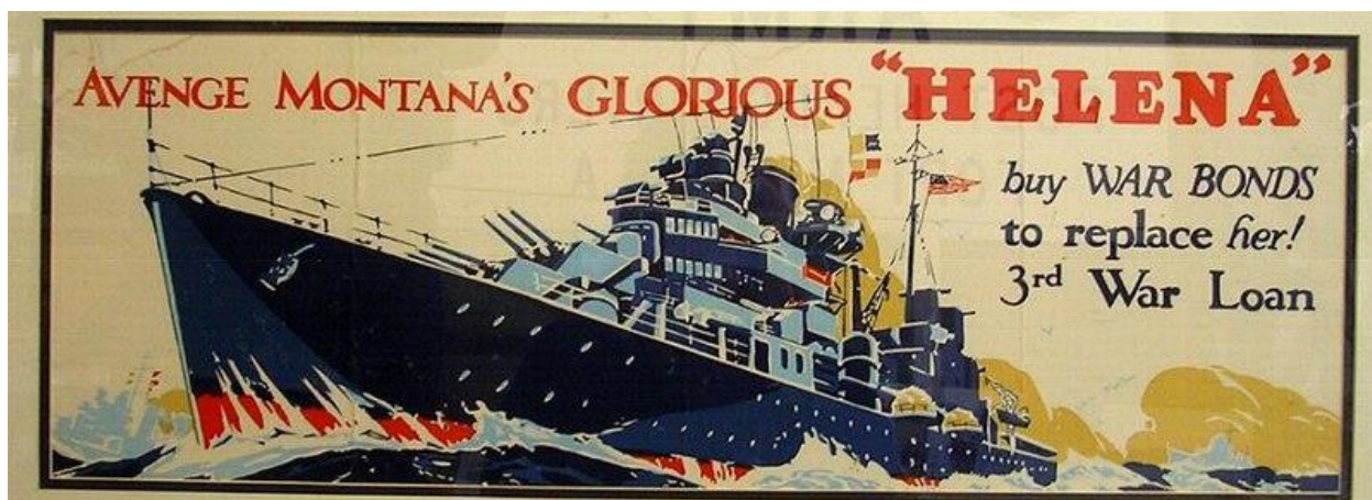
Плакат, призывающий покупать облигации военных займов для того, чтобы построить новый корабль вместо погибшего крейсера Helena

важной частью их деятельности на всех стадиях кампании. Наиболее заметным эпизодом в этой связи стало спасение 165 членов экипажа легкого крейсера Helena , которых наблюдатели с помощью дружественных островитян прятали, пока за ними не прибыли корабли ВМФ. Крейсер был потоплен 6 июля 1943 года японскими эсминцами Suzukaze и/или Tanikaze в бою в заливе Кула/Kula между островами Коломбангара и Нью-Джорджия.