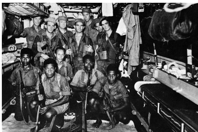
Группа островитян и австралийских береговых наблюдателей на борту американской подводной лодки Дасе. Они вот-вот должны высадиться на побережье Новой Гвинеи в районе пункта Холландиа/Hollandia