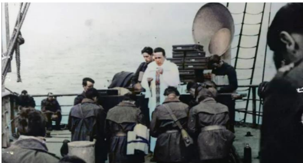
Польские солдаты совершают причастие на пути в Нарвик