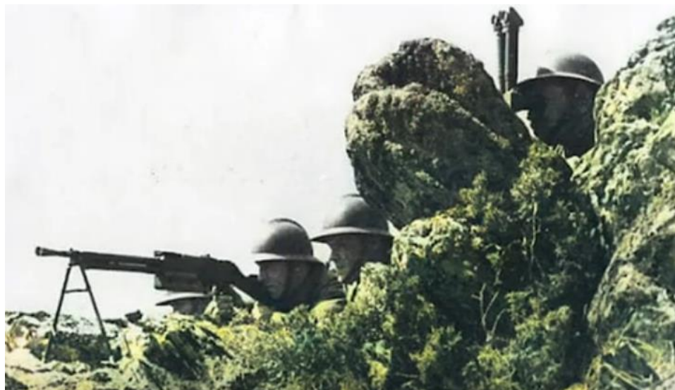
Польские пулеметчики под Нарвиком