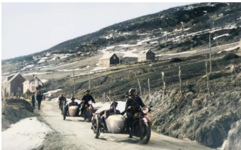
Польские разведчики на мотоциклах. 23 мая 1940 года

Следующее боестолкновение произошло 23 мая. Моторизованный взвод польских разведчиков осуществил рейд, чтобы проверить сообщения, в которых говорилось о происшедшей эвакуации немецких войск с полуострова Анкенес. Разведчики на мотоциклах стремительно ворвались в город и заняли несколько домов. Немцы, первоначально застигнутые врасплох, быстро пришли в себя, поняли, что им противостоят очень малочисленный отряд, и отрезали полякам путь к отступлению. Польские разведчики сумели вырваться из окружения, потеряв при этом одного человека.