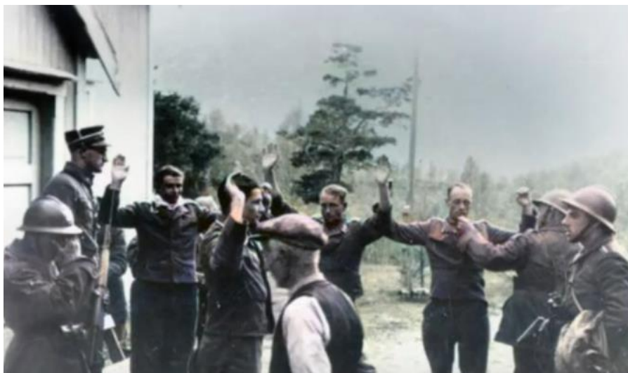
Польские солдаты и пленные немцы

В 02.00 29 мая в атаку пошла 2-я Рота 2-го Батальона. Она попала под сильный пулеметный огонь с Высоты 405 , но два взвода 2-й Роты 4-го Батальона захватили эту высоту и дали своим товарищам продолжить продвижение вперед в направлении деревни Ньюборг/Nuborg (2 км к югу от Нарвика на юго-восточном берегу фьорда Beisfjord в его горловине), которую они взяли к 09.00. Немцы начали покидать свои позиции по морю, но попали под огонь поляков. Две лодки перевернулись, и несколько человек утонули, сумевшие добраться до берега вплавь были взяты в плен.