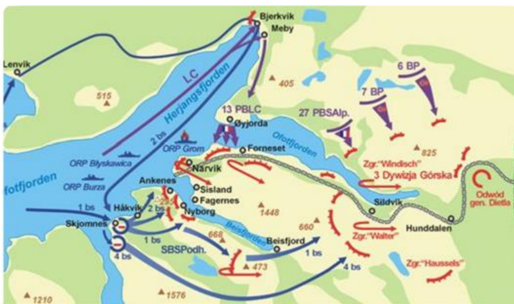
Карта боевых действий в ходе атаки союзников на Нарвик. Синими стрелками показаны направления атак поляков, фиолетовыми – французов и норвежцев, красными – направления отхода немцев

Поляки получили приказ занять полуостров Анкенес, который обороняли примерно 2 000 немцев. 1-й Батальон поляков должен был взять высоты 670 и 773 южнее деревни Анкенес, в то время как 2-й Батальон должен был сбить немцев с позиций, расположенных близ деревни. Удерживать высоты 677 и 734 должны были несколько отделений 4-го Батальона, остальные его части и 3-й батальон оставались в резерве.