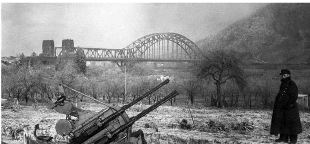
Немецкий солдат рядом с 20-мм зенитной пушкой близ Ремагена на фоне железнодорожного моста Ludendorff. Январь 1945 года

Поскольку германское верховное командование рассматривало Рейн как последний оборонительный рубеж на западе и последовательно взрывало мосты через реку один за одним, командование союзников понимало, что придется организовывать ее форсирование с помощью десантных средств, но не в секторе 1-й Армии, в который попадал район Ремагена. Переправа была намечена гораздо севернее, в секторе наступления 21-й Армейской Группы фельдмаршала Монтоммери (Bernard Montgomery).