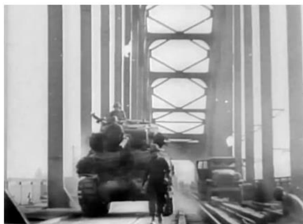
Слева - восточная часть моста Ludendorff под огнем немецкой артиллерии после того, как он был захвачен частями американской 9-й Танковой Дивизии. 7 марта 1945 года; справа – Шерман проезжает через мост, в то время как на нем ведутся ремонтные работы