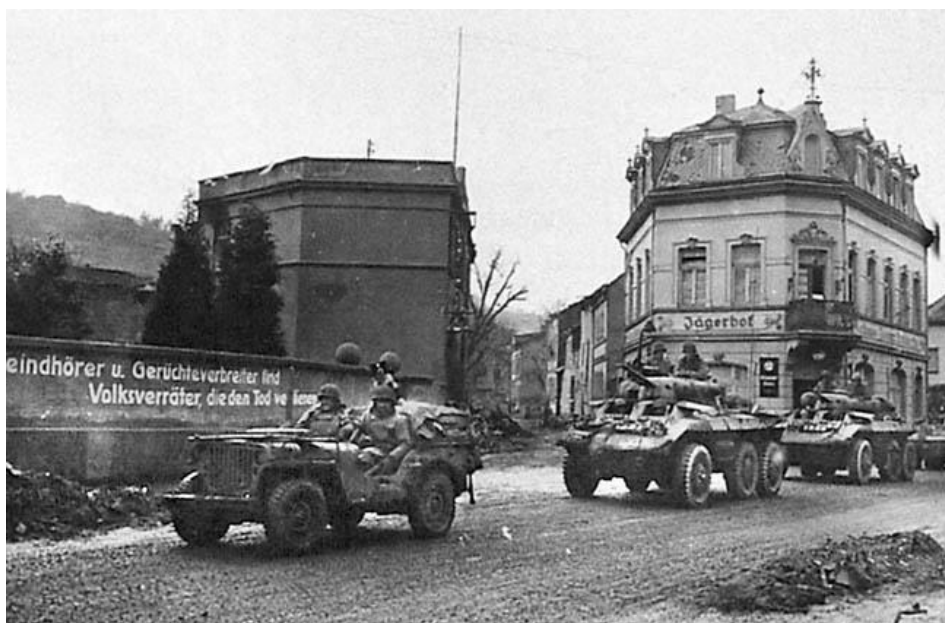
Американские джипы и бронемшины в Ремагене

Энджмэн, рассмотрев раскинувшуюся в долине местность, пришел в восторг от вида стоявшего на своем месте моста. Через утреннюю дымку он сумел разглядеть, что немецкие инженеры уложили на железнодорожное полотно дощатый настил, сделав мост проходимым для автотранспорта. Длинная колонна немецких машин продвигалась по мосту буквально на расстоянии вытянутой руки от американцев.