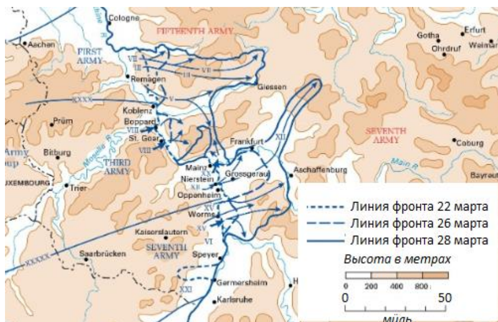
Продвижение линии фронта на правобережье Рейна – 22-28 марта 1945 года