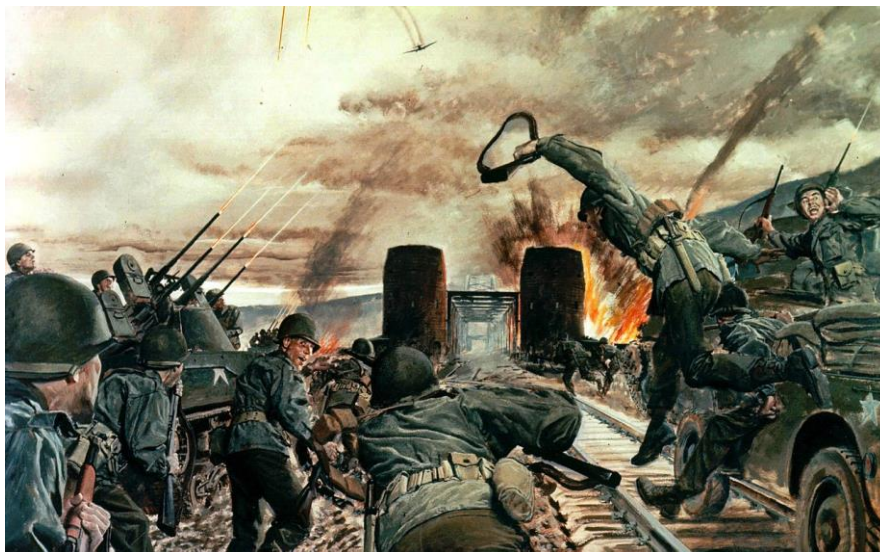
Так художник изобразил атаку американской пехоты на мост...