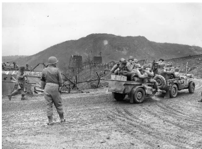
Джип с прицепом, забитым американскими солдатами, на западном берегу Рейна неподалеку от моста Ludendorff

6 марта генерал Ботш приказал снова заминировать мост Ludendorff после того, как подрывные заряды были убраны для предотвращения их случайной детонации из-за бомбардировок с воздуха и разрушения моста до того, как все германские войска на этом участке перейдут на восточный берег Рейна.