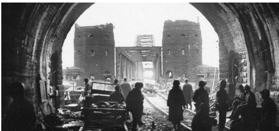
Американские солдаты рядом с пленными немцами и гражданскими лицами после того, как им удалось перейти на правый берег Рейна по мосту Ludendorff

Однако немцы продолжали оказывать сопротивление. Расчеты зенитных батарей, находившихся над бровкой обрывистого восточного берега, оставались на своих местах, так что эти огневые точки было необходимо нейтрализовать. Тиммерманн приказал лейтенанту Барроузу взять с собой 2-й Взвод, подняться по склону и зачистить высоты, получившие у американцев название Flak Hill /Зенитная Высота. Этот приказ было легче отдать, чем выполнить: рыхлый грунт делал восхождение на высоты опасным занятием. Немцы продолжали вести огонь, и ведомый Барроузом взвод Роты В понес ощутимые потери. Однако пехотинцы выполнили приказ и заставили зенитки замолчать. Им также удалось разглядеть то, что немцы готовятся к контратаке, и вызвали огонь артиллерии, чтобы сорвать ее.