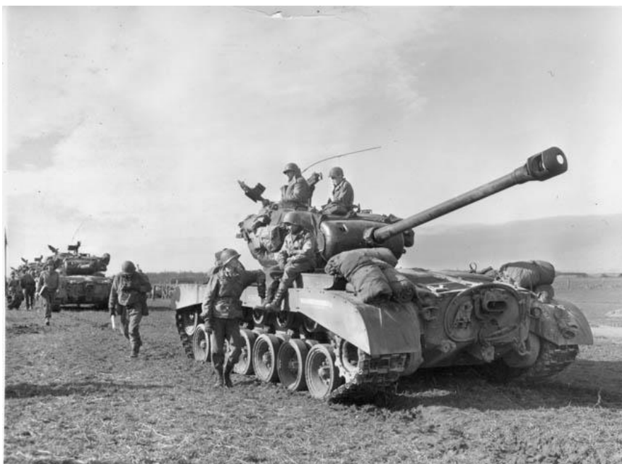
Март 1945 года. Американский тяжелый танк M26 Першинг/M26 Pershing на одной из дорог западной Германии. Взвод таких танков примет участие в боях в районе Ремагена