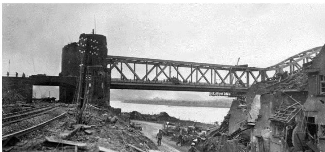
11 марта 1945 года. Мост активно используется для переброски войск и техники на восточный берег Рейна

К концу третьего дня операции на плацдарм был переброшен 308-й Пехотный Полк и остальные части 310-го Пехотного Полка вместе с 60-м Пехотным Полком и дополнительными частями зенитной артиллерии. Была усилена противотанковая оборона плацдарма за счет истребителей танков, сопровождавших полковые боевые группы. Хотя артиллерийские части еще не были готовы к бою на восточном берегу Рейна, дивизионные и корпусные батареи поддерживали занимавшие плацдарм войска огнем с расположенных на западном берегу позиций.