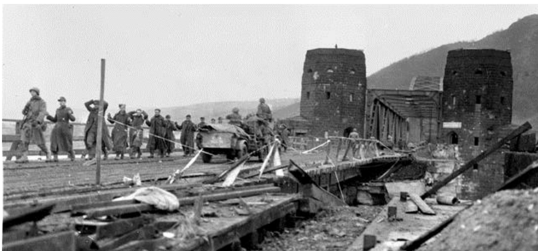
Американцы конвоируют военнопленных на западный берег Рейна

информацию о случившемся, сказал Брэдли: «Правильно, перебрасывайте через реку все, что у вас под рукой. Это был самый лучший прорыв из всех, осуществленных нами... К черту планировщиков! Само собой, Брэд , продолжайте, и я дам вам все, что у меня есть, чтобы удержать плацдарм. Мы воспользуемся им наилучшим образом, даже если местность не слишком годится для этого.»