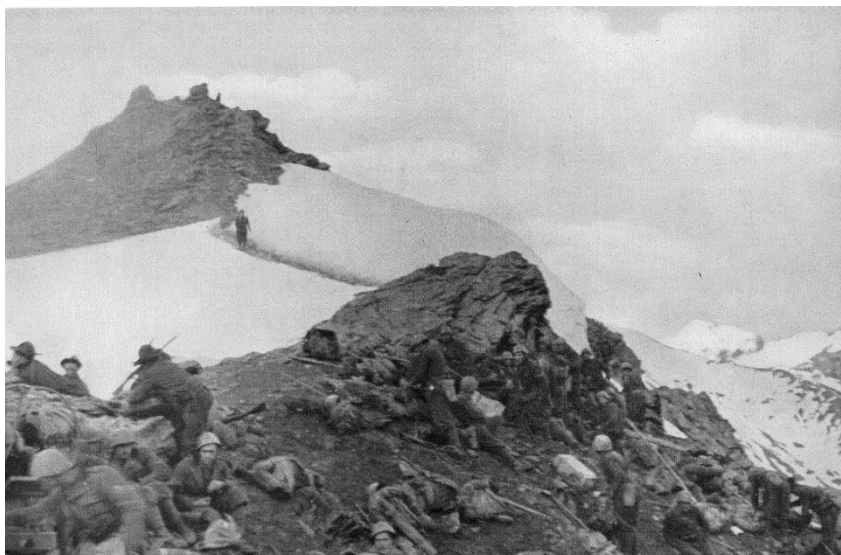
Солдаты 5-го Альпийского Полка итальянцев в бою