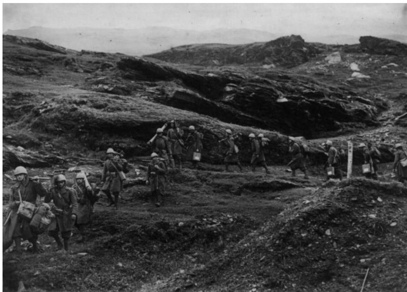
Итальянские солдаты на марше. Альпы

Однако на стороне итальянцев было значительное преимущество в живой силе. Позднее генерал Олри писал: «Мы уступали противнику в численности 7:1 в долине Тарантез/Tarentaise (на Альбервильском направлении – ВК), 4:1 на Морьенском (Maurienne, 30 км к СЗ от Модана) направлении, 3:1 под Бриансоном, 12:1 под Кейрасом (Queyras, северный фланг Ментонского направления)), 9:1 под Тине (Tignes, центр Ментонского сектора), 7:1 в районе Л'Осьона (L'Aution) и Соспеля (Sospel) (южная часть Ментонского сектора) и 4:1 в районе Ментона.»