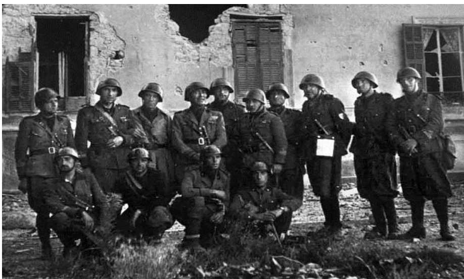
Итальянские солдаты позируют перед фотографом после взятия Ментона