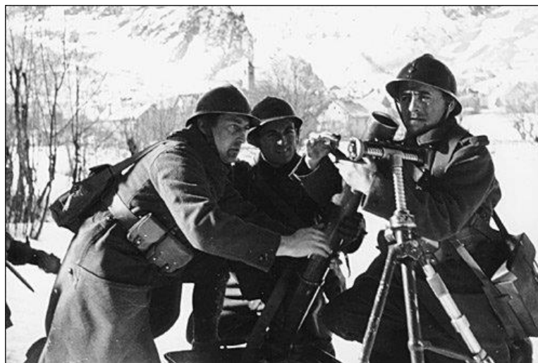
Французские солдаты устанавливают на огневую позицию 81-мм миномет

Центральная колонна продвинулась через перевал Col du Petit Saint-Bernard , но была остановлена огнем с укрепленной позиции Redoute Ruinée . 101-я Моторизованная Дивизия Trieste из состава Армии По была переброшена на фронт из Пьяченцы, чтобы усилить давление на противника на этом участке фронта. В 11.00 мотоциклетный батальон из состава Trieste прорвался через перевал и быстро продвинулся на 2 км. Батальон приступил к переправе через реку под сильным пулеметным огнем, пока инженеры были заняты ремонтом разрушенного моста, и понес тяжелые потери.