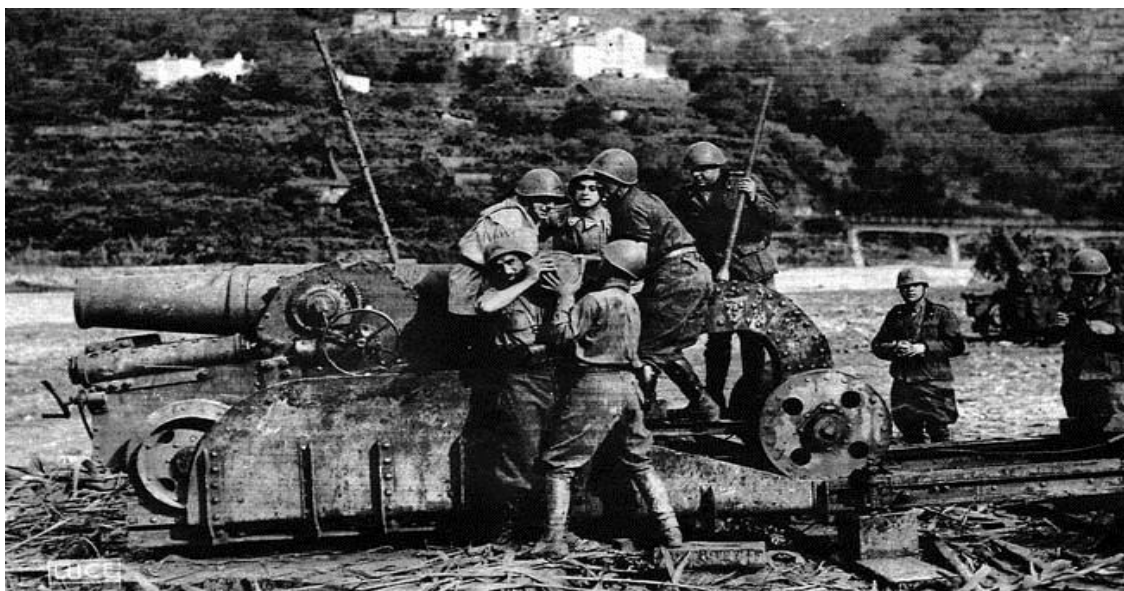
Итальянские артиллеристы заряжают гаубицу, готовясь открыть огонь. Альпы, лето 1940 года

Итальянцы сумели окружить мощный форт de la Turra , но к моменту подписания перемирия он все еще вел огонь. Все выпущенные по нему снаряды – около 1 000 – так и не смогли пробить стальные и бетонные стены его башен. Также до конца боев оказывал сопротивление передовой блокпост в районе деревни Арселлинс/Arcellins. Итальянская колонна не вышла к Ланлебуру, который был занят за несколько дней до этого людьми майора Бокалатте.