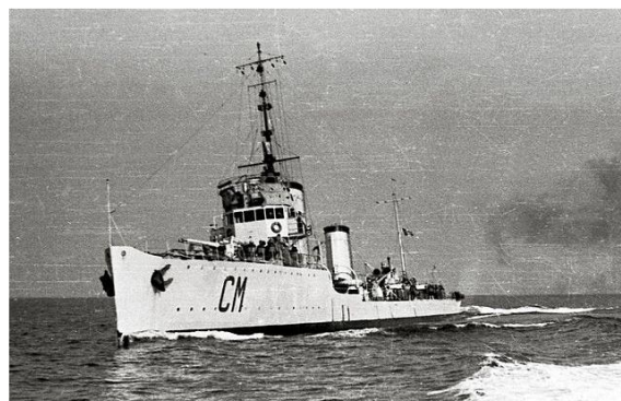
Слева – торпедный катер MAS 528 ; справа – миноносец Calatafimi

Французские моряки отрапортовали о том, что «подвергли свои цели продолжительной ... бомбардировке», но отметили, что «результаты обстрела побережья ... были близки к нулевым, нанеся малозначительный ущерб.» Экипаж миноносца Calatafimi был уверен в том, что «вспышки снарядов, попавших в Albatros , [на самом деле] представляли из себя