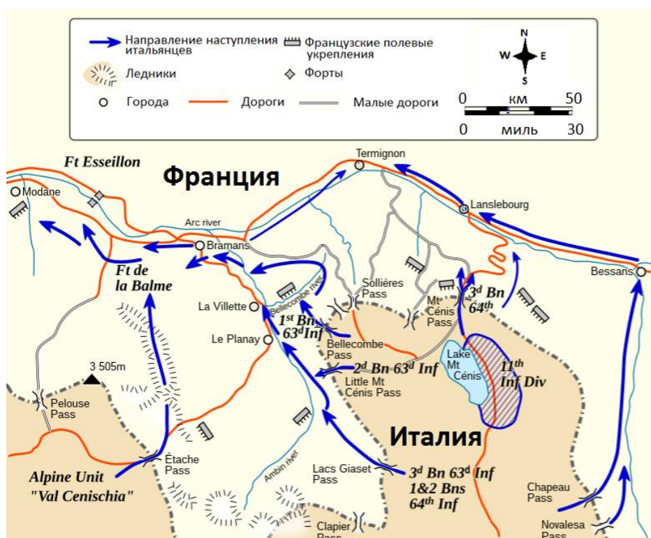
Карта боевых действий в районе горы Сени

К югу от Альпийского Корпуса 1-й Армейский Корпус наступал в секторе фронта шириной около 40 км, протягивавшемся от горы Сени до перевала Col d'Étache . Первоначально корпус должен был осуществить прорыв в районе деревень Бессанс/Bessans, Ланлебур/Lanslebourg и Сольер-Сардьер/Sollières-Sardières полосы фортов серии укреплений ( Saint-Gobain , Saint-Antoine , Sapey ), господствовавших над городом Модан/Modane. После этого корпус должен был повернуть на север в направлении Альбервиля.