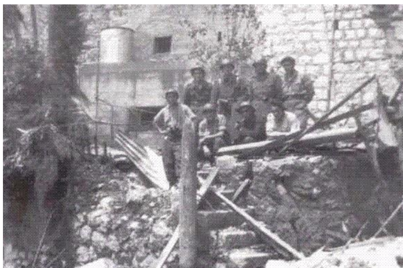
Защитнику форта Pont Saint-Louis

Наступающая вдоль побережья Дивизия Cosseria была встречена сильным артиллерийским огнем французов с позиций на мысе Мартен и укреплений Mont Agel , который уничтожил бронепоезд. Тем не менее, 22 июня в условиях штормовой погоды и тумана итальянцы заняли район горы Ле Гранж де Сен-Поль/Les Granges-Saint-Paul неподалеку от Ментона. Затем Муссолини отдал приказ этой дивизии наступать, не считаясь с потерями... В ночь с 22 на 23 июня, все еще под прикрытием тумана, Cosseria обошла мыс Мартен и вступила в квартал Ментона Garavan . Обойденные французские части продолжали сражаться, ведя огонь из орудий фортов по итальянским кораблям и судам. На улицах Ментона разгорелся ожесточенный бой, в котором имевшие большое численное превосходство итальянцы постепенно взяли вверх. Они пробились через квартал Baousset и 23 июня взяли расположенной на холме монастырь капуцинов Notre-Dame de l'Annonciade . Запланированный десант с моря чернорубашечников ( Milizia Volontaria per la Sicurezza Nazionale - MVSN ) в районе квартала Garavan был отменен из-за сильного волнения и полнолуния. Все французы за исключением гарнизона передового форта Pont Saint-Louis покинули Ментон.