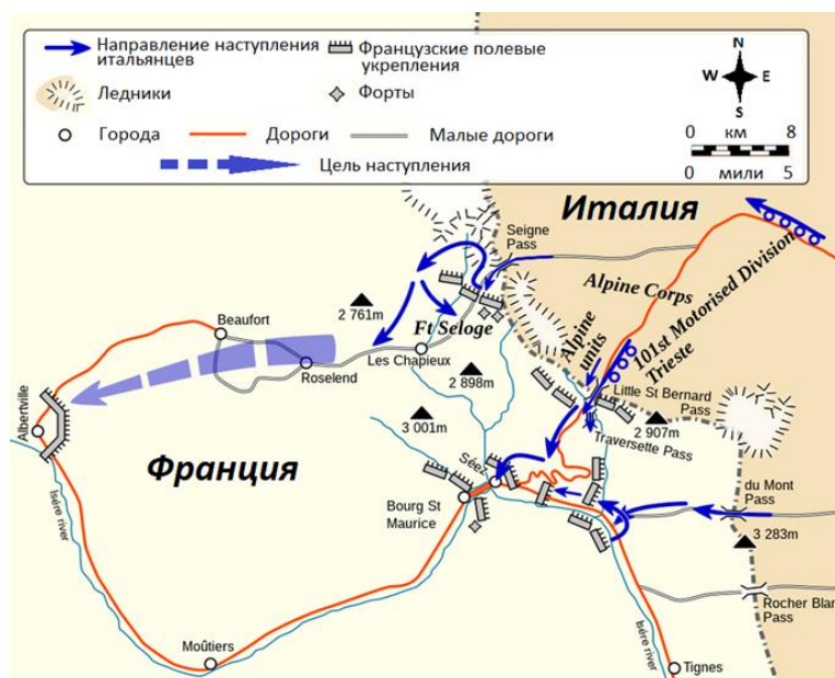
Боевые действия на Альбервильском направлении

Основной удар наносила 4-я Армия итальянцев, которой командовал генерал Альфредо Гуццони (Alfredo Guzzoni). Альпийский Корпус итальянцев, усиленный артиллерией 4-го Армейского Корпуса на левом фланге, перешел в наступление в секторе фронта протяженностью 34-40 км от перевала Col de la Seigne к перевалу to the Col du Mont. Основной удар проходил через перевал Col du Petit Saint-Bernard, который мог бы стать самым легким путем, если бы французы не взорвали здесь мосты. На этом направлении держал оборону старый разрушенный форт Redoute Ruinée, на котором находились 70 французов, располагающих пулеметами, и аванпост в пункте Селож/Seloge (Séloges). Всего в районе города Бур-Сен-Морис/Bourg-Saint-Maurice, находившегося в подсекторе обороны французов Tarentaise, занимали позиции 3 000 человек с 350 пулеметами, кроме того, эти силы поддерживали 18 артдивизионов с 60 орудиями. На этом направлении Альпийский Корпус итальянцев должен был захватить Бур-Сен-Морис, Ле Шапье/Les Chapieux, Се/Сээз и Тинье/Tignes. После этого итальянцы должны были продолжить наступление в сторону Бофора/Beaufort и Альбервиля.