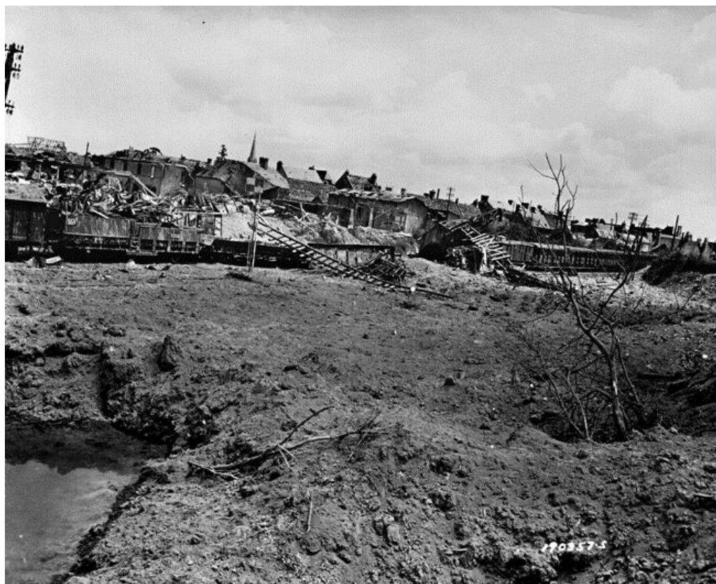
Железнодорожное депо Карантана лежит в руинах после бомбардировок с воздуха и обстрелов с моря. Фотография сделана через несколько дней после занятия города американцами...

6-й Полк, точнее, то, что от него осталось, теперь находившийся в оперативном подчинении 17-й Дивизии SS, получил приказ занять и удерживать городской вокзал, пока танкисты будут наносить удар от Карантана в направлении побережья. Парашютисты, тем временем, сумели занять городской вокзал в соответствии с полученным приказом и подготовились к обороне. Они хорошо знали участок боев и атаки штурмовой авиации союзников уже мало беспокоили их.