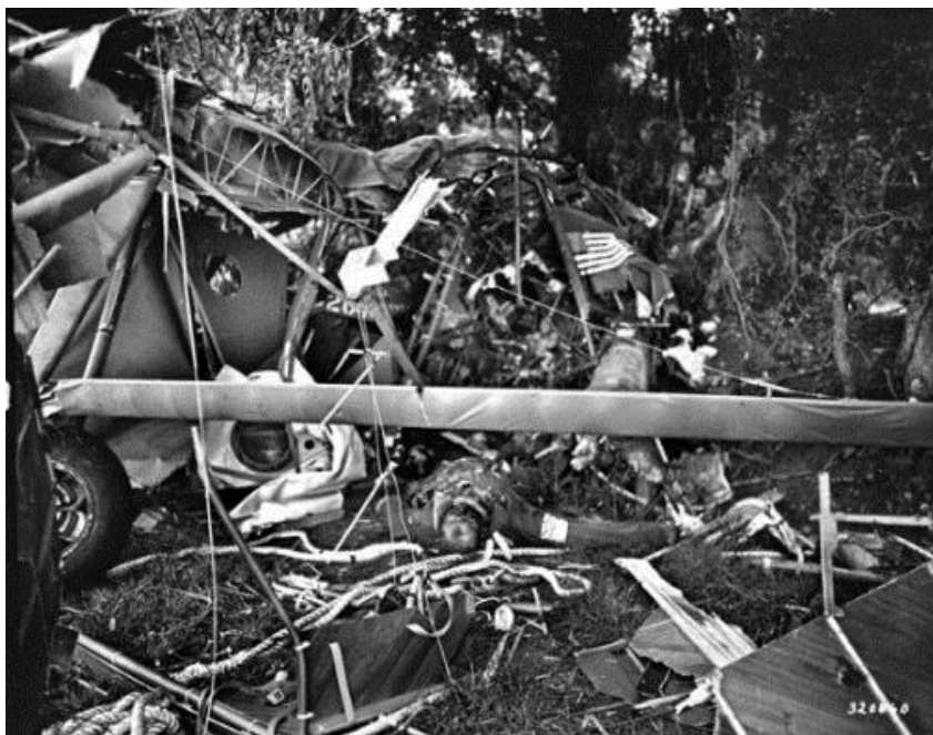
Мертвый американский десантник среди обломков разбившегося при посадке планера близ Карантана. 7 июня 1944 года