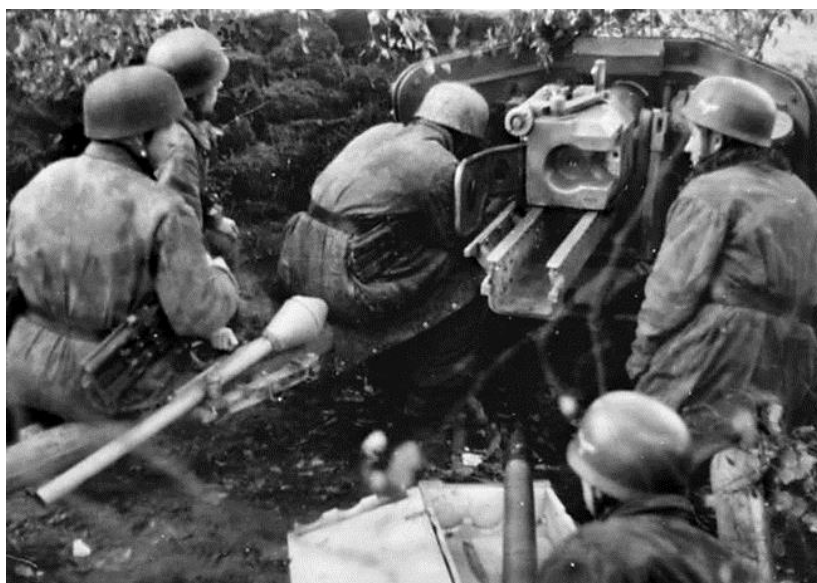
6-й Полк потерял большую часть своего тяжелого вооружения в первые дни вторжения союзников в Нормандию. Эта 75-мм противотанковая пушка Panzerabwehrkanone 40 стала одной из последних, которыми располагали парашютисты...