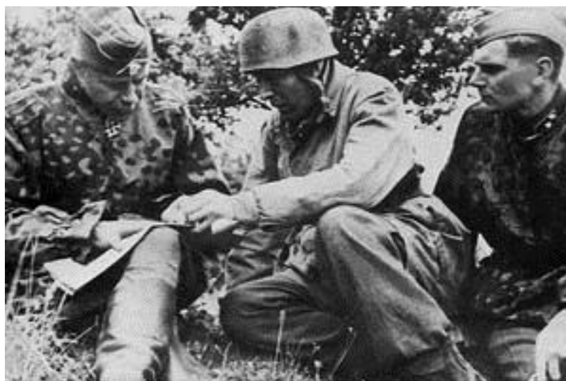
Фон дер Хайдте (в центре) рассказывает бригадефюреру Остендорфу о положении в Карантане

Однако город был оставлен: 11 июня танкисты SS так и не пришли на помощь парашютистам, правда, они поделились с ними боеприпасами и провизией.