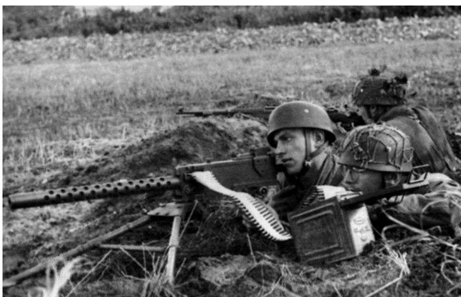
Немецкие парашютисты в Нормандии нередко использовали трофейное оружие. На снимке двое из них за американским пулеметом Браунинг/Browning калибра .30

Некоторые из парашютистов не могли скрыть своего злорадства (schadenfreude) по поводу провала атаки эсэсовцев, известных своим чванством. Пospешив на место со своим полковым боевым взводом, фон дер Хайдте приказал своим офицерам собирать отступавших в беспорядке панцер-гренадеров и брать их под свое начало: иногда это приходилось делать, угрожая оружием. Таким образом, сильно потрепанные части парашютистов получили подкрепления. Кроме того, небольшие подкрепления были предоставлены наземными частями Люфтваффе.