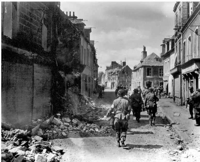
Американский санитар (возможно, из 362-й Воздушно-десантной Санитарной Роты) и другие солдаты из 101-й Дивизии патрулируют улицы Карантана. 12 июня 1944 года