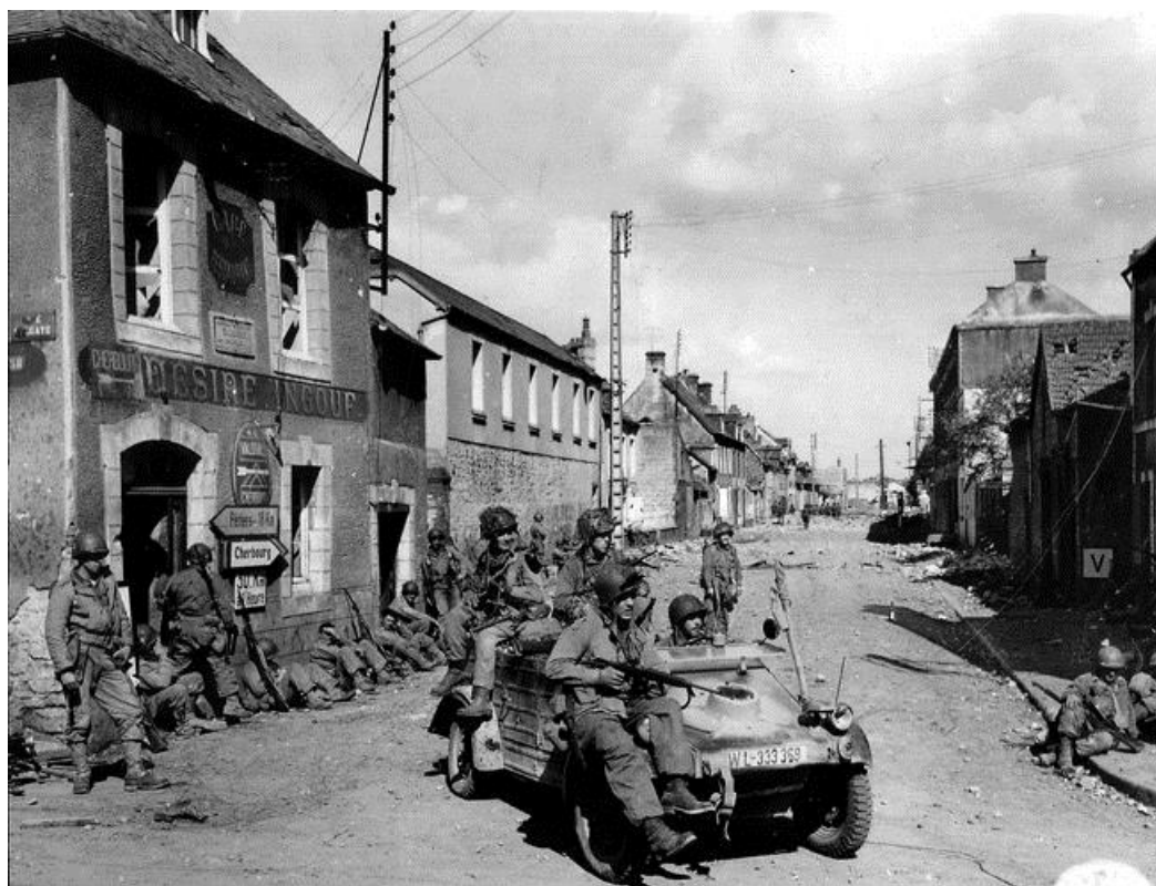
Американские десантники на трофейном Кубельвагене/Kubelwagen в Карантане. 12 июня 1944 года

Хотя вражеская артиллерия и штурмовая авиация по-прежнему оставались серьезной угрозой для парашютистов, немцы продержатся здесь, между Карантаном и Перьером, 24 дня, отбивая атаки американцев.