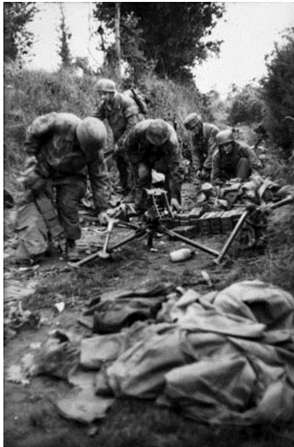
Парашютисты собирают оружие и боеприпасы для предстоящего боя

Вспоминает Ойген Гриссер: «Вечером 6 июня у меня оставалось совсем немного боеприпасов для моего автомата: пара полных магазинов в подсумке на поясе и магазин в самом автомате, при этом нам едва ли вообще подбрасывали какие-то боеприпасы. Кроме этого у меня оставались пистолет, штык, лопата и несколько гранат. С этим жалким арсеналом войну выиграть было невозможно, а у некоторых из моих товарищей положение было еще печальнее.»