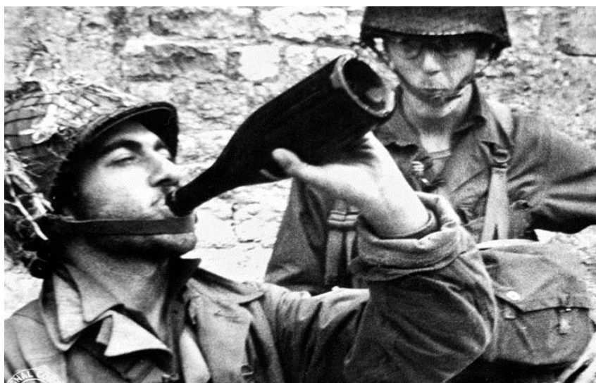
Американцы отмечают взятие Карантана...

Взятие Карантана стало важным событием в разворачивающемся сражении за Нормандию. Плацдарм на севере Франции теперь был полностью консолидирован. 15 июня 101-Дивизия была переведена в оперативное подчинение 8-му Корпусу и оставалась на оборонительных позициях в окрестностях Карантана до 27 июня, после чего ее сменила 83-я Пехотная Дивизия.