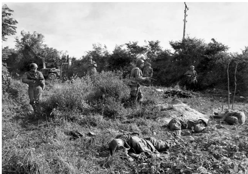
Американские парашютисты ищут снайпера, который убил двоих их товарищей. На заднем плане – живая изгородь

В это же время резервная часть 101-й Дивизии, 501-й Полк, переправился через Дув, обошел восточную окраину Карантана и занял Высоту 30 – ключевой пункт к югу от города. Вечером 11-го корабельная и полевая артиллерия, минометы и истребители танков превратили большую часть города в руины. Одновременно с этим 506-й Полк переправился через тот же мост, что ранее использовали люди Коула. Этот полк совершило начавшийся в 02.00 12 июня ночной марш на юго-запад в обход города, вышел к Высоте 30 и к рассвету занял рубеж для атаки. В составе 2-го Батальона 506-го Полка находилась и знаменитая Рота E (Easy Company).