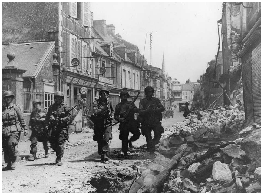
Американцы входят в Карантан

Позднее он вспоминал: «Это был один из редких случаев в ходе войны, когда я полностью поверил сообщению из Ultra и отреагировал на него в тактическом ключе.»