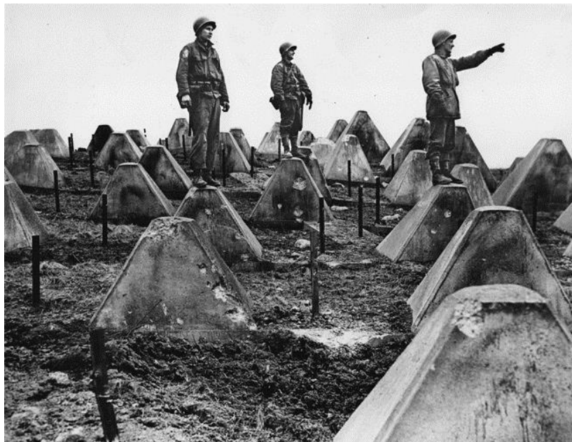
Американцы из инженерной части позируют на бетонных противотанковых надолбах - Зубьях Дракона во время Саарского наступления

Западного Вала , вдоль выступа располагались противотанковые рвы и бетонные надолбы, известные как Зубы Дракона (англ. - Dragon's Teeth , нем. – Drachenzähne ). За рвами и надолбами находились различные фортификационные сооружения, варьирующие от небольших ДОТов до многоуровневых бункеров. Элтос развернул свои силы вдоль шестимильного сектора фронта. На его левом фланге находилась Тактическая Боевая Группа (Task Force) подполковника Стэндфиша (Miles Standish), на правом – такая же группа подполковника Чемберлена (Chamberlain).