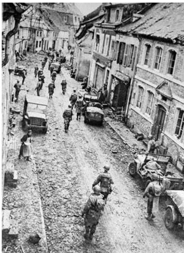
Американцы проходят через город Путланж/Puttelage-aux-Lacs. Конец ноября 1944 года