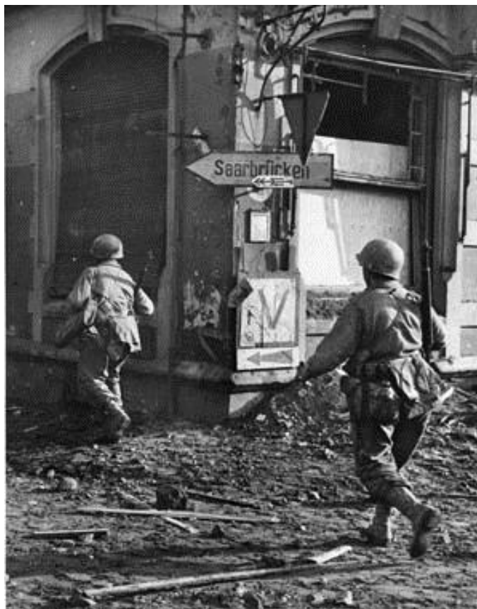
Американцы из 12-го Корпуса продвигаются через развалины горда Сент-Авольд – важнейшего центра управления войсками немецкой 19-й Армии. Части 3-й Армии Паттона заняли город 27 ноября 1944 года