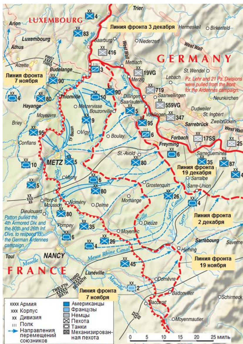
Перемещение линии фронта в Лотарингии 7 ноября – 19 декабря 1944 года

Возведенные в 1936-1940 годах долговременные укрепления Западного Вала (также Линии Зигфрида/Siegfriedstellung), достигавшего по протяженности 390 миль и получившей у союзников название, в конце 1944 года оказались на пути 3-й Армии генерала Паттона, нацеливавшегося на прорыв в Саарский индустриальный район Рейха. К этому времени немецкие инженеры модернизировали оборонительные сооружения, в результате чего в этом секторе перед американцами оказалась наиболее хорошо укрепленная часть линии, защищавшей Германию от вторжения на ее территорию.