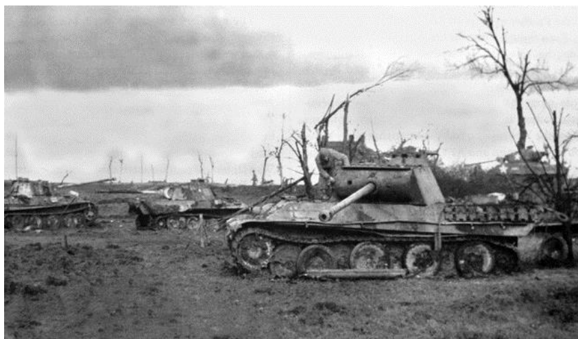
Американский солдат из 4-й Танковой Дивизии осматривает один из трех немецких танков 11-й Танковой Дивизии, подбитых в ходе боев под Гёбленом/Guëbling примерно в 30 милях от Меца. 14 ноября 1944 года