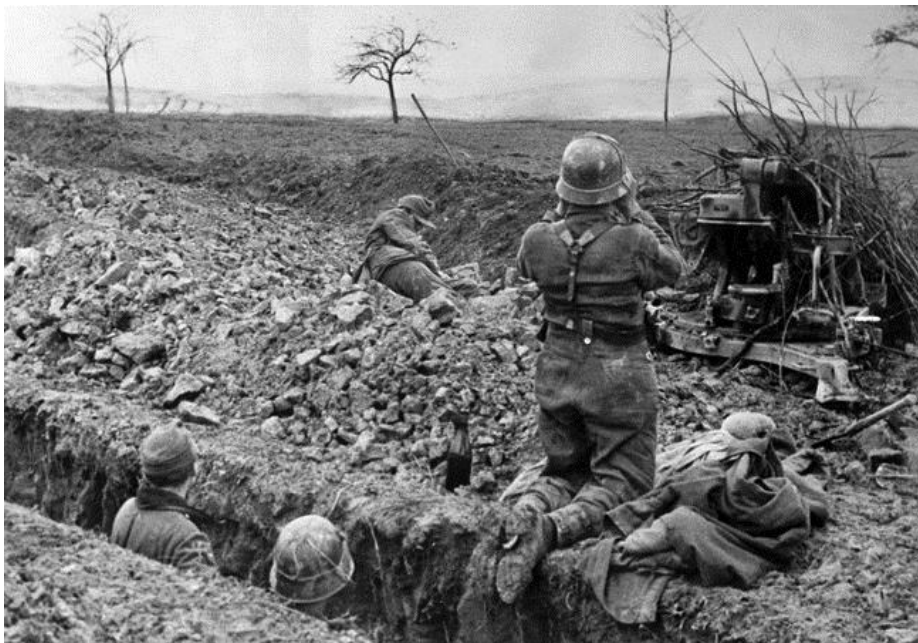
Саар, декабрь 1944-го. Немцы на оборонительной позиции в ожидании атаки американцев

флангу 3-й Армии и попали под удар утром 16-го декабря в рамках общего наступления немцев в Арденнах. Начиналось Сражение за Выступ . Три недели раньше Паттон высказал беспокойство по поводу того, что статичные позиции, занимаемые 8-м Корпусом генерал-майора Миддлтона (Трой Миддлтон), «приглашают» немцев к атаке. «1-я Армия допускает страшную ошибку, оставляя 8-й Корпус в статичном положении, так как весьма вероятно, что немцы концентрируют силы к востоку от него,» - записал Паттон в своем дневнике 25 ноября.