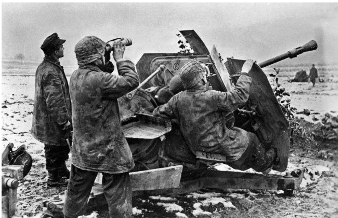
Немцы у 37-мм зенитной пушки Flak 36/37. Саар, декабрь 1944 года