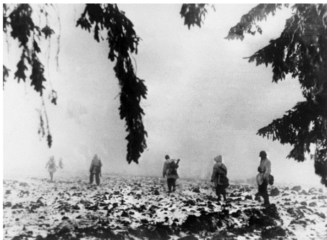
Немецкие пехотинцы выходят на рубеж для атаки. Январь 1945 года

тонн продовольствия и военных материалов и который Гитлер стремился выбить из рук союзников. Через Антверпен также проходила линия раздела главных союзных армий: 21-й Армейской Группы фельдмаршала Монтгомери и 12-й Армейской Группы генерала Омара Брэдли. Гитлер надеялся, что, если ему удастся рассеять силы союзников, нанести им большие потери и захватить основной порт снабжения, общественное мнение в США и Великобритании призовет своих лидеров к переговорам и достижению мирного соглашения с Германией. Гористые и залесенные Арденны он рассматривал как идеальное место для контрнаступления: там ему сопутствовал колоссальный успех весной 1940 года... Однако его генералы были в ужасе. Шансов на успех для такого контрнаступления не было, и они запротестовали, утверждая, что такая операция приведет к катастрофе. Гитлер отверг возражения своих генералов и приказал им найти способ добиться успеха.