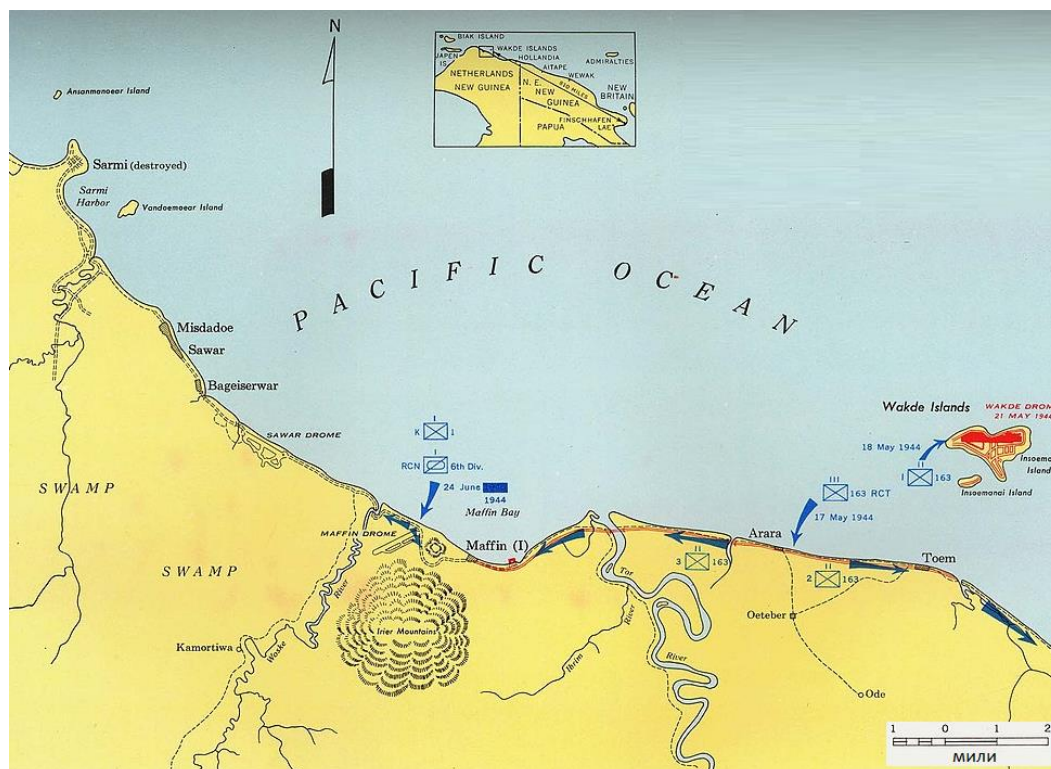
План операции по занятию острова Вагде