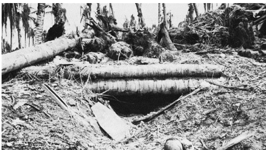
Японский блиндаж на Вакде