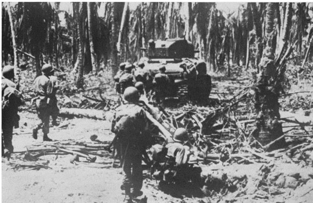
Американцы в атаке...

Тем временем Рота В, наступающая на восток вдоль южного края ВПП, также натолкнулась на большое количество японских огневых точек, что сильно замедлило темп атаки. Рота F, оставшаяся в резерве на ранней стадии утренней атаки, была брошена в бой на правом фланге Роты В около 11.30, а два танка с передовой Роты С были переданы Роте В. Последняя, при том, что ее сектор атаки сузился наполовину, сумела сконцентрировать свои усилия. Каждому танку был придан стрелковый взвод, еще один взвод оказывал им общую поддержку. Некоторое число японцев было обнаружено среди обломков разбитых самолетов, другие вели огонь из стрелковых ячеек, укрытых в густом кустарнике. Танки пробивали путь вперед, но атака развивалась медленно, так как приходилось зачищать каждый квадратный фут. В 14.00 Рота В вышла к юго-восточному углу ВПП.