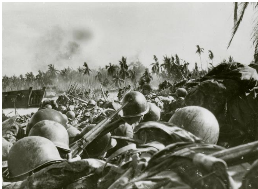
Первые минут высадки на Вагде. Американцы прижаты к земле огнем противника...

Первая волна катеров LCVP с Ротой B на борту попала под винтовочный огонь японцев, находясь примерно в 300 ярдах от берега, но вышла на берег в нескольких ярдах левее причала в 09.10. Остальные три стрелковые роты с двумя танками вышли на берег на том же участке в 09.25. У третьего танка произошло замыкание в системе электрооборудования во время погрузки на десантный корабль, а четвертый ушел под воду на глубине около 7 футов, съезжая с рампы LCM . Все четыре роты оказались под постепенно усиливающимся ружейно-пулеметным огнем японцев с хорошо замаскированных позиций на флангах небольшого плацдарма. По счастью, японцы не подключили к этому свои тяжелые пулеметы калибра .50 и 20-мм пушки. Под огнем американцы потеряли троих командиров рот: одного убитым и двоих ранеными.