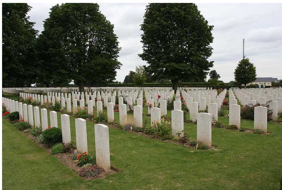
Британское военное кладбище. Нормандия ( https://en.wikipedia.org/wiki/Bayeux_Commonwealth_War_Graves_Commission_Cemetery#/media/File:Bayeuxcemetery11.jpg )