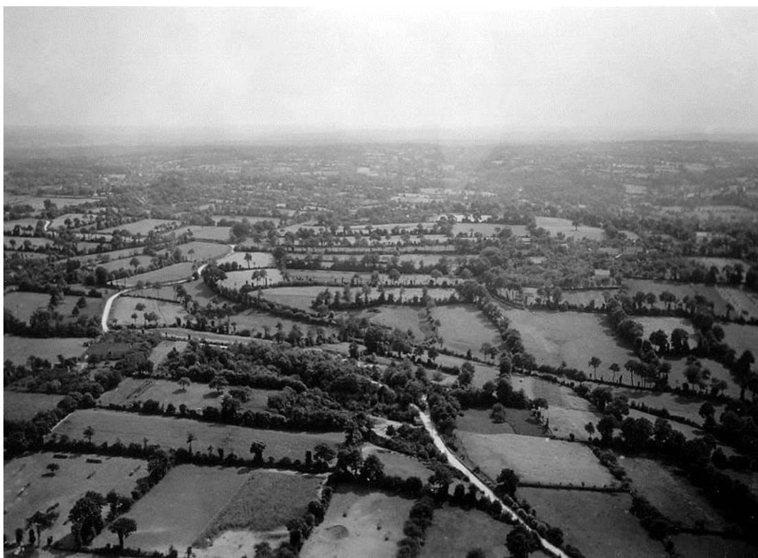
Bocage (бокаж). Полуостров Contentin, Нормандия ( https://en.wikipedia.org/wiki/Bocage )

весьма эффективными в ведении оборонительных боев в местности, известной как bocage (территория, характеризующаяся наличием густых растительных оград, разделяющих расчищенные сельскохозяйственные угодья – ВК). Они наносили значительные потери британцам и американцам, используя маскировку, мины и коварные приемы ведения боя.