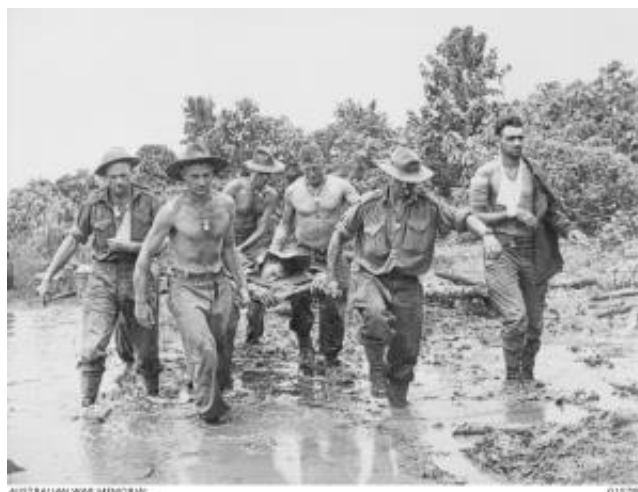
Район Лае. Австралийцы из Батальона 2/33 несут раненого товарища на перевязочный пункт

Проблемы возникли на фоне трений между армейским и военно-морским командованием и привели к разногласиям из-за непонимания того, какими возможностями располагает флот и какие риски возникают из-за его использования непосредственно у побережья. Эти факторы затормозили наступление 9-й Дивизии, и в результате 7-я Дивизия победила в гонке к Лае. Ее 25-я Бригада, разбив противника в ожесточенных боях за плантации Jensen и Heath , вошла в Лае утром 16 сентября, ненамного опередив 24-ю Бригаду, которая заняла аэродром Malahang днем ранее.