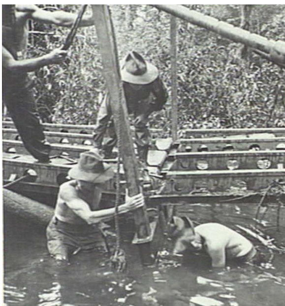
Плацдарм Лае. Инженеры собирают мост через один из водотоков для последующей переправы через него артиллерии ( https://www.awm.gov.au/collection/C61746?image=1 )

Погода продолжала препятствовать продвижению частей 9-й Дивизии. Наступавшая севернее 26-я Бригада застряла на восточном берегу Бусу. 10 сентября командос из Отдельной Роты 2/4, прикрывавшие фланг наступавших, сумели переправиться через реку Санквеп/Sankwer в районе ее слияния с Бусу. Через Бусу они перебрались по мосту кунда/kunda (примитивный мост, собранный/сплетенный из стволов деревьев, ветвей и лиан). Сразу после этого они вступили в бой с небольшим отрядом японцев, попытавшимся атаковать их, в результате чего несколько солдат противника были убиты... Чтобы ускорить продвижение 26-й Бригады, командование призвало на помощь инженеров.