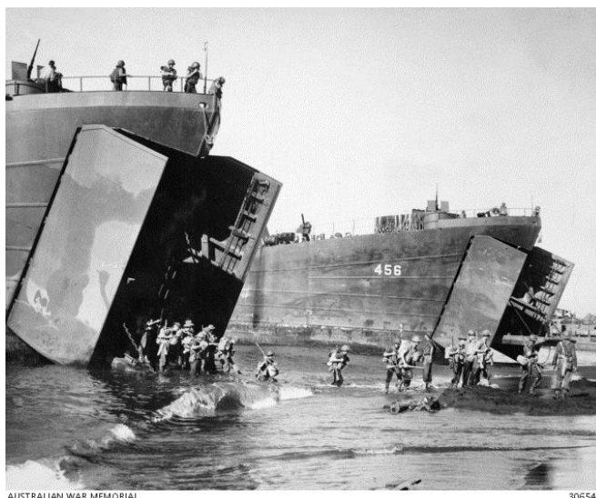
Австралийцы высаживаются к востоку от Лае

Несмотря на атаки с воздуха десантирование продолжалось в течение четырех часов с момента спуска на воду первого десантного катера. Около 8 000 человек сошли на берег за это время. На начальной стадии высадки Пехотный Батальон 2/13 высадился на Желтый Пляж и занял плацдарм, после чего на запад были отправлены разведочные патрули, которые должны были выйти к позициям Пехотного Батальона 2/15, высадившегося на Красный Пляж . Далее патрули должны двинуться на восток, к миссии Норой , чтобы обезопасить правый фланг плацдарма.