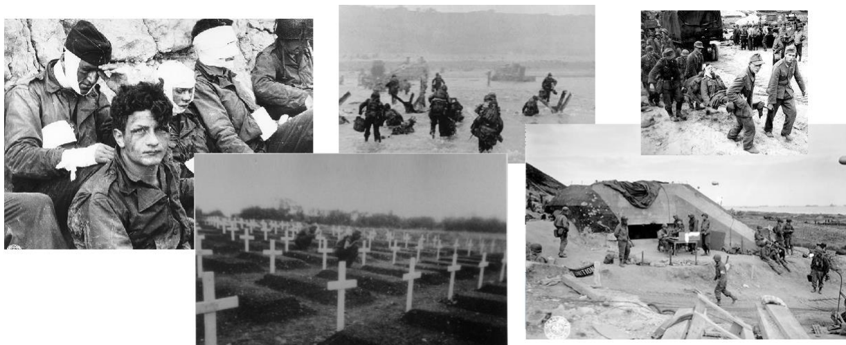
Отаха Веач – слева направо: верхний ряд - раненые американцы, высадка, пленные немцы, нижний ряд - военное кладбище рядом с местом высадки, захваченный дот