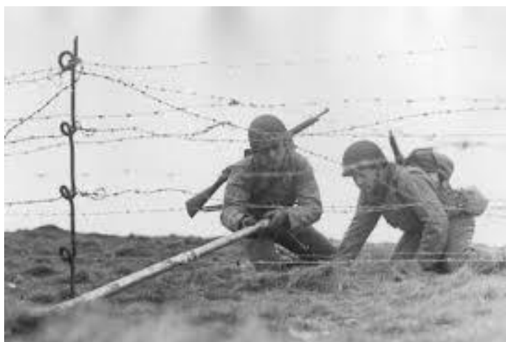
Американские солдаты готовят bangalore torpedoes к подрыву

После Сицилии, зимой 1943-го, когда у нас уже был опыт, мы были обстреляны в боях и приобрели хорошую репутацию, нас вернули в Англию. Наша база находилась в приморском городе Weymouth, где мы начали готовиться к высадке в Нормандии. Нам сказали, что мы будем брать доты, и разделили не на взводы, а на отделения. В каждом отделении были стрелки, пара ребят обучались применению так называемых bangalore torpedoes , многие обучались использованию толовых шашек. Bangalore torpedoes – это длинные трубы с динамитом внутри. Просовываешь одну секцию под колючую проволоку, толкаешь ее вперед. Затем прикручиваешь к первой вторую и толкаешь еще дальше, затем третью и так далее. В последнюю вставляешь взрыватель, нажимаешь на курок, и в проволоке появляется проход для парней с огнеметами и толовыми шашками.