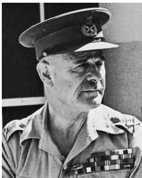
Арчибальд Уэйвелл (1883-1950). Об этом человеке с большим уважением отзывался Роммель, который всю войну возил с собой книгу Уэйвелла Generals and Generalship , изданную в 1941 году

Третий промах был допущен Уэйвеллом, когда он выбрал на смену Уилсону, срочно отбывшему в Грецию, генерал-лейтенанта Филипа Нима (Philip Neame). Он не знал Нима достаточно хорошо, но считал репутацию этого человека соответствующей обстоятельствам. Вот что он вспоминал: «Я не знал его близко, когда-то он командовал 4-й Индийской Дивизией... Он был сапером, в прошлом служил инструктором в Штабном Колледже, был автором книги по стратегии, так что я воспринимал его как умелого и образованного солдата, его Крест Виктории [получен Нимом за героизм во время ПМВ] был гарантией