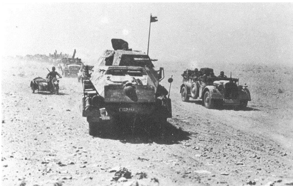
Апрель 1941 г. Немецкая колонна на марше... https://secondbysecondworldwar.com/?p=3900

За взятием Эль Агейлы последовала атака немцев на позиции 2-й Танковой Дивизии британцев в районе Мерса Бреги силами 5-й Легкой Дивизии 31 марта. 8-мильный просвет между побережьем и солончаками удерживала Группа Поддержки/Support Group 2-й Танковой Дивизии – батальон пехоты, полк полевой артиллерии, оснащенный 25-фунтовыми пушками, и полк противотанковой артиллерии. В 5 милях дальше на восток стояли устаревшие танки 3-й Танковой Бригады, которая должна была контратаковать в случае прорыва немцев через позиции Группы Поддержки . Бой в этом просвете продолжался целый день, и ближе к вечеру Роммель был остановлен на линии обороны Группы Поддержки . Силы обороняющихся были на исходе, и они вызвали танкистов 3-й Бригады для нанесения контрудара по наступающим немцам. Однако командир 2-й Дивизии генерал-майор Гамбьер-Пэрри (Michael Gambier-Parry) решил, что световой день истекает и для атаки осталось слишком мало времени. Тем временем после интенсивных атак с воздуха пикирующих бомбардировщиков немцы снова пошли в атаку и, наконец, сбили Группу Поддержки с ее позиций, прорвавшись в открытую пустынную местность за ними.