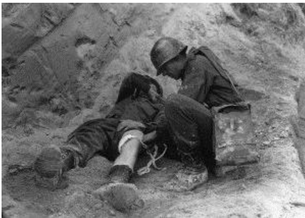
Раненый солдат 85-й Дивизии получает медицинскую помощь от санитара

По счастью, я разглядел два силуэта, две каски на фоне ночного неба, и закричал. Это были те парни из соседней части, которые пытались добраться до этого места еще до нас. Они-то и оттащили меня к командному пункту. С нами был санитар, который перевязал мою рану. Моя нога была напичкана осколками, из икры был вырван целый кусок плоти. С командного поста связались с батальоном, с батальонного перевязочного пункта, расположенного в миле или двух от нас пришли санитары с носилками, подобрали меня и оттащили в тыл.