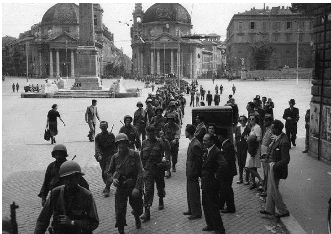
Солдаты 85-й Дивизии маршируют через площадь Piazza Del Popolo в освобожденном Риме

Мы вошли в Рим колоннами по одному, продвигавшимися по обе стороны дороги. Через пару дней начались торжества. Генералу Марку Кларку (командующий 5-й Армией) нравились развевающиеся флаги и толпы фотографов. Однако, наши солдаты его не очень уважали. Когда он прибыл в Рим, напротив дворца короля Виктора Эммануила состоялась большая церемония. Министр Обороны (Secretary of War) Стимсон (Henry Stimson) председательствовал. Рим стал первой занятой союзными войсками столицей государства из числа стран Оси.