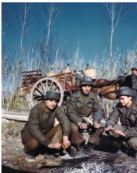
Солдаты 85-й Дивизии греются у костра, за ними наблюдает местный житель...

Иногда мы набредали на фермы. В них всегда можно было найти бочку вина, то есть, у нас появлялась выпивка. Случалось, на фермах был кто-то из местных. Полагаю, эти люди решались на то, чтобы остаться у себя в доме, рассчитывая, что война обойдет их стороной. Обычно они были настроены дружелюбно, да и мы ничего не заставляли их делать насильно. Но, если на ферме были цыплята, кто-нибудь обязательно крал их. Иногда мы меняли мясо из наших рационов «К» на яйца. Это был единовременный бартер, и больше яиц те же люди нам не давали, поскольку местным наши рационы «К» не очень нравились... Добыть еду было задачей не из легких, но еще труднее было держать себя в чистоте, не мокнуть и не мерзнуть. Когда мы снимались с передовой, нам иногда устанавливали душевые вдоль какой-нибудь речки – это случалось раз в три-четыре недели. Здесь мы могли заменить свою одежду на другую, ранее взятую у других, выстиранную и прокипяченную. Эти [банно-прачечные] подразделения работали эффективно, они забирали у нас все, что было на нас и выдавали все чистое. Эти вещи не всегда подходили по размеру, но было приятно, потому что они были чистыми.