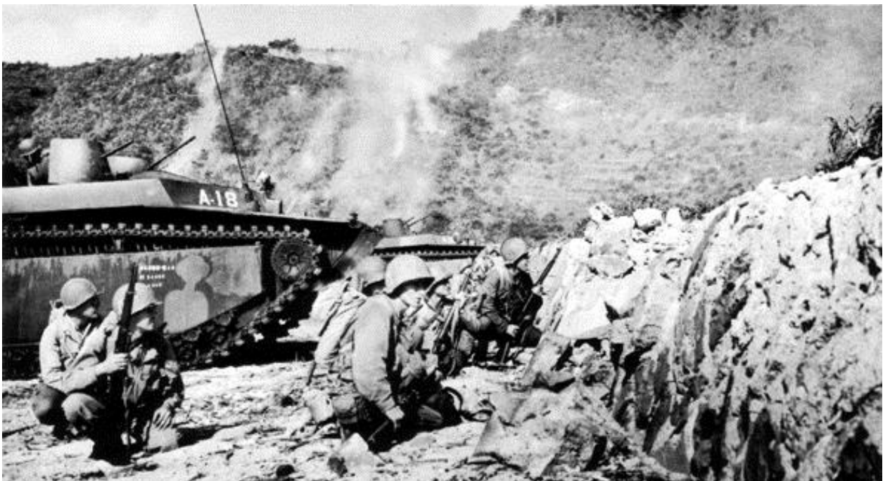
Первые минуты после высадки на остров Дзамами. Танки не в состоянии преодолеть волноприбойный уступ...