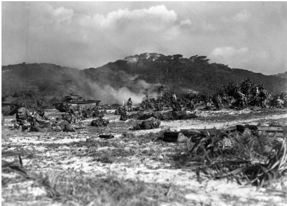
Солдаты 306-й Полковой Группы высаживаются на остров Герума в ходе операции Айсберг. 26 марта 1944 года.