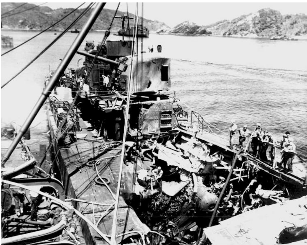
Эсминец Ньюком после ударов камикадзе у берегов архипелага Керама

Эсминец Newsom так и не был полностью возвращен в строй и был выведен из состава ВМФ в марте 1946 года.