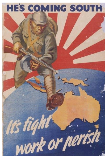
Австралийский пропагандистский плакат времен ВМВ. Надпись: «Он идет на юг, сражайся, работай или погибай.»