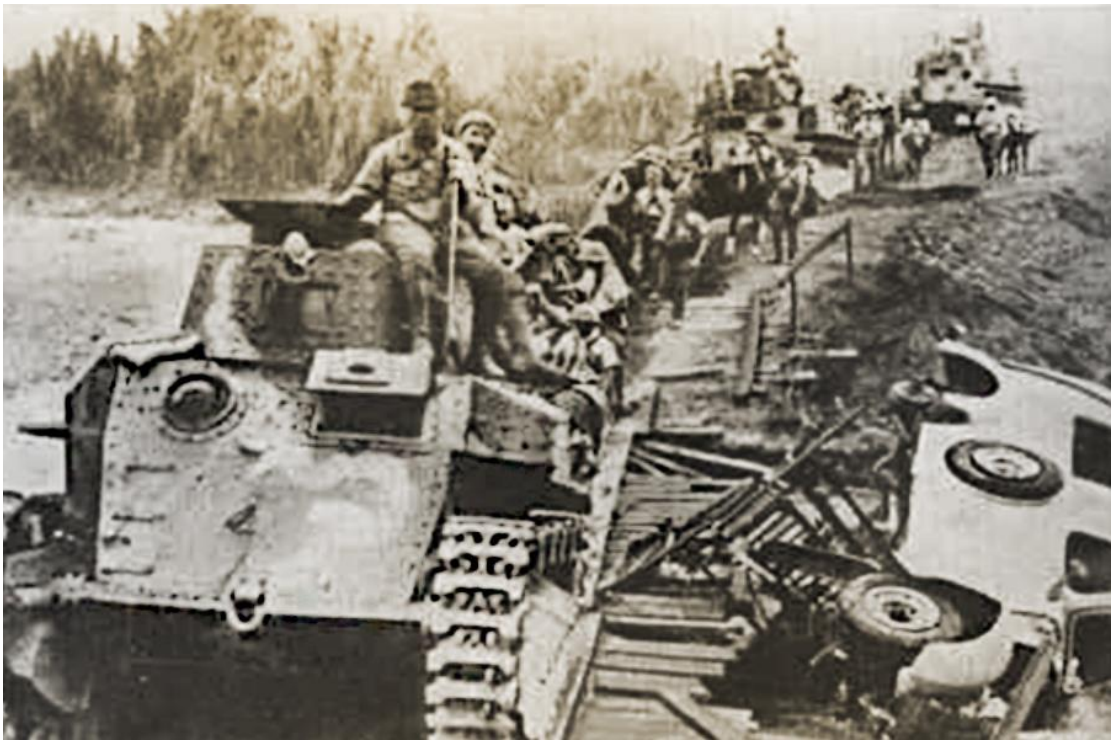
Японская бронетехника форсирует водную преграду по временному мосту на ранней стадии вторжения Императорской Армии в Бирму.