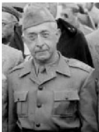
Командующий FEB Жуан Батиста Маскареньяш ди Мораиш (1883-1968)

Первый 5000-ный контингент ( First Expeditionary Infantry Division – Primeira Divisão de Infantaria Expedicionária - 1st DIE ) отбыл из Рио-де-Жанейро 2 июля 1944 г. По его прибытии в Неаполь американцы инкорпорировали дивизию в IV-й Корпус, находившийся под командованием генерала Уиллиса Криттенбергера (Willis Crittenger) и входивший в 5-ю Армию, которой командовал генерал Марк Кларк (Mark Clark). К многонациональной антинацистской группировке, воюющей в Италии, прибавился еще один заокеанский компонент.