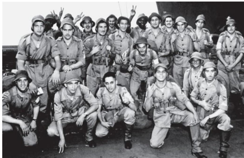
Фебианос перед отправкой за океан

американских союзников, которым в разгар войны, казалось, не помешали бы подкрепления: присутствие на театре военных действий не слишком боеспособного контингента, который будет необходимо одевать, кормить, обучать и вооружать, могло стать лишней головной болью, и союзники активно пытались отговорить президента Варгаса от этого шага. Однако бразильцы настояли на своем. Бразильский экспедиционный корпус, созданный для отправки в Европу, получил название Força Expedicionária Brasileira – FEB , а за военнослужащими корпуса закрепилось прозвище febianos/фебианос .