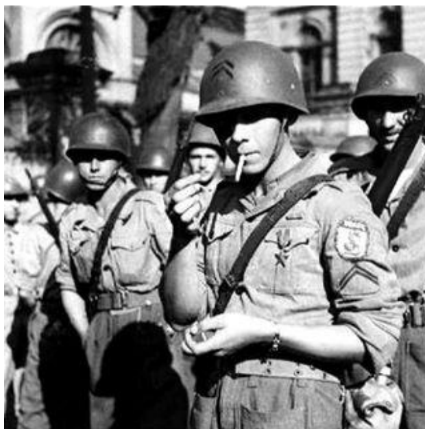
Фебианос. На левом рукаве эмблема FEB – курящая змея

http://www.imgur.net/user/youneedtolearnhistory/1514714736/1062399077100685303_1514714736