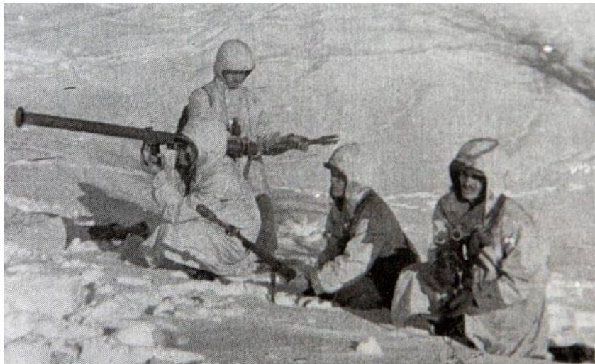
Бразильский боевой патруль. Зима 1944/45