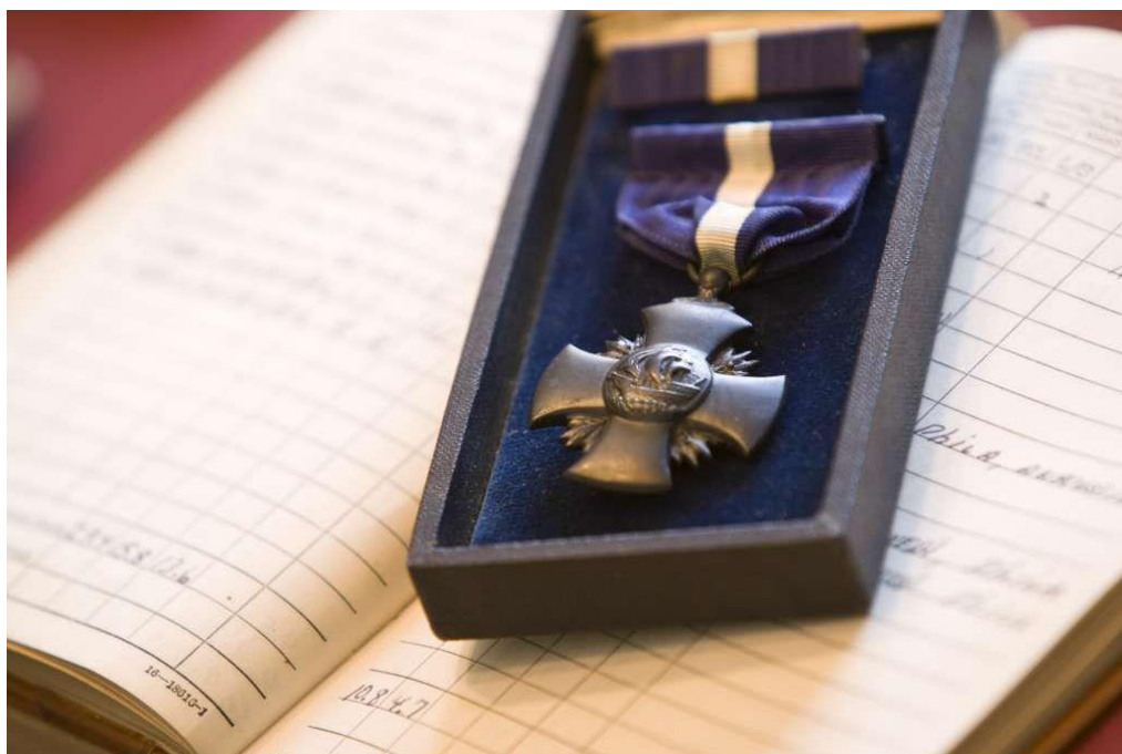
Военно-Морской Крест (Navy Cross) Нормана Клисса ( http://www.expressnews.com/news/local/article/Kleiss-was-dive-bomber-at-Midway-7385936.php#photo-9925189 )