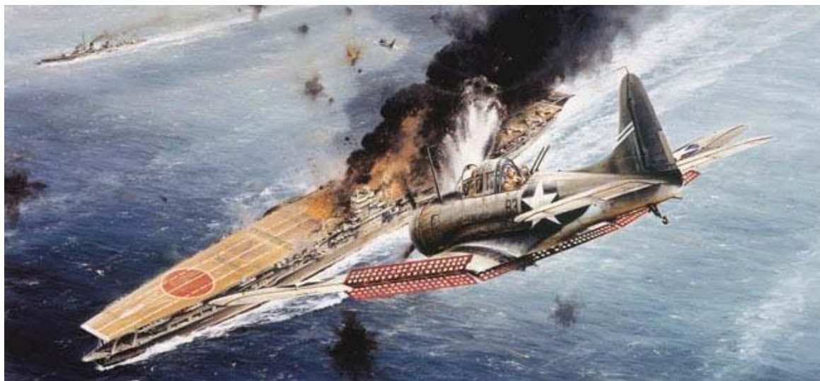
Американский пикирующий бомбардировщик в атаке на японский авианосец (картина) ( http://warfarehistorynetwork.com/daily/wwii/the-battle-of-midway-turning-the-tide-of-pacific-war/ )

корабля. Мои бомбы попали точно в красный круг, расположенный впереди капитанского мостика. Через несколько секунд огонь уже поднялся на 100 футов вверх. Уолтер Лорд (Walter Lord) позднее узнал от японцев, что моя бомба разорвала автоцистерну с горючим, и огонь от нее захлестнул командирский мостик Kaga .