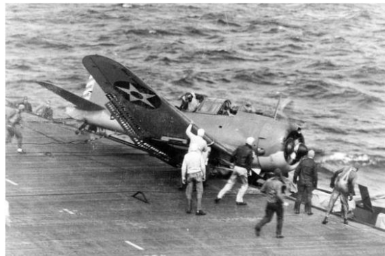
Слева Донтлесс после удачной посадки, справа – после неудачной