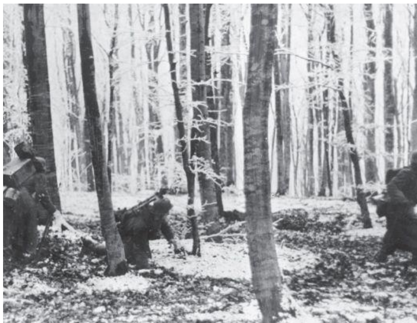
Солдаты одной из народно-гренадерских дивизий в первый день наступления в Арденнах...

Артиллерия американцев сумела помешать наведению мостов через Зауэр инженерами 212-й НГД. Уже через короткое время американцы сумели контратаковать силами 70-го Танкового Батальона, насчитывавшего 40 Шерманов/Sherman и 17 Стюартов/Stuart , которые пробились ко всем окруженным ротам, кроме одной, оставшейся в Эхтернахе. Этот контрудар бронетехники американцев положил конец продвижению 212-й НГД. Более того, их подкрепления были уже в пути. Уже на следующий день командующий 3-й Армией генерал Паттон отдал приказ Боевой Группе А 10-й Танковой Дивизии и резерву командования продвигаться на север, чтобы заблокировать наступление 80-го Корпуса немцев.