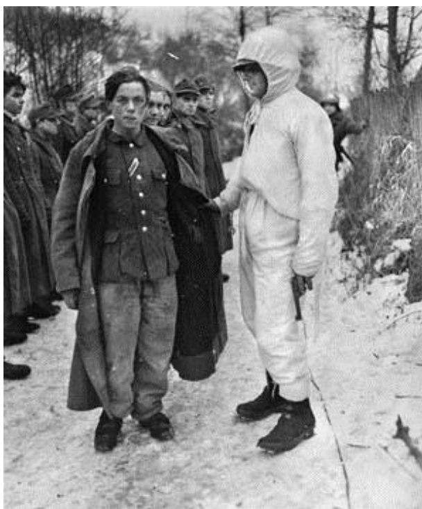
Солдат 8-го Полка 4-й Пехотной Дивизии рядом с немецким военнопленным-подростком, уже имеющим нашивку за ранение. Сектор реки Зауэр

Не было такого, чтобы я испытывал от этого [моральные] страдания. Кто-то из тех, кто только что потерял близкого друга или просто получал удовольствие от убийства, делал шаг вперед, чтобы сделать это. Если взглянуть в прошлое, кто-то, включая меня, должен был бы возразить против этого, но в боях все различия между добром и злом становятся жертвами войны.