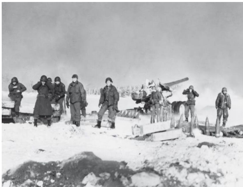
155-мм гаубица 514-го Дивизиона Полевой Артиллерии 90-й Пехотной Дивизии американцев обстреливает немецкие позиции. Люксембург, январь 1945 года