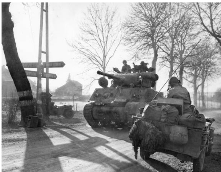
Танк Шерман продвигается к передовой. 27 декабря 1944 года

22 декабря Паттон направил свои силы на разные участки боев для перехода в контратаку. 10-я Танковая Дивизия разместилась на левом фланге боевой группы, наступающей на севере в направлении Эхтернаха, тогда как 10-й Полк обстрелянной 5-й Пехотной Дивизии генерала Ирвина расположился на ее правом фланге. 4-я Дивизия генерала Бартона, которая умело вела оборонительные бои, остановившие наступление немцев южнее Эхтернаха, находилась в центре. Немцы больше не имели возможности наступать на юг, но умело применяли свою артиллерию и небельверферы , чтобы сбить американцев с позиций каждый раз, когда последним удавалось продвинуться вперед. Боевые действия к югу от Эхтернаха приобретали характер позиционных.