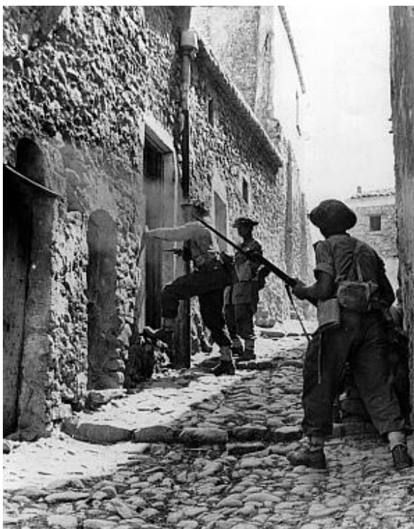
Британцы зачищают один из сицилийских городков

Попытка Монти наступать на северо-запад и обойти противника с фланга прямо напротив американцев не привела ни к чему. К тому времени, когда британцы, не располагавшие достаточной мобильностью, вышли к Шоссе 124 и на участок южнее Виццини, немцы перебросили сюда бронетехнику и сумели закрепиться на оборонительных позициях. Лиз, командующий 30-м Корпусом британцев, позднее говорил, что он считал решение о смещении границы [между британским и американским секторами] и отвод 45-й Дивизии ошибкой. «Теперь я часто думаю, что решение не передавать отрезок дороги Кальтаджироне/Caltagirone - Энна американцам было неудачным... Они продвигались куда быстрее нас, в значительной степени, как я полагаю, благодаря тому, что все их машины обладали повышенной проходимостью... Мы тогда все еще были склонны помнить о медленном продвижении американцев на ранней стадии операций в Тунисе, и я, именно я, определенно не представлял себе всю ту грандиозную степень прогресса в опыте и технической оснащенности, которого они достигли... У меня такое чувство, что, если бы им ... [разрешили наступать] прямо по этой дороге [ Шоссе 124 ], у нас был бы шанс завершить эту вызвавшую разочарование кампанию быстрее.»