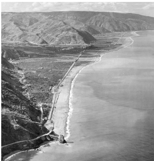
Пляж Броло после окончания военных действий на Сицилии. Январь 1944 года