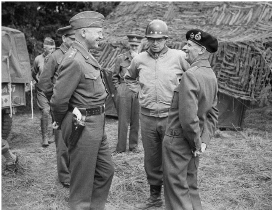
Паттон и Монти – союзники и соперники. Посередине – генерал Брэдли

Бернард Монтгомери, окончивший Королевский Военный Колледж в Сандхёрсте, был дважды ранен на фронтах ПМВ, где стал свидетелем массовой гибели пехоты во фронтальных атаках, в связи с чем болезненно относился к большим потерям. За ним шла слава победителя Оси в сражении под Эль-Аламейном в 1942 году. Известно, что Монти (кличка) отличался хвастливостью и любил критиковать других генералов. Будучи популярным среди своих солдат и офицеров, он также был известен частым отсутствием такта и умения вести себя.