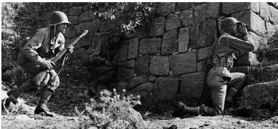
Американцы продвигаются вперед. Сицилия, 1943

В тот же вечер Паттон записал в своем дневнике: «Я чувствовал, тут что-то не так, но пока не смог понять, что именно. После того, как все было утрясено, появился Алекс [Александр]. Он выглядел слегка взбешенным и, по его стандартам, был довольно резок. Он сказал Монти , чтобы тот разъяснил свой план. Монти сказал, что он и я уже решили, что нужно делать, так что Алекс разозлился еще больше и сказал Монти показать ему план [действий]. Он это сделал, и тогда Алекс попросил меня показать ему мой. Затем совещание прервалось. Никому из нас не предложили ланч, и я подумал, что Монти повел себя невежливо по отношению к Александру и ко мне. Монти подарил мне 5-центовую зажигалку. Должно быть, кто послал ему целый ящик с ними...» Сам Монти описал свой план в своем дневнике: «... 7-я Американская Армия должна наступать по двум направлениям: (а) двумя дивизиями по Шоссе 120 и (б) двумя дивизиями по Шоссе 113 в направлении Мессины. Все это было согласовано.»