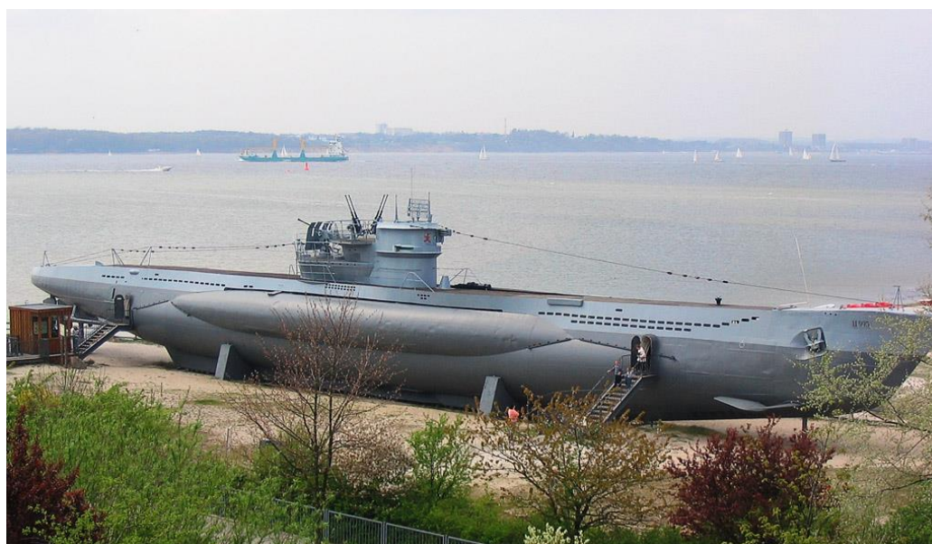
Лодка U-995, однотипная с U-1271, Военно-Морской Мемориал Лабё/Laboe, Германия