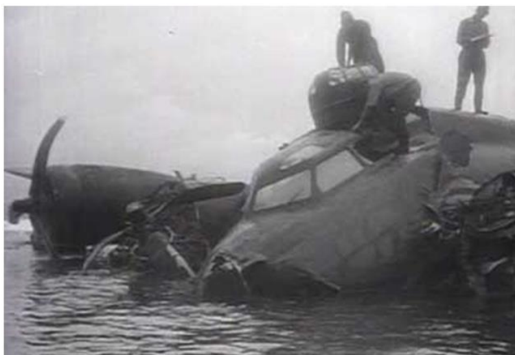
Японцы осматривают B-17, сбитый близ плантации Комалу