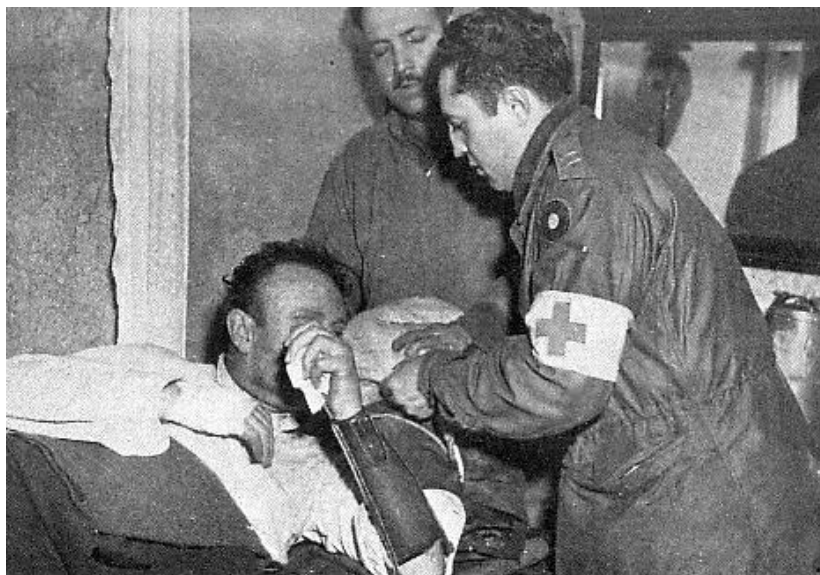
Американские санитары оказывают помощь пленному фон Хайдте ( http://histomil.com/viewtopic.php?f=337&t=13840&start=200 )