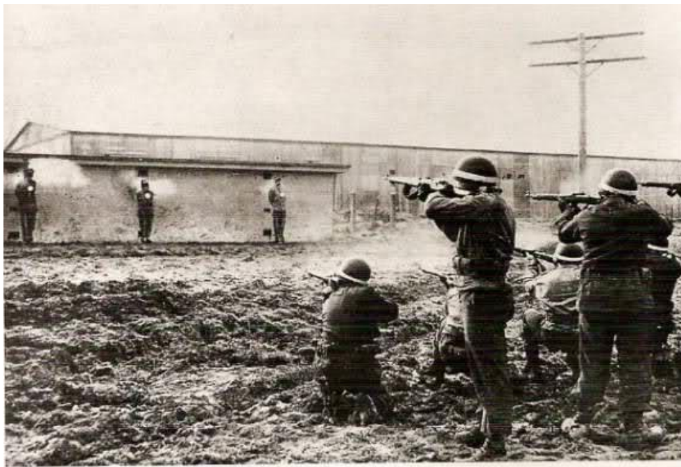
Сцена расстрела диверсантов