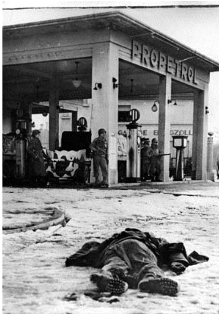
Труп немецкого солдата на одной из улиц Кольмара 2 февраля 1945 года. На заднем плане – бензоколонка и американские солдаты рядом с противотанковой пушкой