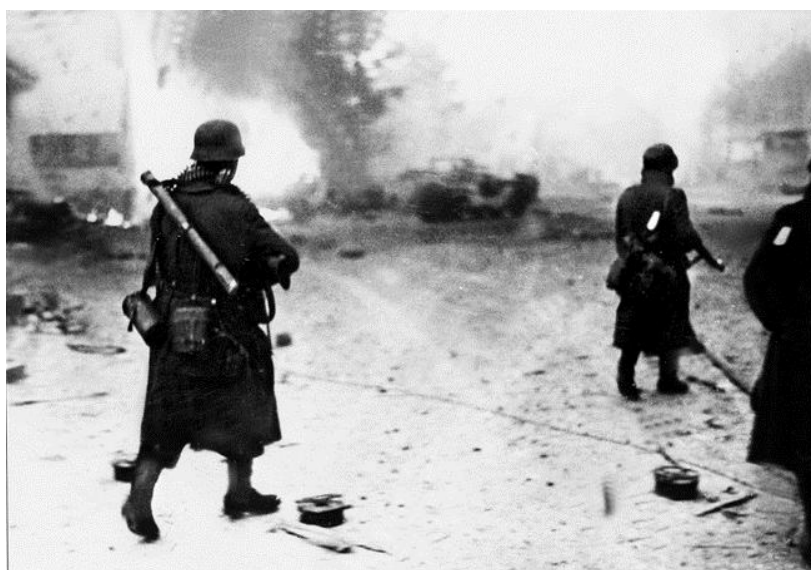
Немецкие пехотинцы продвигаются вперед через горящий населенный пункт где-то в Эльзасе

Для 79-й Дивизии испытания еще далеко не закончились. 19 января немцы возобновили атаки на ее позиции в Рорвиллере и Друсенхейме. Ведя интенсивный пулеметный огонь к югу от Друсенхейма, немцы отвлекли внимание американцев, после чего осуществили основную атаку севернее городка. Их ударные группы просочились в него и подавили пулеметные гнезда и позиции истребителей танков в секторе Роты Н. Затем две роты вражеской пехоты, поддержанные пятью танками и бронемашинами, вошли в город и быстро смяли еще оказывавшие сопротивление остатки Роты Н.