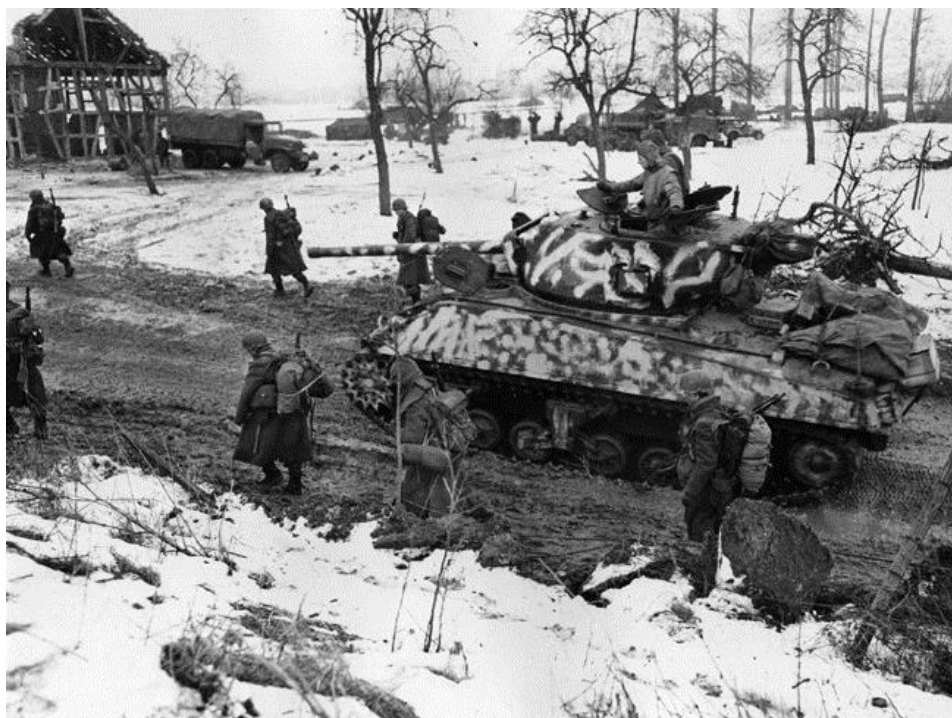
Американские пехотинцы сопровождают танк Шерман в ходе наступления на Кольмарский Выступ в январе 1945 года

Двумя днями спустя части 101-й Воздушно-десантной Дивизии американцев начали прибывать в Эльзас на смену потрепанному в тяжелых боях 314-му Полку 79-й Дивизии. Сражение за Выступ в Арденнском секторе фронта подошло к концу, и теперь командование союзников могло перебрасывать войска из этого сектора на усиление оборонительных линий в Эльзасе. В то же время у немцев уже не оставалось резервов для развития успеха на локальных участках этого сектора фронта. 29 января союзники перешли в наступление в Эльзасе. 31 января они вошли в Эррлишем, оставленный немцами. Через неделю наступающие с севера американцы и с юга французы встретились в центре Кольмарского Выступ, который немцы к этому моменту уже покинули. Пока немцы уходили на правый берег Рейна, 7-я Армия Паттона приступила к зачистке северо-восточного Эльзаса и к концу месяца заняла плацдарм на немецкой земле за рекой Саар.