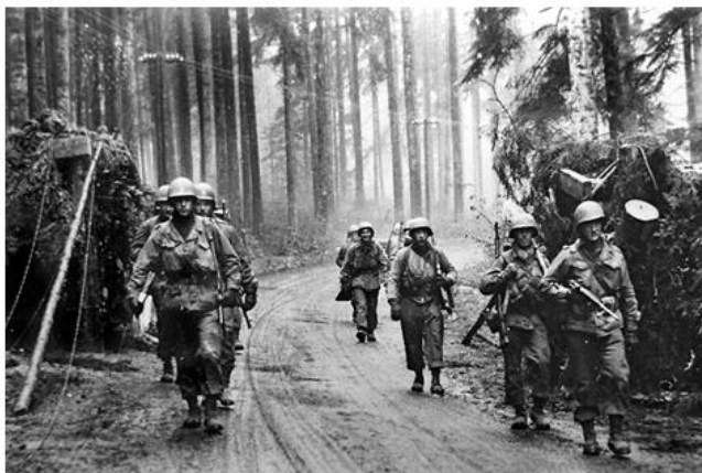
Слева: нарукавная нашивка-эмблема 100-й Дивизии, справа: солдаты 398-го Полка продвигаются по дороге через разрушенный заслон. Эльзас, ноябрь 1944 года