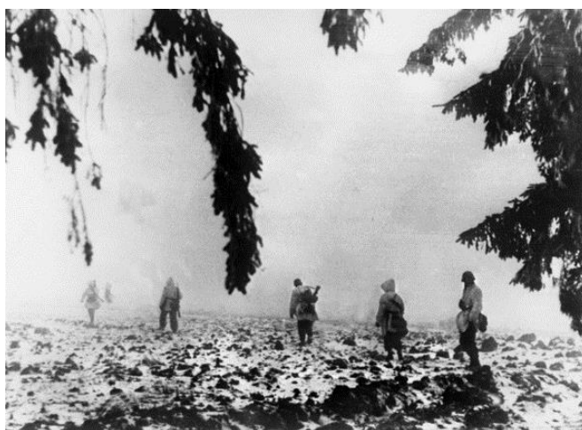
Немецкие пехотинцы выходят на рубеж для атаки. Январь 1945 года

тонн продовольствия и военных материалов и который Гитлер стремился выбить из рук союзников. Через Антверпен также проходила линия раздела главных союзных армий: 21-й Армейской Группы фельдмаршала Монтгомери и 12-й Армейской Группы генерала Омара Брэдли. Гитлер надеялся, что, если ему удастся рассеять силы союзников, нанести им большие потери и захватить основной порт снабжения, общественное мнение в США и Великобритании призовет своих лидеров к переговорам и достижению мирного соглашения с Германией. Гористые и залесенные Арденны он рассматривал как идеальное место для контрнаступления: там ему сопутствовал колоссальный успех весной 1940 года... Однако его генералы были в ужасе. Шансов на успех для такого контрнаступления не было, и они запротестовали, утверждая, что такая операция приведет к катастрофе. Гитлер отверг возражения своих генералов и приказал им найти способ добиться успеха.