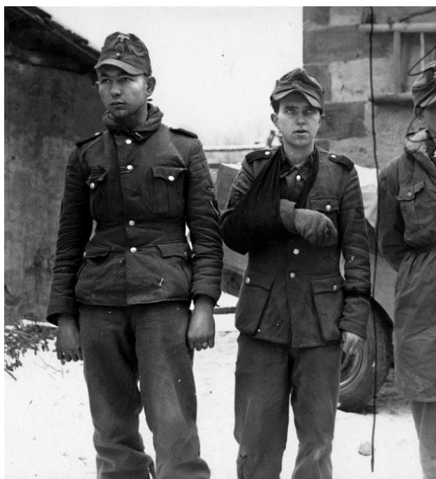
Немецкие военнопленные-подростки. Эльзас, 1945 год

В 2 часа дня 6 января Рота G 314-го Полка вошла с северо-запад в Друсенхейм, сидя на броне танков. Вступив в контакт с Ротой А 232-го Полка, 2-й Батальон перешел реку Модер по мосту под ружейно-пулеметным огнем немцев, чтобы взять под контроль южную часть городка. Пять танков переехали по мосту. После чего он частично обрушился, и его использование стало невозможным. Эти пять танков присоединились к продвигающейся вперед Роте F. В 16.30, когда Рота F вышла к окраине Друсенхейма, немцы встретили ее огнем легкой артиллерии. Американцы атаковали укрепленный пункт обороны противника – здание фабрики на восточном берегу Модера – и взяли в плен двоих офицеров и 51 солдата. Остальная часть батальона заняла позиции в самом городке и по его окраинам, чтобы отразить неминуемую контратаку противника.