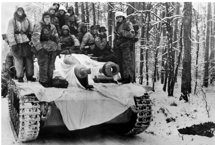
Немецкие пехотинцы на броне САУ Sturmgeschutz в районе лесного массива Агно

9 января Боевая Группа В из состава 12-й Танковой Дивизии американцев (состоявшая из 56-го Батальона Механизированной Пехоты и 714-го Танкового Батальона) получила приказ оказать поддержку 79-й Дивизии в ее атаке на оборонительный узел немцев в Эррлишеме, но не сумела добиться существенного успеха: танки Шерман не могли противостоять противотанковым огневым средствам врага. В тот же день, 8 января, дальше к западу 6-я Горная Дивизия СС взяла Винжан-сюр-Модер, расположенный на стыке 15-го и 6-го корпусов американцев.