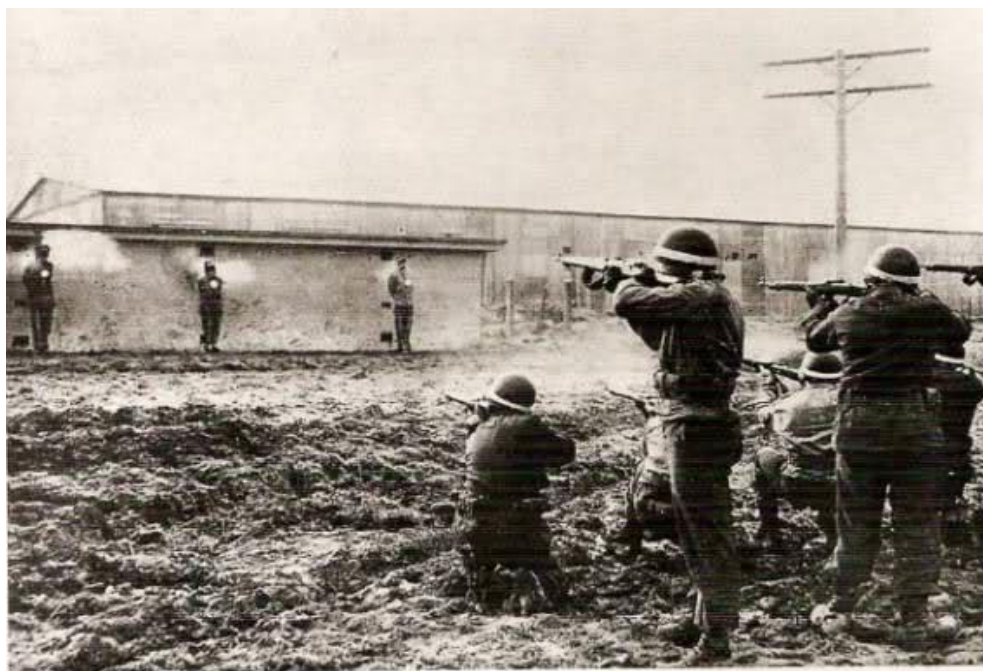
Сцена расстрела диверсантов