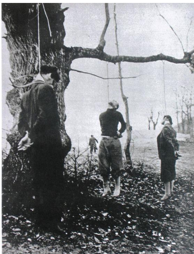
Казненные итальянские партизаны

Ну, взгляните на это дело так: они этим не заморачивались, и мы о них тоже не беспокоились.