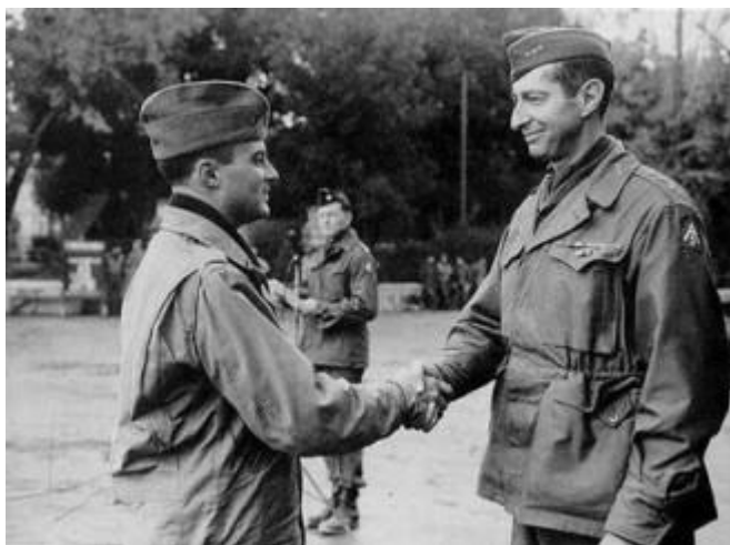
Генерал Кларк приветствует бразильского офицера