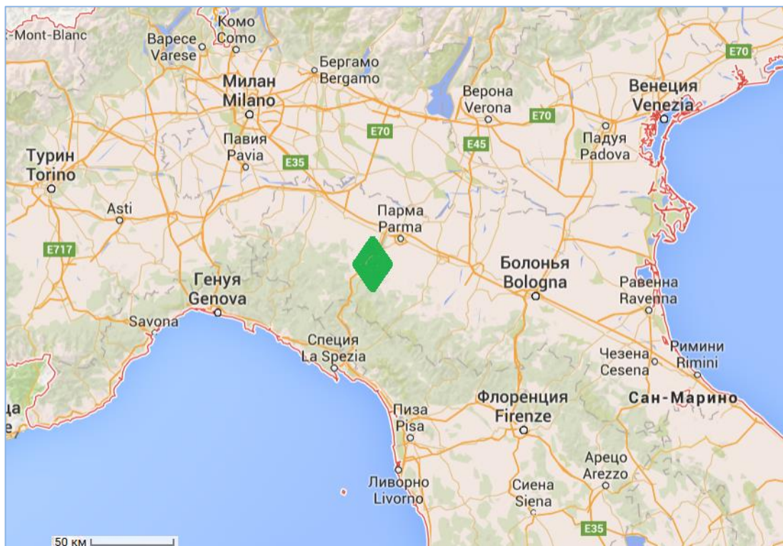
Фрагмент карты Северной Италии. Зеленым ромбом показан район последних боев FEB ( https://www.google.kz/maps/place )

в боях близ Форново бразильцы захватили в плен 14 000 немцев, включая 800 офицеров и двух генералов.