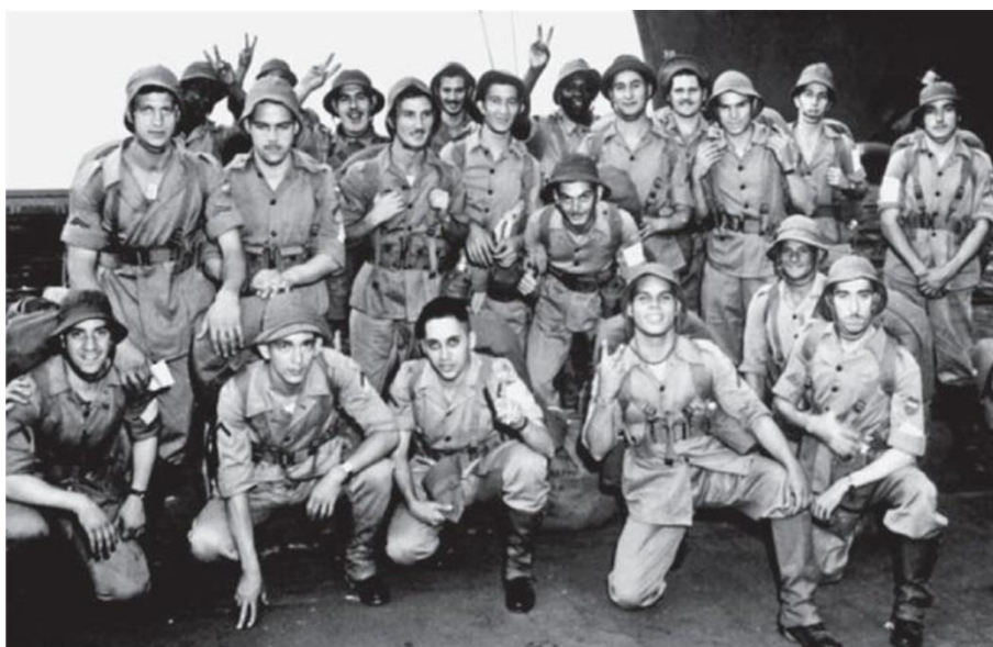
Фебианос перед отправкой за океан ( http://gruntsandco.com/wp-content/uploads/2014/07/BrGt-3.jpg )

Однако нацеленность руководства страны на создание экспедиционного корпуса для участия в военных действиях в Европе , как ни странно, не вызвала энтузиазма у англо-американских союзников, которым в разгар войны, казалось, не помешали бы подкрепления: присутствие на театре военных действий не слишком боеспособного контингента, который будет необходимо одевать, кормить, обучать и вооружать, могло стать лишней головной болью, и союзники активно пытались отговорить президента Варгаса от этого шага. Однако бразильцы настояли на своем. Бразильский экспедиционный корпус, созданный для отправки в Европу, получил название Força Expedicionária Brasileira – FEB , а за военнослужащими корпуса закрепилось прозвище febianos/фебианос .