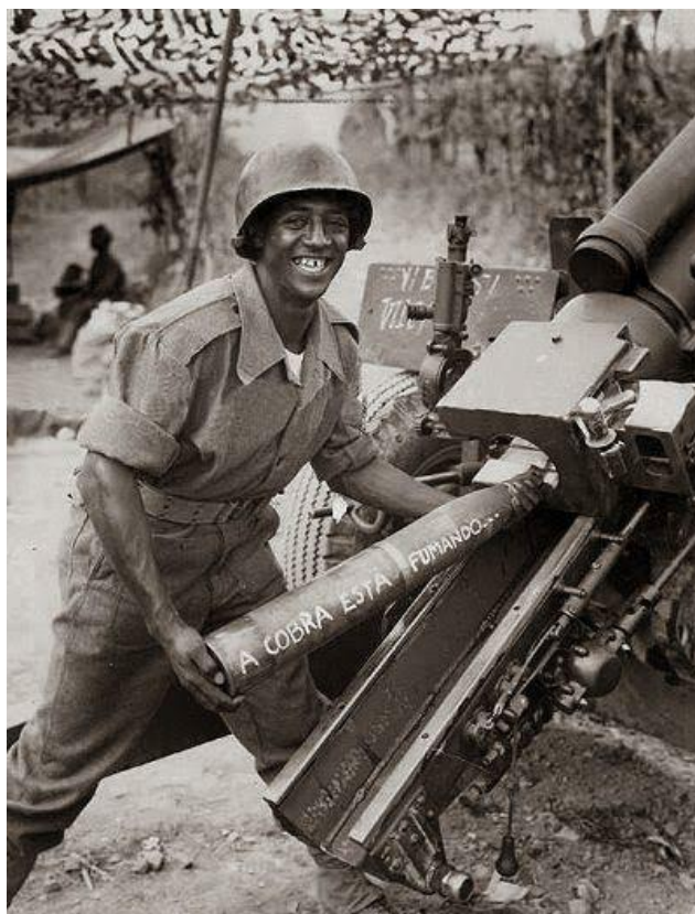
Бразильский артиллерист (на снаряде надпись: A Cobra Esta Fumado – Кобра Курим ) http://www.reunidas.com/blog/brazil-in-the-second-world-war