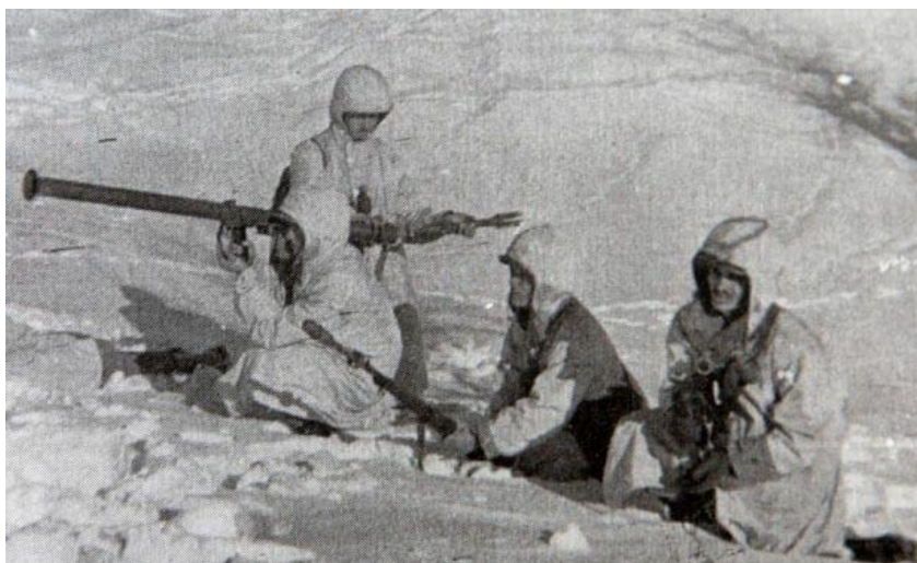
Бразильский боевой патруль. Зима 1944/45