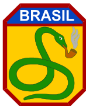
Эмблема и нарукавная нашивка FEB ( https://en.wikipedia.org/wiki/Brazilian_Expeditionary_Force )

В конце концов, после бесконечных задержек с подготовкой FEB к отправке в Европу, среди бразильцев в целом и солдат корпуса в частности стала популярной следующая шутка (иногда пишут, что ее впервые высказал Гитлер, услышав о предстоящем прибытии солдат из экзотической страны): «В тот день, когда FEB отправится в путь, бразильские змеи закурят трубки.» Змея с дымящейся трубкой, в итоге, стала эмблемой FEB . Тем не менее, 2 июля 1944 г. первый контингент, насчитывавший 5 000 бразильцев, отправился за океан и 16 июля прибыл в Неаполь.