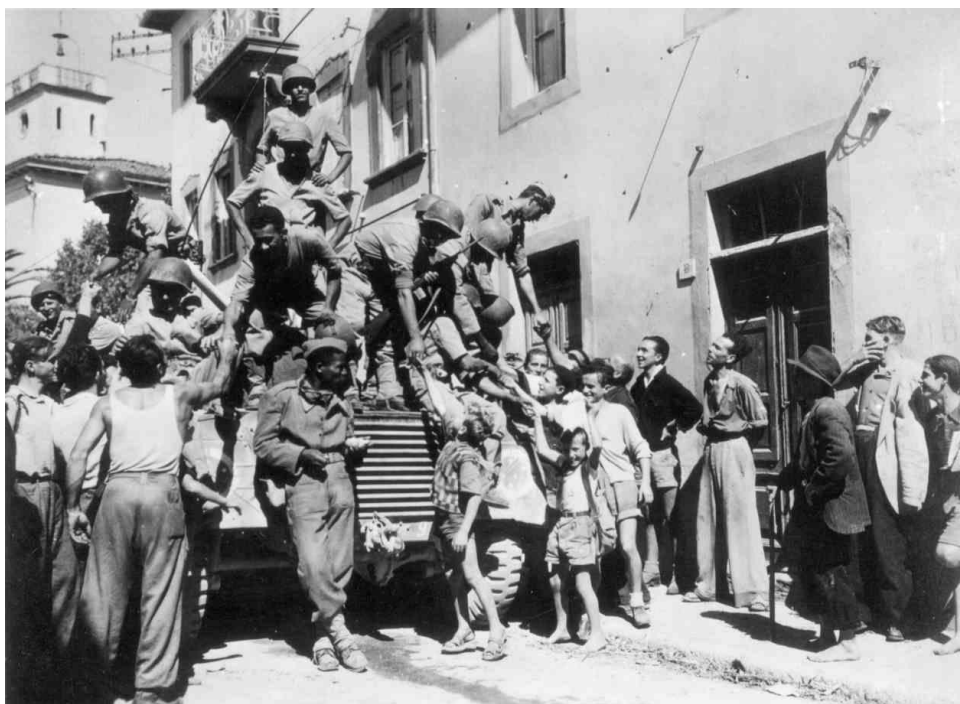
Итальянцы приветствуют бразильских солдат. Сентябрь 1944 г., город Массароза (Massarosa)

https://en.wikipedia.org/wiki/Brazilian_Expeditionary_Force#/media/File:Massarosaw.jpg