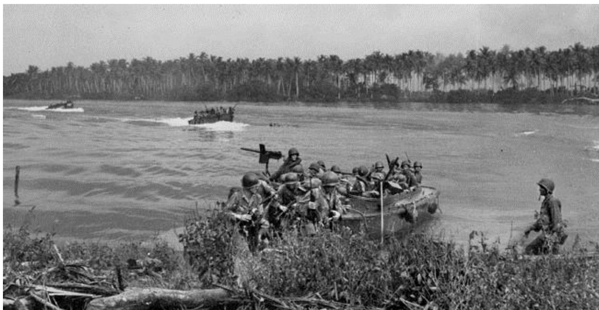
Пехотинцы 1-й Кавалерийской Дивизии высаживаются на острове Лос Негрос 29 февраля 1944 года

Десантники с катера, на котором находился Элсин, «быстро высыпали на пляж» и приступили к делу. Американцы стали быстро перебежать через взлетные полосы аэродрома Момоте и углубились в заросли кустарника на противоположной стороне примерно на 300 ярдов. К 09.50 утра они вышли на первый намеченный рубеж. Через несколько часов десантники генерала Чейза закончили разгрузку людей и материалов. Занятие плацдарма стоило им двух человек убитыми и трех ранеными.