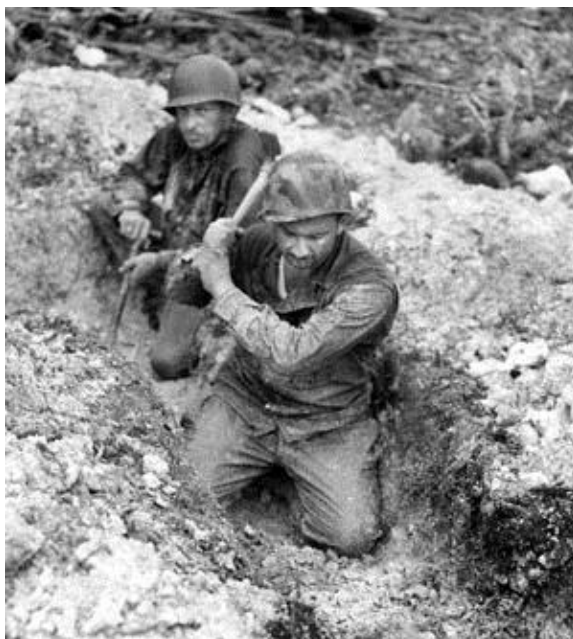
Солдаты 5-го Кавалерийского Полка пытаются окопаться сразу после высадки на Лос Негрос. Характер грунта явно их не радует ...