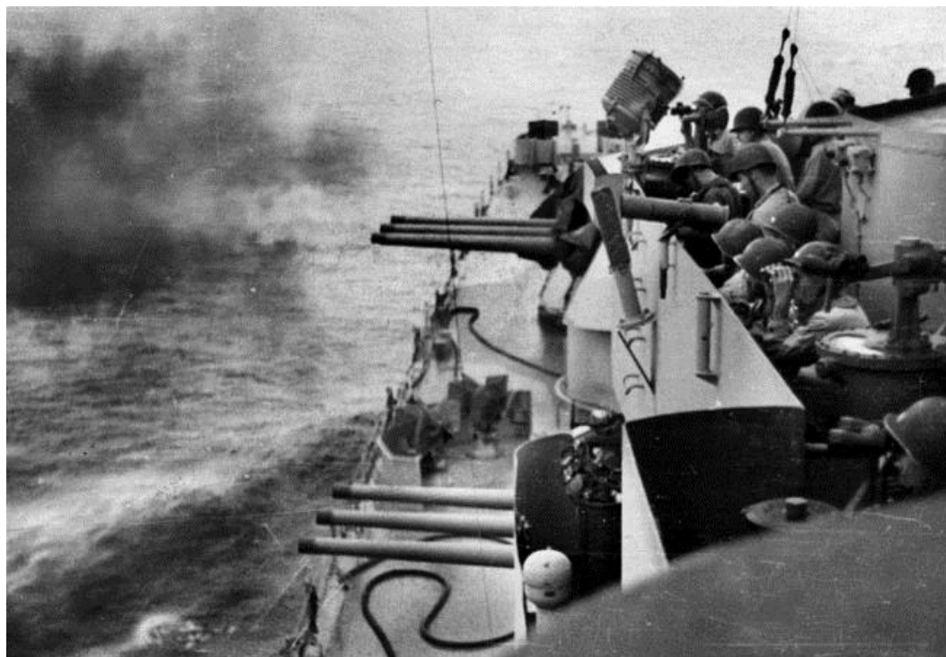
Артиллеристы крейсера Phoenix обстреливают Лос Негрос перед высадкой десанта 29 февраля