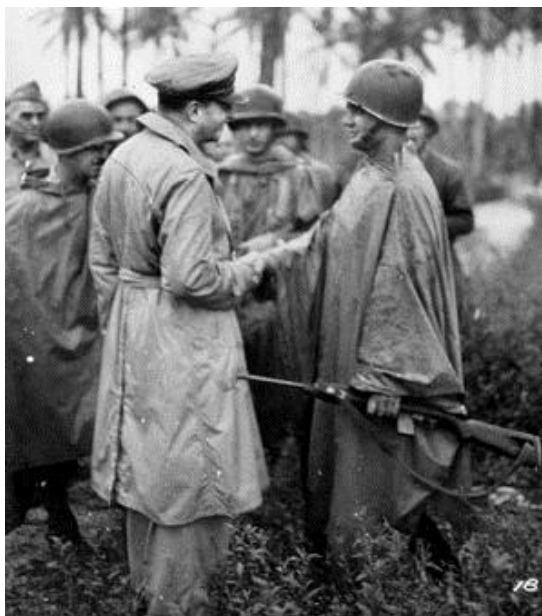
Макартур поздравляет лейтенанта Хеншо с высокой наградой. К сожалению, этот офицер погиб 6 апреля 1944 года

Десантники с катера, на котором находился Элсин, «быстро высыпали на пляж» и приступили к делу. Американцы стали быстро перебежать через взлетные полосы аэродрома Момоте и углубились в заросли кустарника на противоположной стороне примерно на 300 ярдов. К 09.50 утра они вышли на первый намеченный рубеж. Через несколько часов десантники генерала Чейза закончили разгрузку людей и материалов. Занятие плацдарма стоило им двух человек убитыми и трех ранеными.