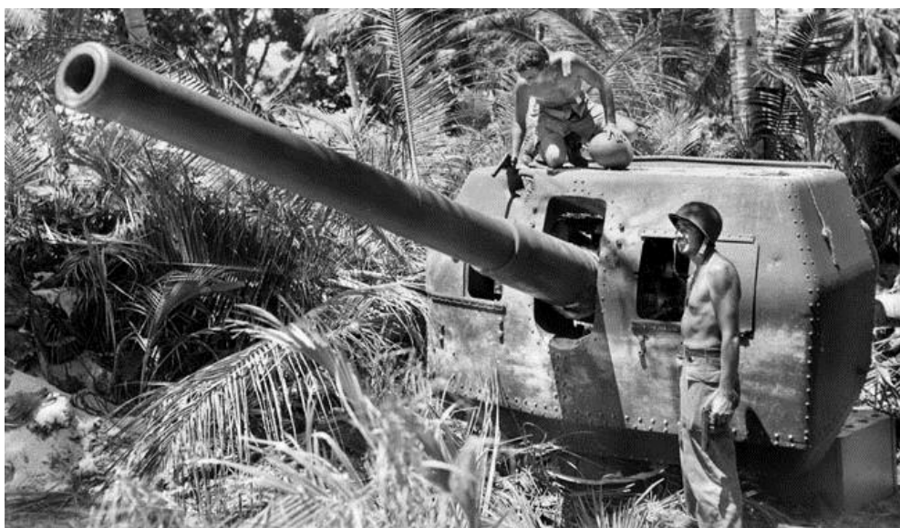
Солдаты 99-го Дивизиона Полевой Артиллерии осматривают захваченное орудие японской береговой артиллерии близ аэродрома Момоте

4 марта на плацдарм прибыли дополнительные подкрепления, и 5 марта генерал-майор Свифт сошел на берег, чтобы принять на себя командование операцией по занятию островов. К этому времени по всему плацдарму кипела работа: армейские и военноморские инженеры были видны повсюду – они строили портовые сооружения и доводили до рабочего состояния аэродром Момоте. Части обслуживания складировали различные материалы, медики ухаживали за ранеными.