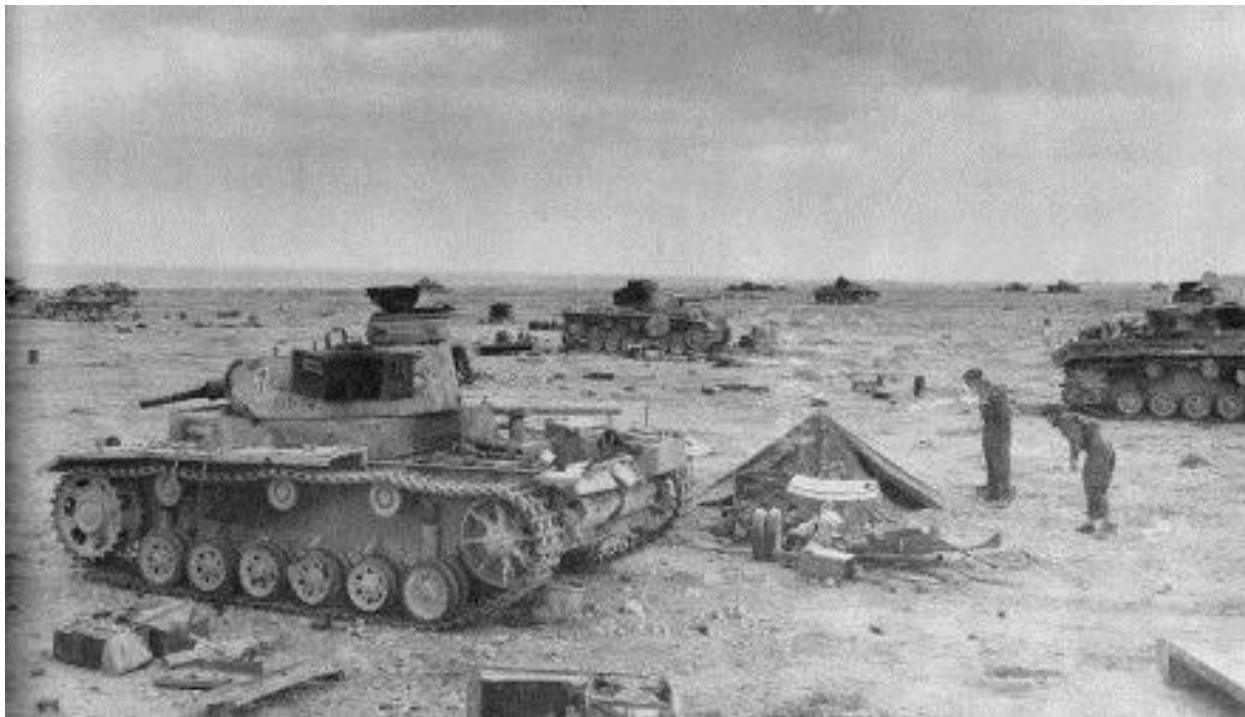
Район Сиди-Резег после танкового сражения...

сопротивление. Южноафриканцы к югу от нас наконец вынудили итальянские дивизии отступить на северо-запад в сторону Газалы. Теперь основные бои шли на участках Сиди Резег и Эль Адам. Немецкая пехота в районе Эль Адам дралась с фанатическим упорством, и их воля к сопротивлению была невероятной. Весь этот район напоминал кладбище наших сгоревших танков. Всюду и везде в небо поднимались столбы дыма от этих погребальных костров.