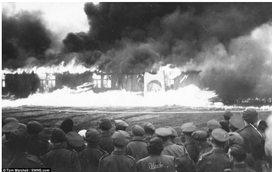
Британцы сжигают постройки концлагеря Берген-Бельзен https://www.iwm.org.uk/history/the-liberation-of-bergen-belsen