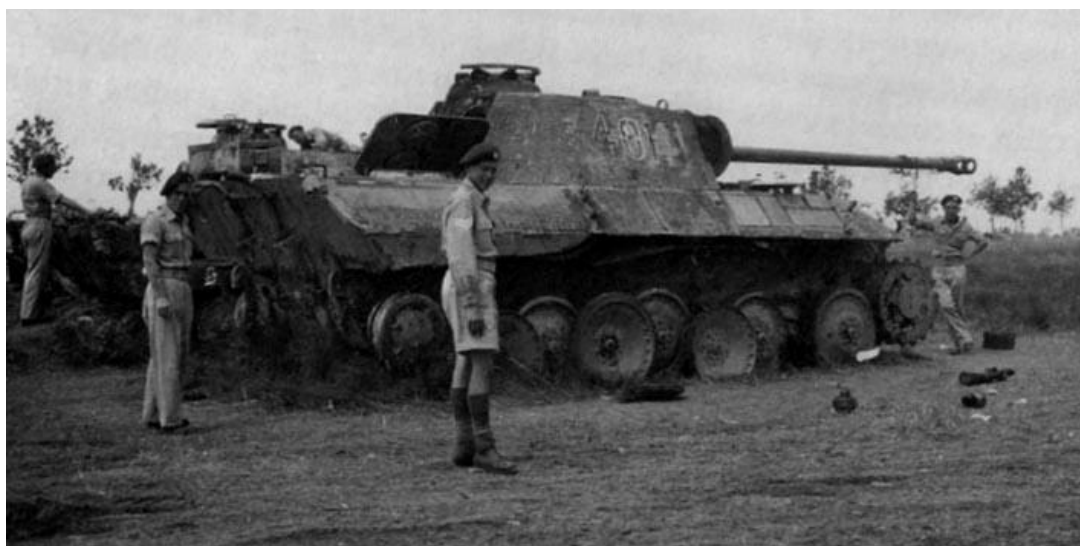
Танкисты 2-го Королевского полка осматривают уничтоженную Пантеру

1944 – холокост под Кассино. Но я все еще оставался целым и невредимым, так что все еще было не так уж и плохо!