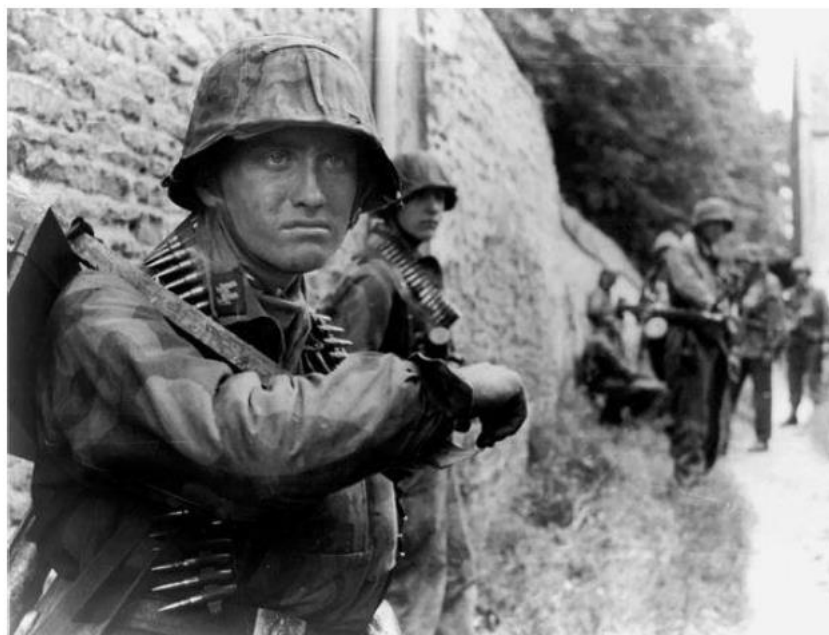
Солдаты дивизии Hitlerjugend после неудачной атаки под Каном 9 июня 1944 г.

позицию с точность до двух метров, если мы использовали рацию. [В итоге], только 20 человек из нас выбрались из Фалезского котла – остальные погибли или попали в плен.