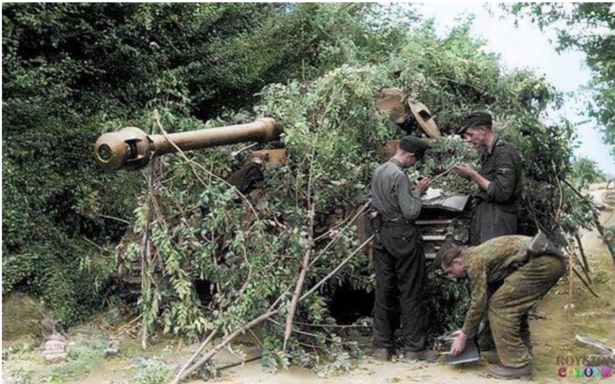
Танкисты дивизии Leibstandarte SS Adolf Hitler маскируют свой танк. Нормандия, лето 1944 г.

участвовало около 70 бомбардировщиков. Но это была только воздушная часть бомбардировки. Эти атаки действовали на нервы, если не сказать больше, и мы ждали вечера, когда становилось потише. Противник тоже, казалось, хотел перерыва вечером, чтобы его солдаты могли поесть и отдохнуть. Наш фургон с питанием мог подъехать к нам только в темное время суток, поэтому мы съедали весь наш дневной рацион в 23.00. В тот вечер наводчик и я были отправлены на поиски продуктов, и, пробираясь на другую сторону деревни, мы пришли в ужас от разрушений, которые мы увидели. Не осталось ни одного целого дома.