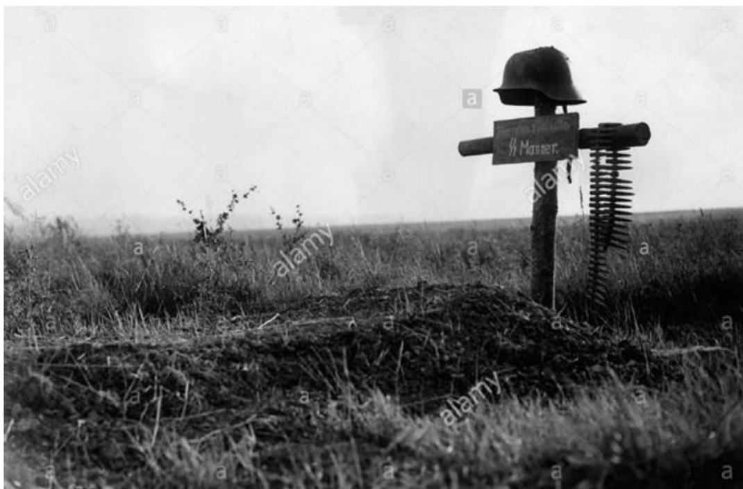
Могила солдата Waffen-SS. Нормандия