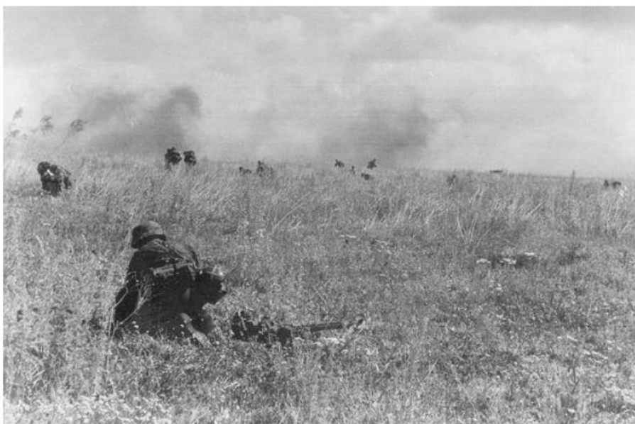
Солдаты дивизии Frundsberg в атаке на позиции британцев под Каном

Как только началось вторжение в Нормандию, мою дивизию перебросили из России в Нормандию, куда она прибыла в конце июня. Мы сразу же пошли в бой против британских войск, которые наступали на юго-запад от Кана.