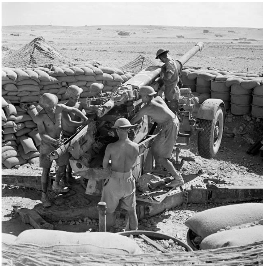
Австралийский расчет 3.7-дюймового зенитного орудия готовится вести огонь по наземным целям. Тобрук

На этом первое стратегическое наступление Роммеля подошло к концу. Британская газета The Times писала, откликнувшись на апрельское наступление Оси: «Сохраняется чувство спокойной уверенности ... Передовые отряды противника, похоже, редуют ... тогда как сокращение протяженности наших транспортных линий обеспечило существенное укрепление сил британцев.»