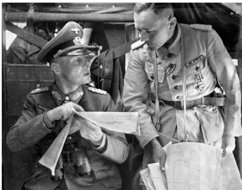
Роммель инструктирует офицера разведки перед рекогносцировкой. Подступы к Тобруку, апрель 1941 года