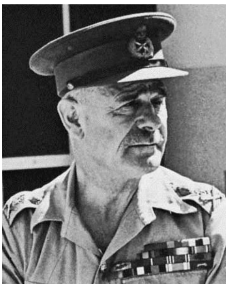
Арчибальд Уэйвелл (1883-1950). Об этом человеке с большим уважением отзывался Роммель, который всю войну возил с собой книгу Уэйвелла Generals and Generalship , изданную в 1941 году

Третий промах был допущен Уэйвеллом, когда он выбрал на смену Уилсону, срочно отбывшему в Грецию, генерал-лейтенанта Филипа Нима (Philip Neame). Он не знал Нима достаточно хорошо, но считал репутацию этого человека соответствующей обстоятельствам. Вот что он вспоминал: «Я не знал его близко, когда-то он командовал 4-й Индийской Дивизией... Он был сапером, в прошлом служил инструктором в Штабном Колледже, был автором книги по стратегии, так что я воспринимал его как умелого и образованного солдата, его Крест Виктории [получен Нимом за героизм во время ПМВ] был гарантией