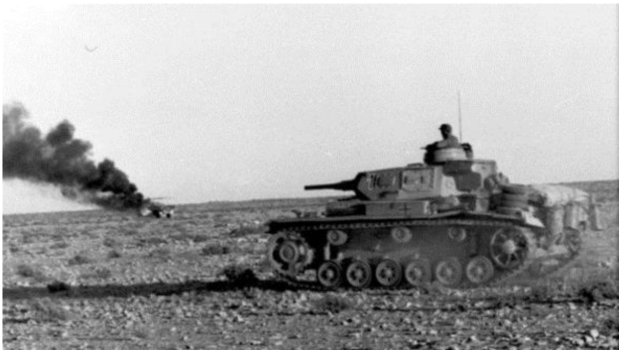
Апрель 1941 года. Немецкий танк продвигается вперед, вдали – горящий британский танк