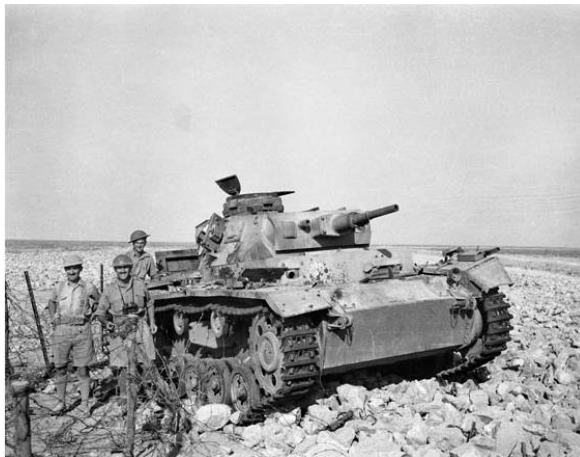
Слева: немецкий танк преодолевает противотанковый ров на подступах к Тобруку по насыпи, созданной саперами; справа: австралийцы рядом с подбитым немецким танком на подступах к Тобруку. Апрель 1941 года