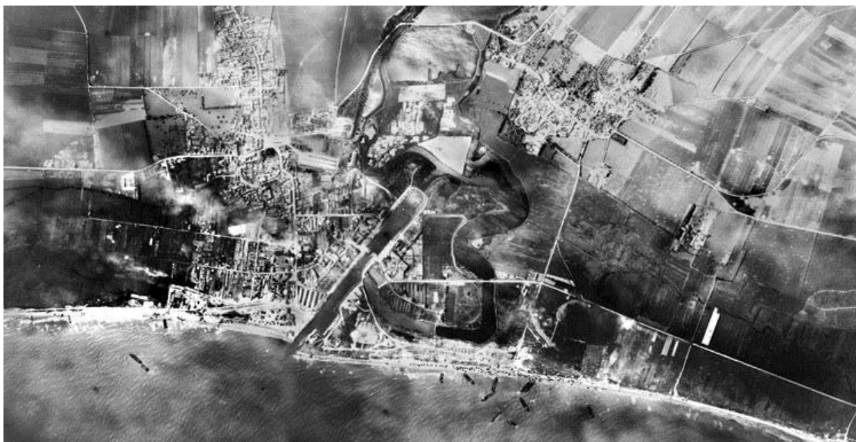
Аэрофотоснимок пляжа Juno, сделанный утром 6 июня 1944 года. На нем видны десантные суда, с которых высаживаются канадцы

Канадские части копировали структурные схемы, принятые в британской армии. В 1944-45 годах пехотные дивизии из Великобритании и стран Содружества состояли из штаба и трех бригад. Каждая бригада включала в себя три пехотных батальона, что делало пехотные дивизии похожими по составу на трехполковые дивизии американской армии. В дивизию также входил полк разведки, три полка полевой артиллерии, противотанковый полк и полк легкой зенитной артиллерии, каждый из которых по составу был аналогичен дивизиону американской армии. Каждая дивизия также имела в своем составе инженерную часть, состоявшую из трех рот, плюс ремонтная рота/рота материального обеспечения (field park company). Общее число офицеров (870) и нижних чинов (17 477) в британской пехотной дивизии составляло 18 347 человек, что было несколько больше, чем в обычной американской пехотной дивизии в то время. Вооружение включало в себя 1 262 легких пулемета, 359 минометов, 72 25-фунтовые полевые пушки, 110 противотанковых пушек и 125 зенитных пушек и пулеметов. 3-я Пехотная Дивизия прошла переоснащение своих артиллерийских дивизионов, получивших на вооружение самоходные 105-мм артиллерийские установки, известных под прозвищем Priest/Священник , которое появилось благодаря форме пулеметной установки, напоминающей кафедру (трибуну) священника в храме.