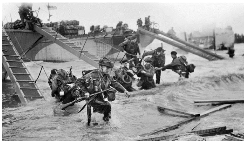
Коммандос Королевской Морской Пехоты высаживаются на пляж Juno в условиях сильного прибоя в районе деревни Сен-Обен-сюр-Мер 6 июня 1944 года ...