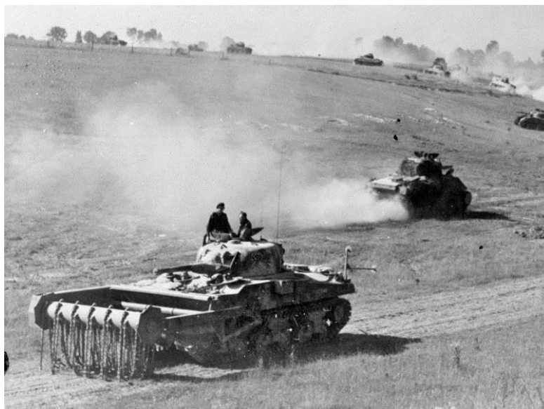
Канадский Шерман с цепным тралом – одна из Смешных Штук, получивших прозвище Краб/Crab...

Выбираясь на берег, солдаты Полка Легкой Пехоты Горцев/Highland Light Infantry, тащившие на себе велосипеды и снаряжение, сталкивались с тем, что «берег был забит войсками с машинами и танками, пытавшимися продвинуться к выходам с пляжа. Всякое движение часто прекращалось, когда находившаяся впереди машина застревала в песке. Все было в полном беспорядке и даже не напоминало организованные практические занятия, которые мы проводили ранее. Многие из нас возносили хвалы всевышнему за то, что были так здорово прикрыты с воздуха. Одна-единственная пушка, нацеленная на пляж, нанесла бы нам неисчислимые потери, но 9-я Канадская Пехотная Бригада высадилась без единого выстрела [со стороны противника].»