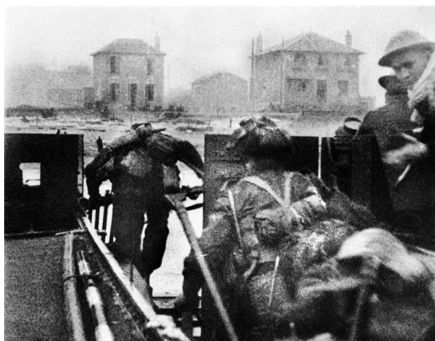
Скриншот из новостной кинохроники Дня Д. Канадские солдаты из Нью-Брунсуикского Полка высаживаются на берег около 8.05 утра. Сектор Nan Red пляжа Juno в приморской части города Сен-Обен-сюр-Мер...