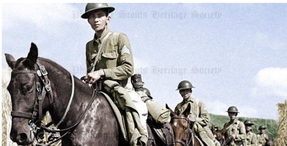
Скауты – наиболее боеспособные солдаты-филиппинцы https://www.philippinescouts.org/the-scouts/units/26th-cavalry-ps

Несмотря на недостаточный уровень обученности пехотных частей, нехватку средств воздушного предупреждения и аэродромов, в Вашингтоне и Маниле доминировал оптимизм по отношению к способности гарнизона острова Лусон отразить японское вторжение. К началу войны численность личного состава боевых американских воинских частей на Филиппинах, включая подчиненные части Филиппинской армии, составила 31 095 человек - 2 504 офицера и 28 591 нижнего чина, в том числе – 16 643 американца и 11 957 филиппинца. Помимо 51-го Полка Филиппинской Дивизии американцы входили в состав частей ВВС (8 500 человек), двух батальонов легких танков M3 Стюарт/Stuart (192-й и 194-й) в составе 51-й Дивизии, 200-й (Зенитный) Полк Береговой Артиллерии и в недавно прибывший из Китая 4-й Полк Корпуса Морской Пехоты.