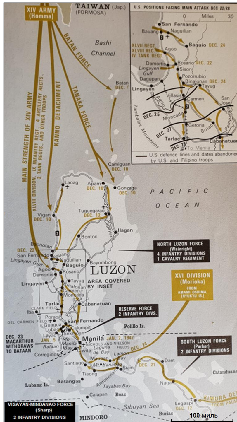
Общая карта боевых действий на Филиппинах – декабрь 1941 года – начало января 1942 года

Японцы шли на осознанный риск, используя довольно малочисленные контингенты для предварительных десантов – крупнейший из них был осуществлен отрядом полковой численности. На острове Батан на рассвете 8 декабря японцы высадили отряд моряков численностью 490 человек, который не встретил сопротивления. Через два дня был захвачен остров Камигин/Camiguin, за счет чего у японцев появилась база для размещения гидропланов в 35 милях от Апарри.