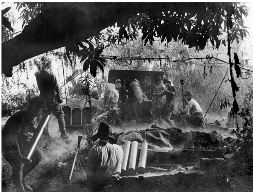
Японские артиллеристы ведут обстрел позиций американцев на Батаане

3 апреля началась ожесточенная бомбардировка. 5 часов японские пушки, гаубицы и минометы обстреливали усталых и, часто, больных солдат и офицеров, занимавших оборонительные позиции. На позиции союзников у подножия горы Самат было сброшено более 60 тонн бомб. К вечеру части 16-й Дивизии и 65-й Бригады японцев продвинулись на 1 000 ярдов: артподготовка сделала это значительно более легким делом, чем ожидал сам генерал Хомма, так что он отдал приказ продолжить на следующий день продвижение вперед, не тратя времени на то, чтобы закрепиться на достигнутом рубеже.