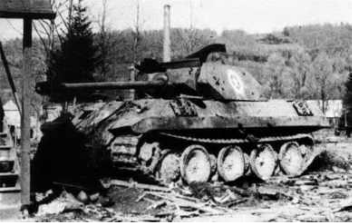
Подбитая Пантера с американскими звездами на башне

Операции роты Stielau , безусловно, достигли успеха. Коммандос сумели собрать и передать ценную разведывательную информацию в первые два дня операции, внести сумятицу и элементы паники в ряды американцев, нарушить во многих местах связь. Захват трех из девяти диверсионных групп также добавил паники к психологическому состоянию американцев.