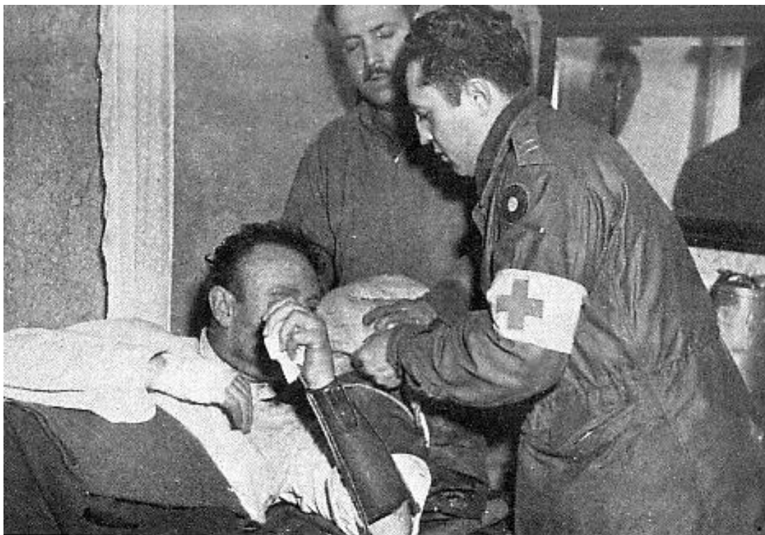
Американские санитары оказывают помощь пленному фон Хайдте ( http://histomil.com/viewtopic.php?f=337&t=13840&start=200 )