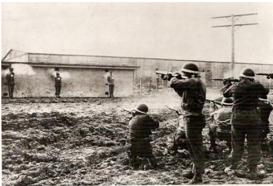
Сцена расстрела диверсантов