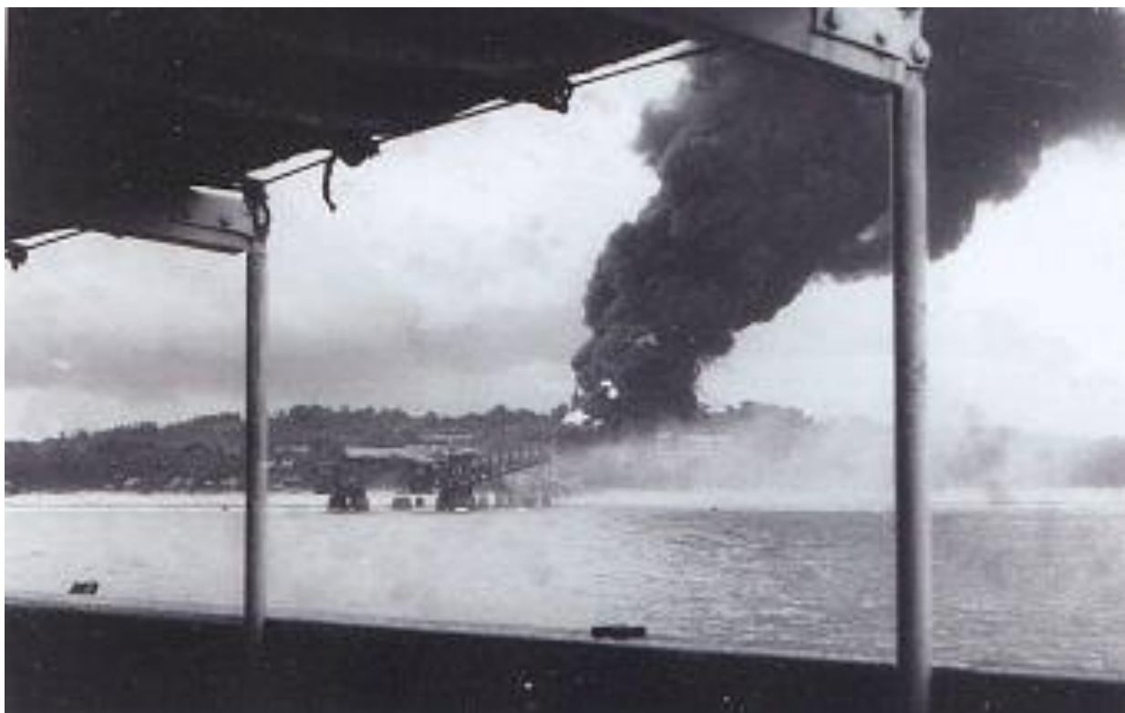
Нефтехранилище Науру в огне https://www.oocities.org/bobcarmich/nauru_1.html