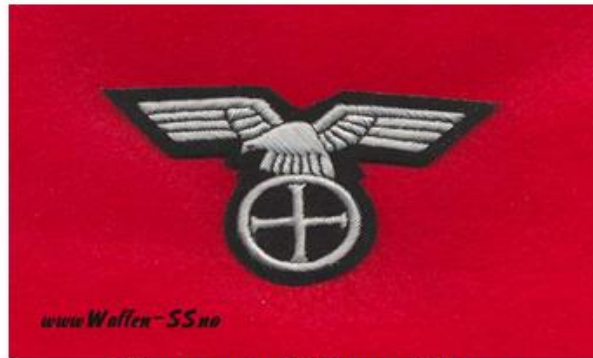
"Germanske SS Norge" Ravn