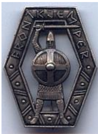
Нагрудный знак Frontkjempermerke