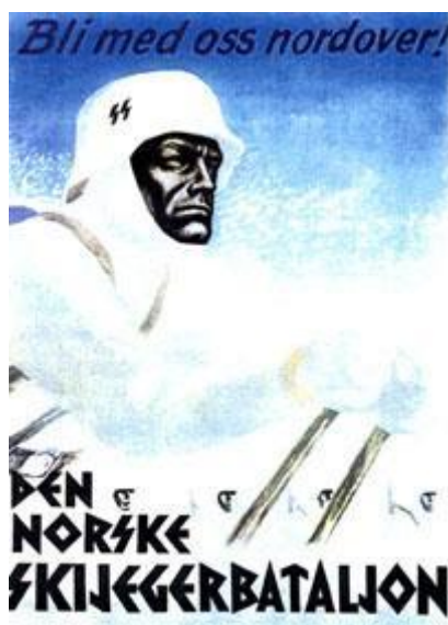
Плакат лыжного батальона норвежских СС