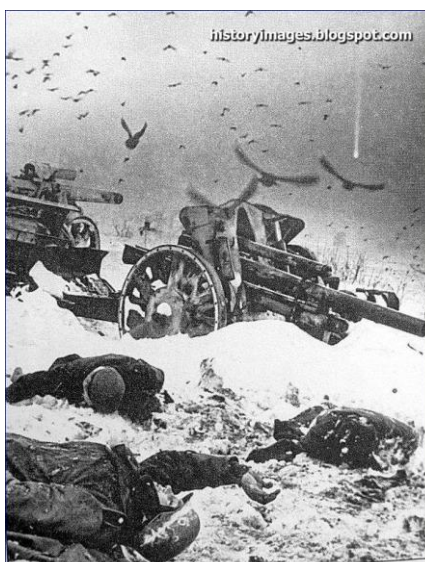
Восточный фронт: убитые немецкие артиллеристы...