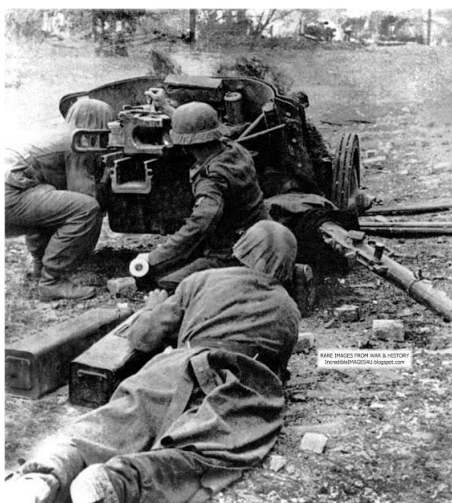
Немецкие артиллеристы в бою