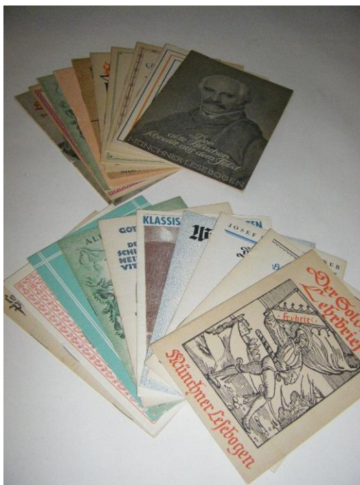
Журналы Münchner Lesebogen

Я совсем закопался в своих душевных переживаниях, и, в целом, слишком много думаю. Я часто ловлю себя на том, что пытаюсь постичь вещи, сами по себе не являющиеся рациональными. Вероятно, это Россия давит столь сильно мне на психику. Я тоскую по пище для ума, как голодная собака по кости. Как хотел бы я сейчас заняться научной работой! Все, что есть под рукой, - это номера Münchner Lesebogen (Журналы для немецких солдат с публикациями на различные темы: философия, поэзия, история, лирические произведения, пропаганда и политика, детские рассказы - ВК), мои молчаливые спутники. Они воодушевляют и успокаивают меня. На их страницах я открываю себя и иногда нахожу ответы на свои трудные вопросы. Они - мои настоящие друзья, изо дня в день, особенно в часы одинокой рефлексии.