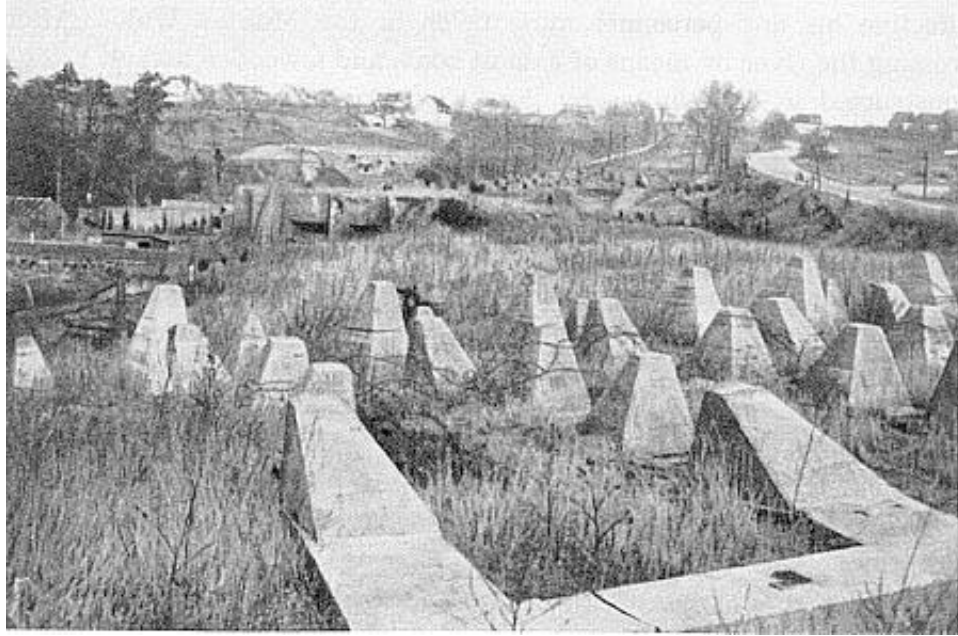
Siegfried Line - Линия Зигфрида. На переднем плане бетонные надолбы (Dragon's Teeth - Зубы Дракона), на дальнем - доты

Как-то раз нам пришлось еще раз брать дот. Это было, когда мы прорывались через Зубы Дракона на Линии Зигфрида. Мы были первыми, кто пересек эту линию, кажется, 24 сентября. Мы увидели эти самые бетонные надолбы, они и правда выглядели как зубы. За таким зубом можно было спрятаться. Однако, дальше за зубами был дот, небольшой такой. Дело было ночью, шла перестрелка, пару ребят ранило. Один раненый пролежал на земле всю ночь – он стонал и звал маму, но мы не могли вытащить его. Среди ночи он умер. Наутро дот оказался пустым, и я сделал его своим штабом на пару дней.