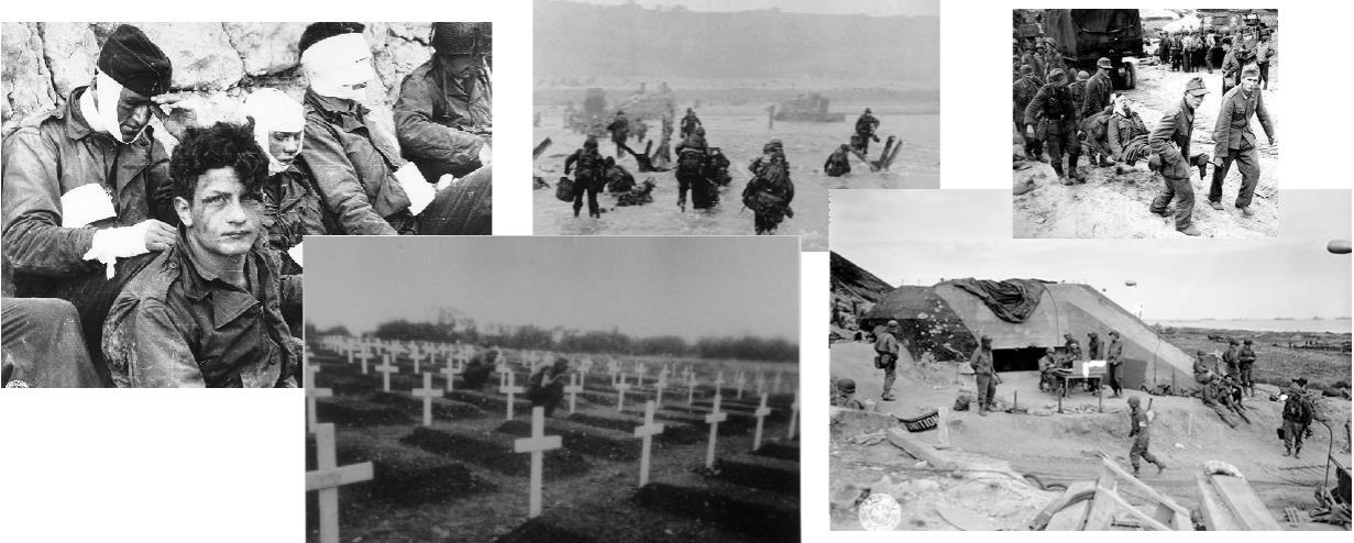
Омаха Вич – слева направо: верхний ряд - раненые американцы, высадка, пленные немцы, нижний ряд - военное кладбище рядом с местом высадки, захваченный дот