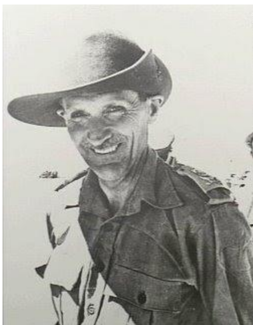
Северная Африка, 1942. Монтгомери с австралийской шляпой на голове... http://9thdivvy.blogspot.com/2008/08/image-monty-and-that-slouch-hat.html

Да нет, они были где-то позади нас, и у нас с ними контактов не было. У нас не было контактов с ними [с высшим командованием], пока не пришел Монтгомери. Он дал возможность познакомиться с собой: он приезжал и осматривал войска. Вы не знали, когда он может появиться. Мы считали, что Монтгомери – это человек на своем месте, нам всегда нравилось, когда он снимал ту самую австралийскую шляпу: он толком не знал, как ее носить! В той шляпе он всегда выглядел ужасно. Время от времени он приезжал в войска, но других [старших офицеров] мы никогда не видели.