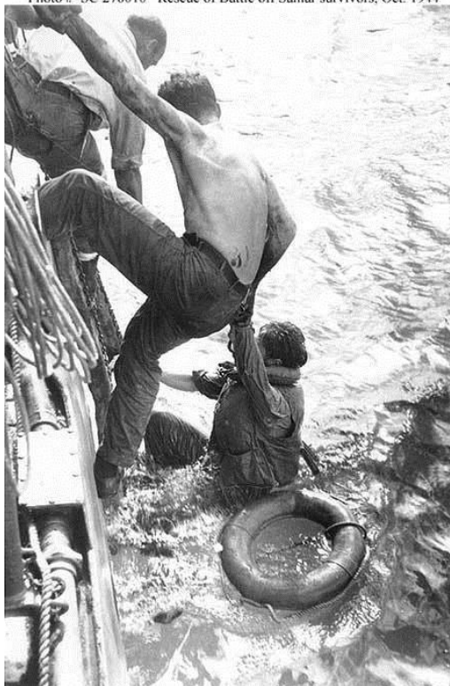
Спасение моряков с эсминца Samuel B. Roberts

http://www.navybook.com/no-higher-honor/timeline/uss-samuel-b-roberts-de-413/