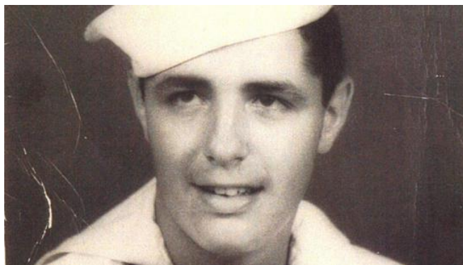
Джек Юсен (Jack Yusen), 1926 – 2016

https://www.history.com/shows/wwii-in-hd/cast/jack-yusen