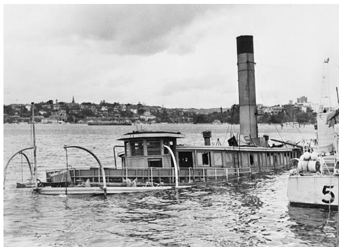
Вспомогательное судно Kuttabul после торпедной атаки

Бан выпустил свою вторую торпеду. Она прошла в четырех метрах от крейсера, вылетела на восточный берег острова Гарден, остановилась и не взорвалась.