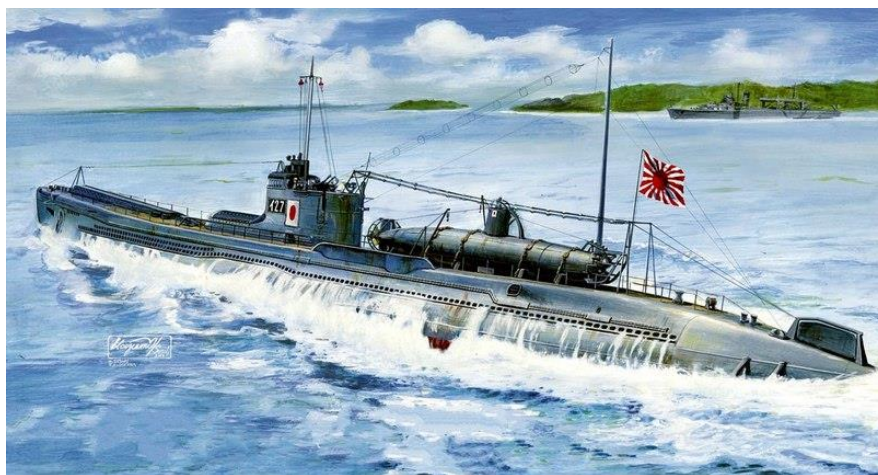
На рисунке – лодка I-27 с закрепленной на ней сверхмалой подводной лодкой

Сверхмалые лодки водоизмещением 46 тонн и транспортирующие их подводные лодки-матки подчинялись 8-й Эскадре подводных лодок. Получившая обозначение Специальная Ударная Группа (Special Attack Group) , 8-я Эскадра разделялась на две флотилии – Восточную и Западную. Первая из них была направлена к берегам Австралии. Флотилия включала в себя 6 крупных подводных лодок, четыре из них: I-22 , I-24 , I-27 и I-28 были лодками-матками и были задействованы для транспортировки сверхмалых лодок, две другие - I-21 и I-29 несли на борту гидропланы, которые предполагалось использовать для воздушной разведки. Каждая флотилия располагала плавучими базами для подводных лодок и гидропланов, им оказывали поддержку вспомогательные крейсера.