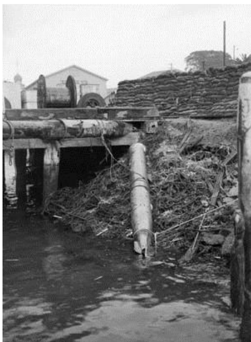
Вторая японская торпеда, выпущенная с той же подводной лодки, которая повредила Kuttabul