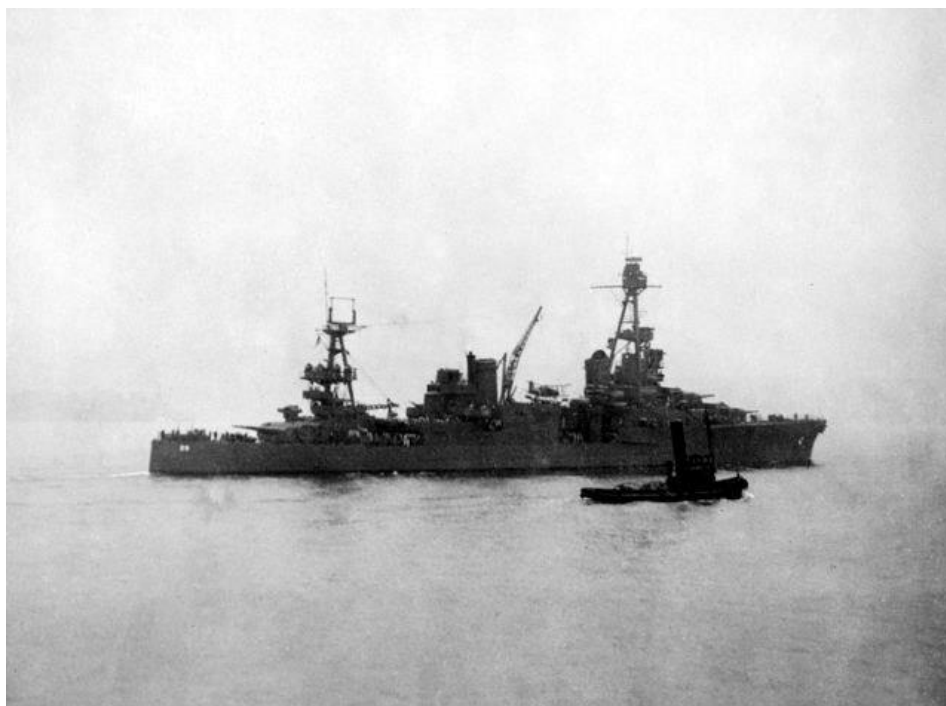
Тяжёлый крейсер Chicago в гавани Сиднея, 31 мая 1942 года.

На следующий день лодки-матки подошли ближе к входу в гавань, заняв позиции в 6-8 милях от него. Экипажи сверхмалых лодок начали готовиться к выходу в море.