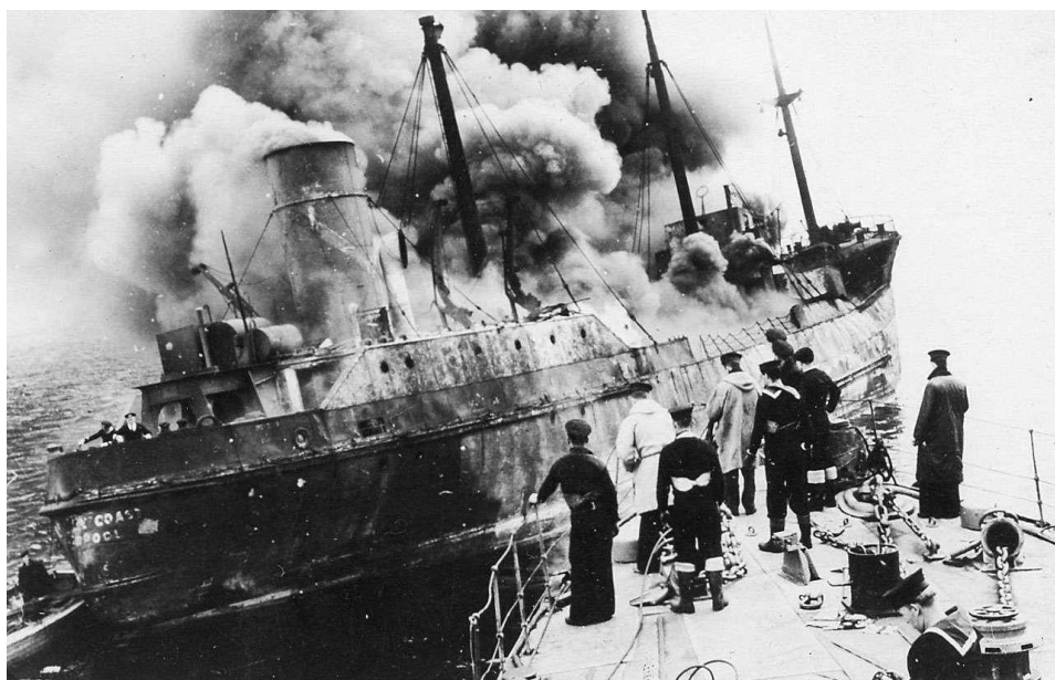
Гибель судна Pembroke Coast

Все еще в море! Мы провели пару дней в гавани и вышли в море в 9 утра в среду, 17-го, чтобы встретиться с авианосцем Glorious к СЗ от Ирландии. Так и сделали, затем сопроводили его в Клайд к 7 вечера 18-го. После этого отправились к месту стоянки, но остановились и пробыли над местом контакта [гидроакустического] буя [с подводной лодкой] 24 часа. Однако нам ничего засечь не удалось. После этого взяли курс на север от острова Мэн, чтобы найти замеченную там субмарину. Ее мы тоже так и не нашли. В итоге мы вернулись на заправку в Мёрси к 10 часам вечера в субботу. В воскресенье утром подошли к Глэдстоунским причалам, когда пришел приказ эскортировать транспорт с боеприпасами в Скапа Флоу. Прибыли туда 23-го во вторник.