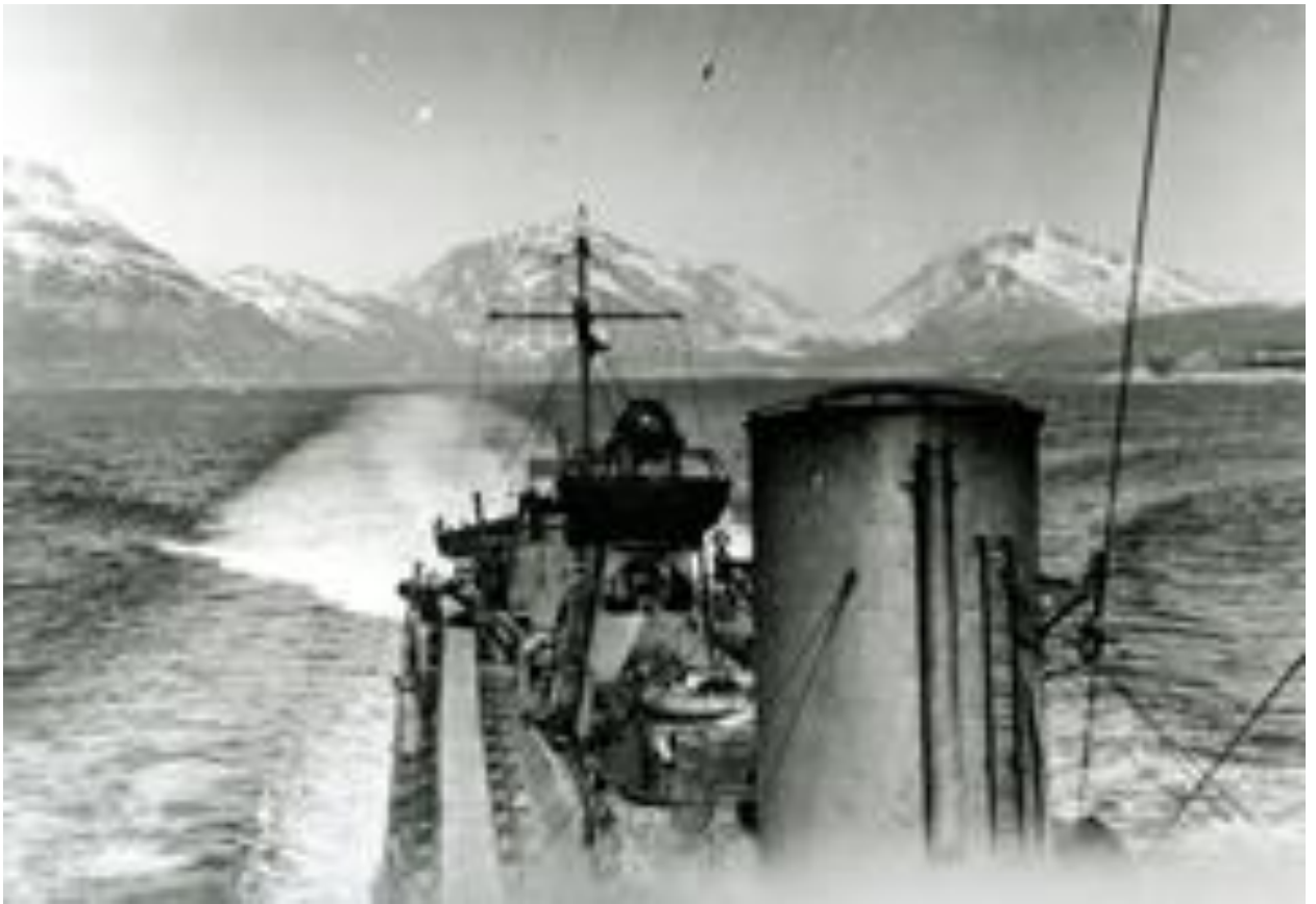
Норвегия, май-июнь 1940 года. На опасном пути через один из фьордов...