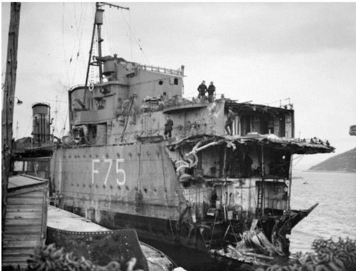
Эсминец Eskimo с оторванной взрывом торпеды носовой частью

глубоким был фьорд. Это заняло у нас полтора часа, и, в итоге, мы встали на якорь там, где глубина была 80 сажень. Днем мы заправились и в 19.30 стали принимать на борт две роты валлийцев из полка South Wales Borderers , чтобы перебросить их в Будё (150 миль к югу вдоль побережья). Пока они грузились, я пошел посмотреть на Eskimo , эсминца класса Tribal , которому торпедой оторвало носовую часть. Корабль выглядел жалкой развалиной. В 20 футах от него лежал британский самолет флотской авиации, сбитый немцами. Лейтенант ирландских гвардейцев, с которым я переговорил, рассказал о невероятной британской организационной неэффективности – никто ничего не делает, кроме того, что торчит под бомбами днем и ночью. Все и повсюду сетуют об отсутствии истребителей, которые могут бороться с немецкими бомбардировщиками.