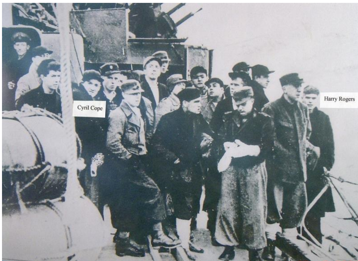
Британские моряки, выжившие после гибели эсминца Hardy. Они были спасены немцами. Многие из добравшихся до берега погибли от переохлаждения