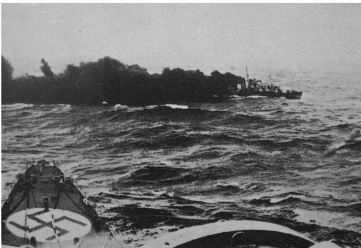
Горящий Glowworm. Слева – носовая часть крейсера Admiral von Hipper https://www.submerged.co.uk/cyril-cope-survivor-from-h-m-s-hardy/