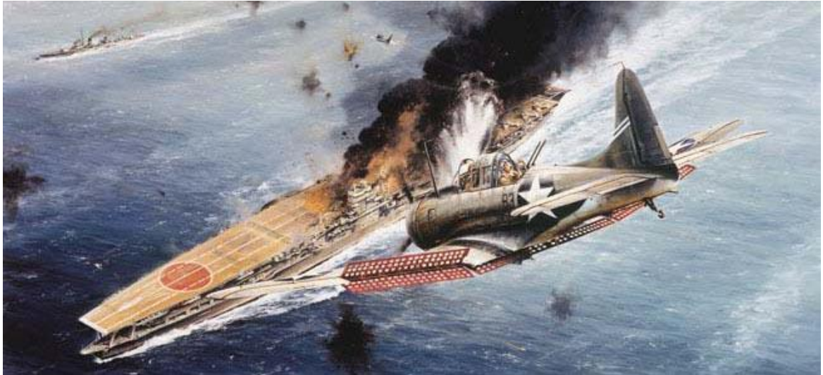
Американский пикирующий бомбардировщик в атаке на японский авианосец (картина) ( http://warfarehistorynetwork.com/daily/wwii/the-battle-of-midway-turning-the-tide-of-pacific-war/ )