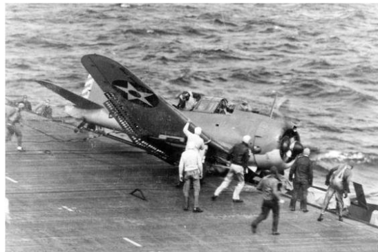
Слева Донтлесс после удачной посадки, справа – после неудачной

(https://au.pinterest.com/pin/342977327848180315/)