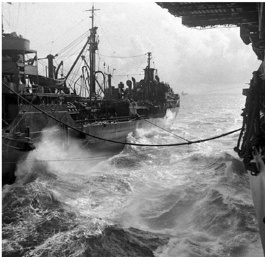
Escambia во время заправки авианосца Ticonderoga. 26 июля 1945 года

Ежедневная жизнь на борту заправщика состоит из подъема и заправки, на которой ты работаешь весь день. Поел, постоял на вахте, немного поспал. Большую часть времени, проведенного в море, мы спали одетыми. Через день мы принимали душ, одежду обычно меняли два раза в неделю. Специально отведенных для отдыха мест не было. На верхней палубе не было никакого освещения, поэтому нужно было чувствовать, в каком направлении идти.