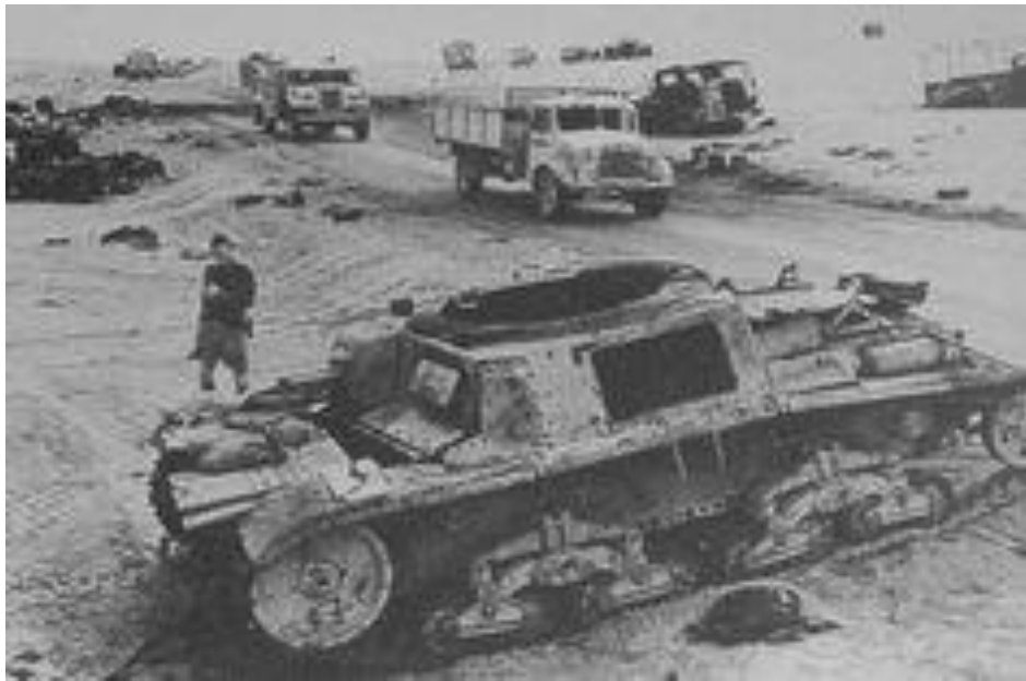
Разгромленная итальянская колонна. 1940 год

Мы медленно вернулись к Прыщу . Тем временем итальянские санитары пытались понять, что к чему и подобрать раненых. Наши потери были минимальными. Несколько осколочных и пулевых ранений, раны от осколков брони. Я знаю, что и по сей день в мозгах участвовавших в этом побоище танкистов остались шрамы.