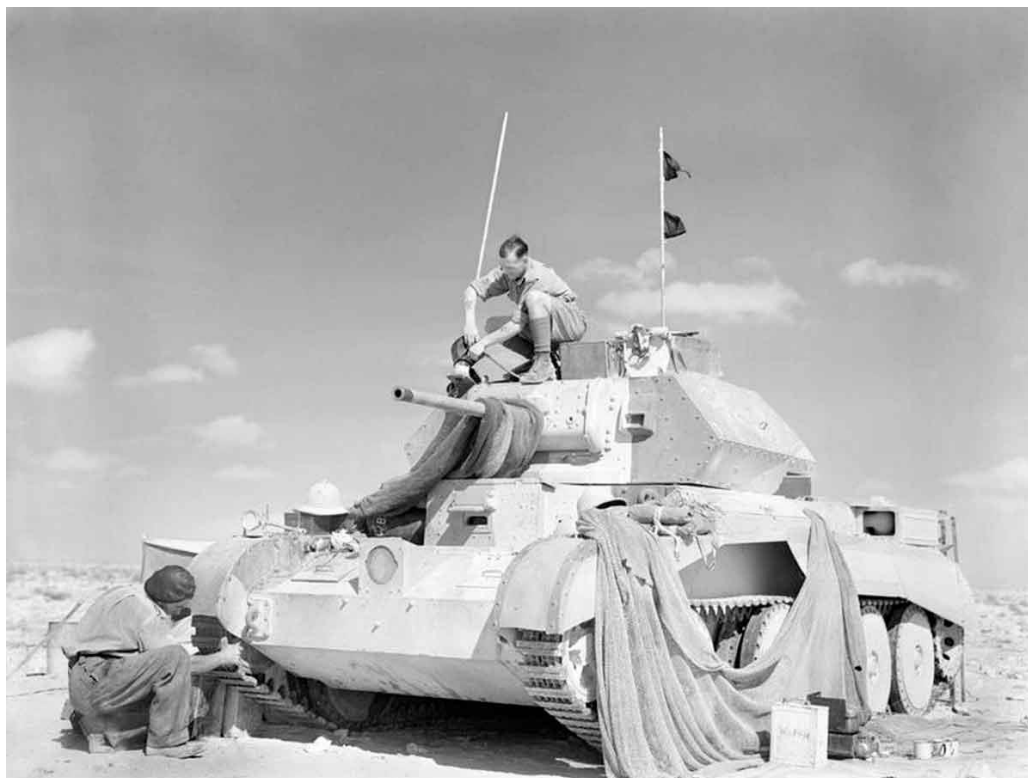
Британские танкисты осматривают недавно доставленный танк А13. Египет, ноябрь 1940 года

Бронетехника находилась где-то в миле от штаба, машины были замаскированы сетками, в десяти ярдах от каждой были вырыты глубокие окопы. Окопы были разбросаны, и каждый экипаж готовил еду себе сам. Каждый день грузовики подвозили провиант, боеприпасы, горючее и воду из тыла. Ничего особенного пока не происходило.