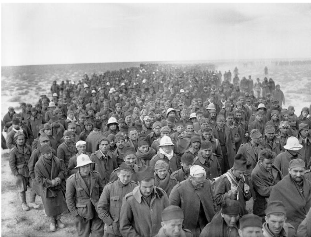
Итальянские военнопленные, захваченные в Бардии. 6 января 1941 года

У один из наших штабных танков заклинило башню. Он шел в атаку на противотанковую пушку противника, находившуюся в орудийном окопе. Не сворачивая, водитель пошел на таран, и смял пушку со всем расчетом... Ливийцы и итальянцы не оказывали упорного сопротивления после того, как были подавлены их артиллерийские позиции и были обращены в бегство или уничтожены их танки. Сбор пленных был некоторой проблемой, потому что их было очень много! На захваченных позициях итальянцев чего только не было. Кроме пустых ящиков из-под боеприпасов и раздавленных пулеметов мы находили там тысячи пачек с сигаретами и маленьких бутылочек с минеральной водой Vichy . Иногда мы натыкались на склянки с духами и коробки с презервативами. Земля была часто усыпана порнографическими фотографиями. Единственным сувениром, который все жаждали заполучить, был маленький штык, который носили с собой итальянские пехотинцы. Этот штык был очень полезной вещью. Еще мы охотились за небольшими спальными мешками с камуфляжным чехлом. Из них можно было делать небольшие палатки. Сигареты, однако, были набиты ужасным темным табаком, назывались они, если я запомнил правильно, Tres Stellas .