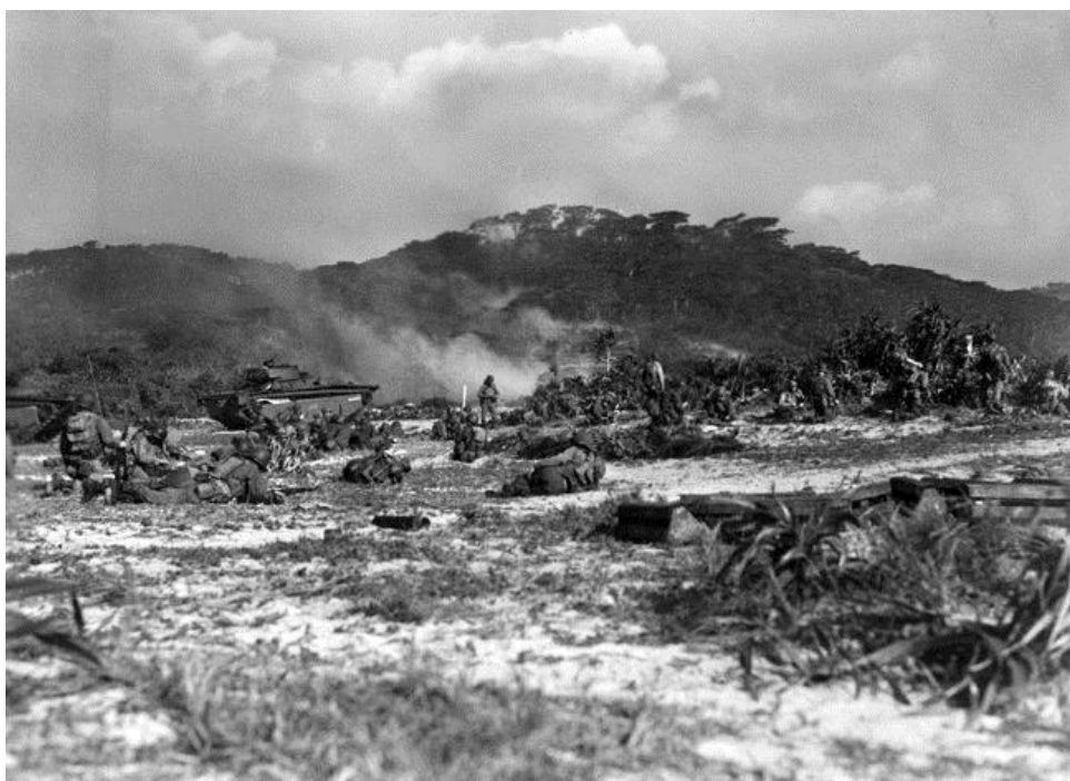
Солдаты 306-й Полковой Группы высаживаются на остров Герума в ходе операции Айсберг. 26 марта 1944 года.