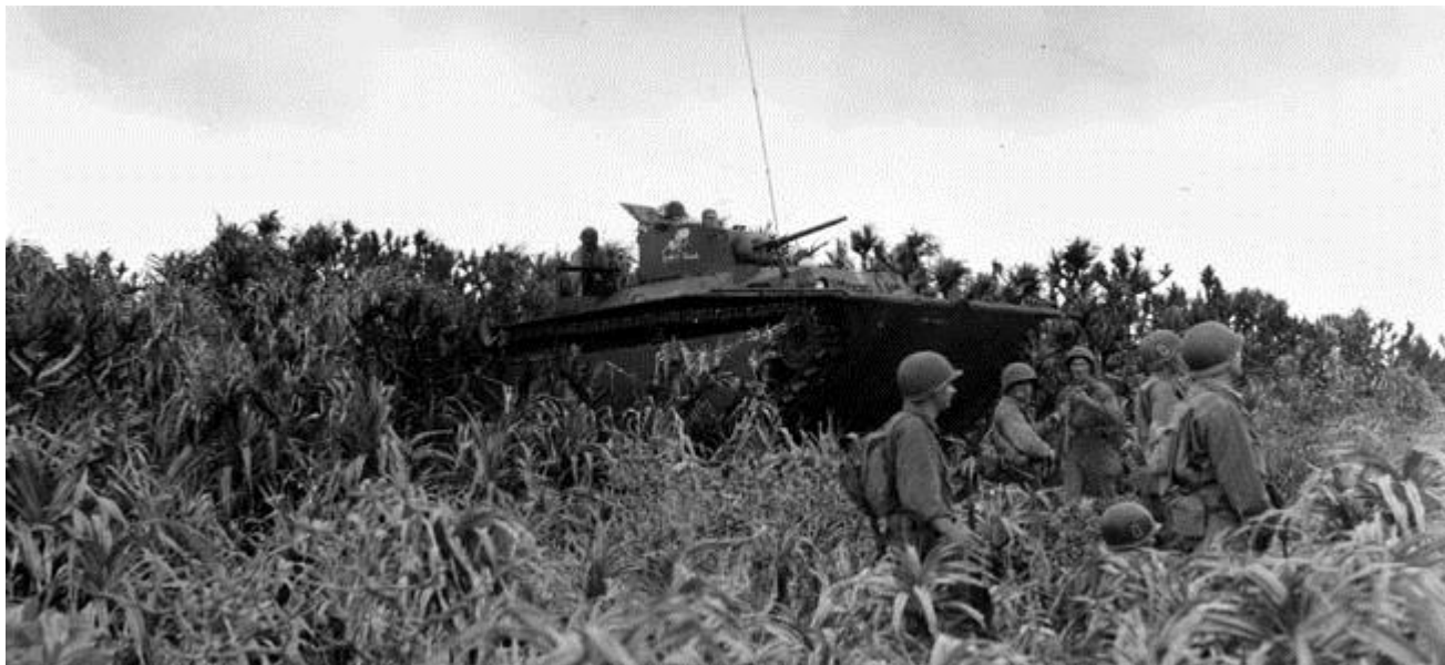
Американские пехотинцы на одном из островов архипелага Керاما