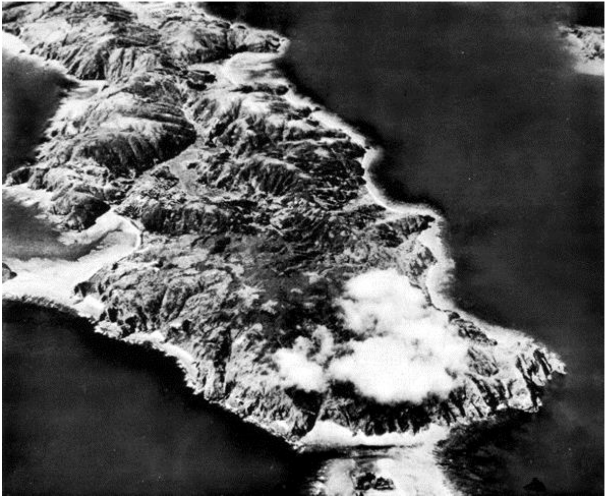
Вид на остров Токасики с воздуха

https://history.army.mil/books/wwii/okinawa/chapter2.htm