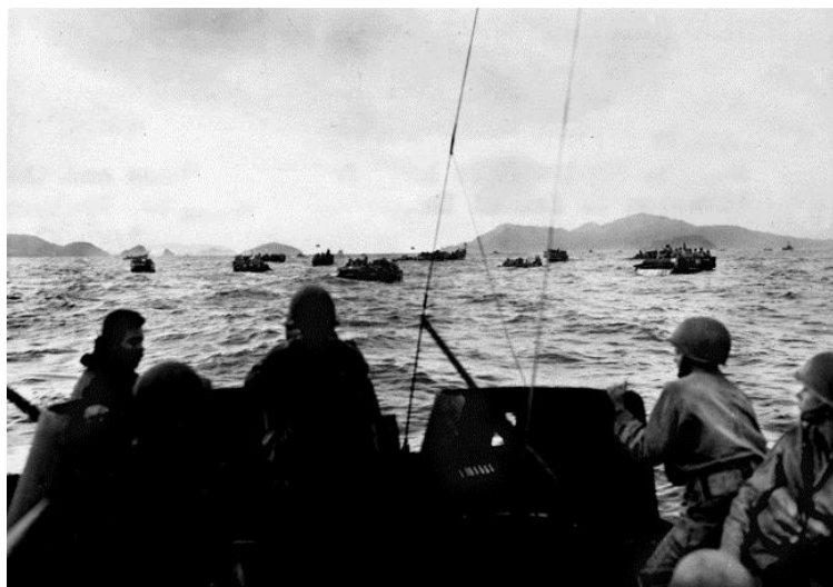
Амфибийные гусеничные транспортеры 1-го Батальона 305-го Полка 77-й Дивизии приближаются к участку высадки на острове Дзамами...