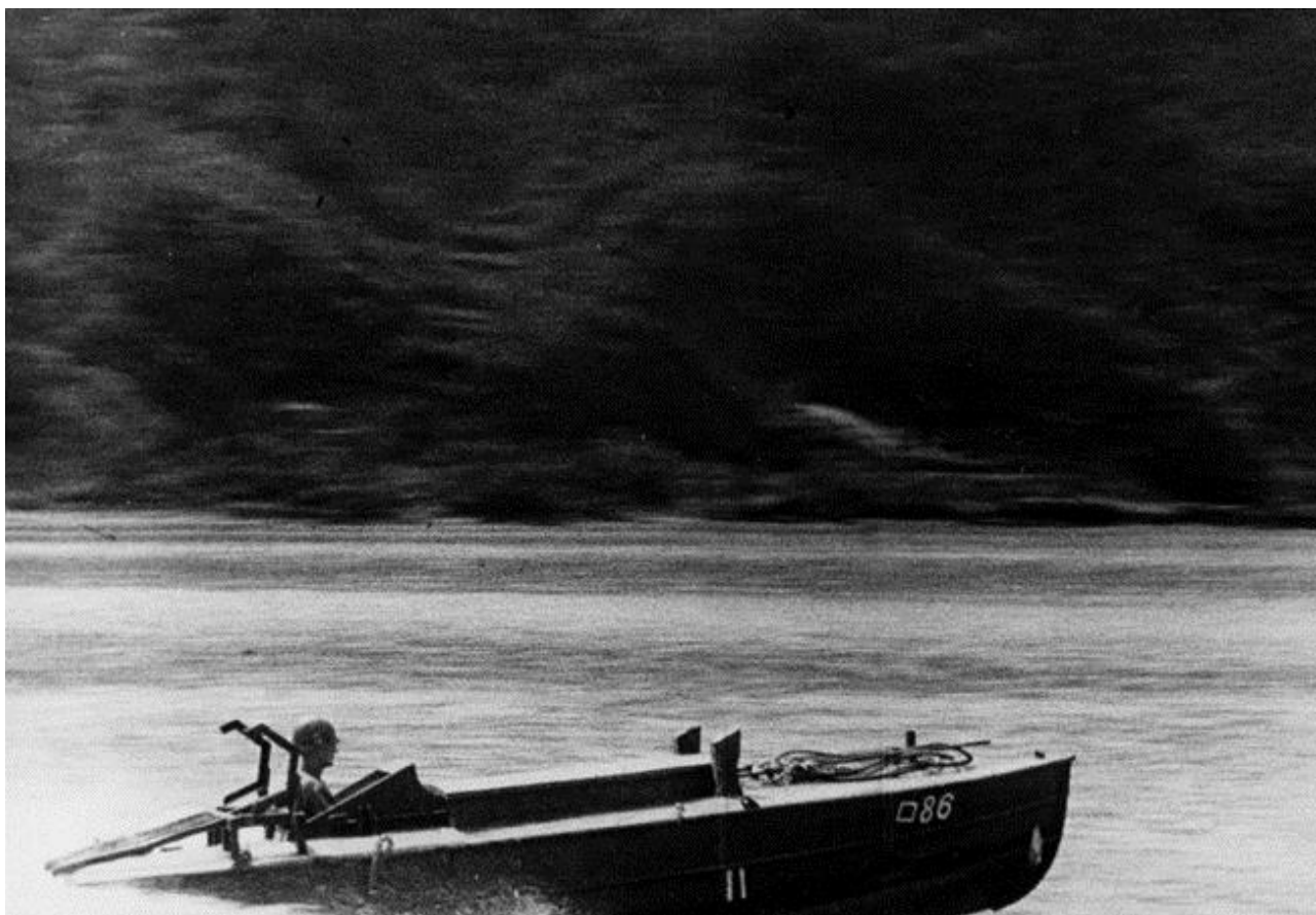
Американец на захваченном у японцев катере-самоубийце